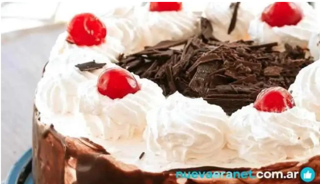
Panificadora pugliese sucluis agote comida y bebida