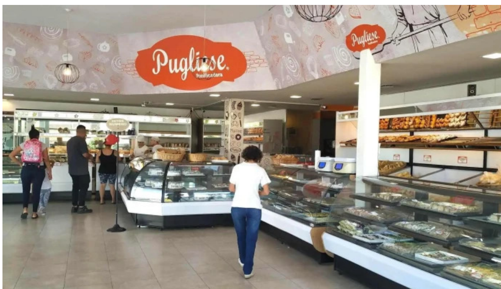
Panificadora pugliese sucluis agote ambiente