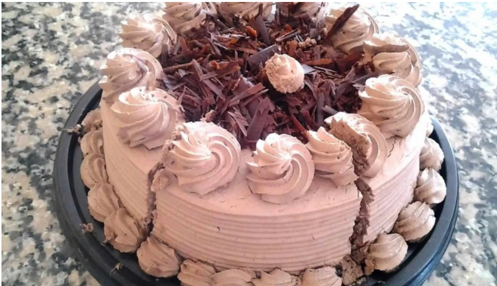
Panificadora pugliese sucluis agote del propietario