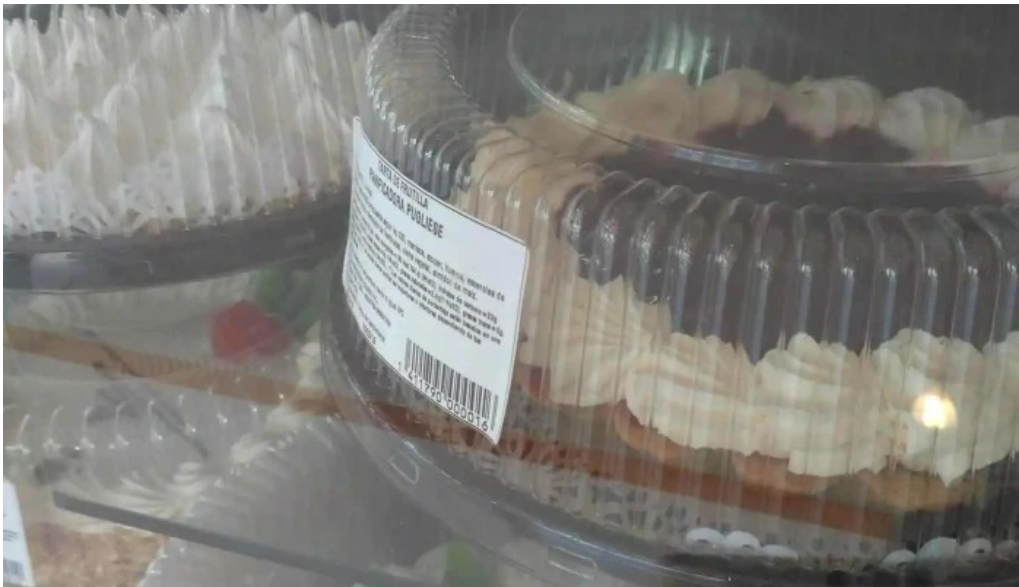
Panificadora pugliese sucluis agote vetrina