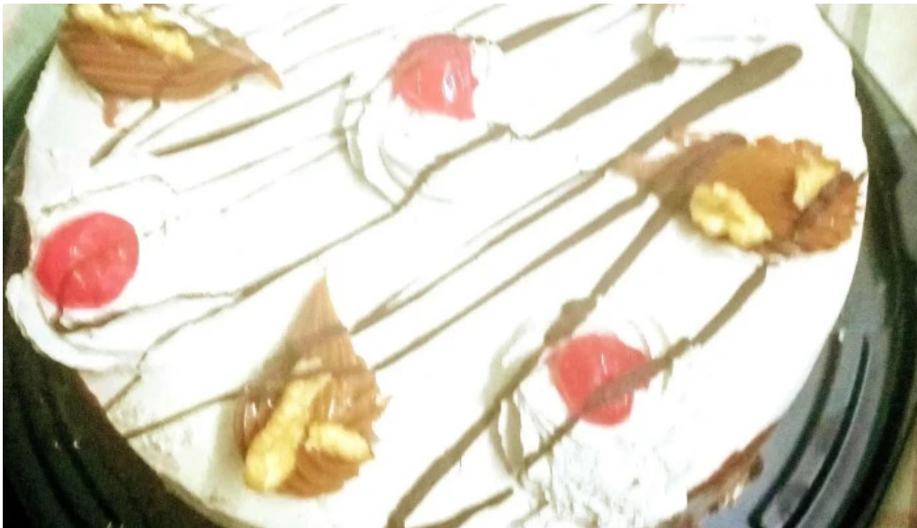
Panificadora pugliese sucluis agote cordoba