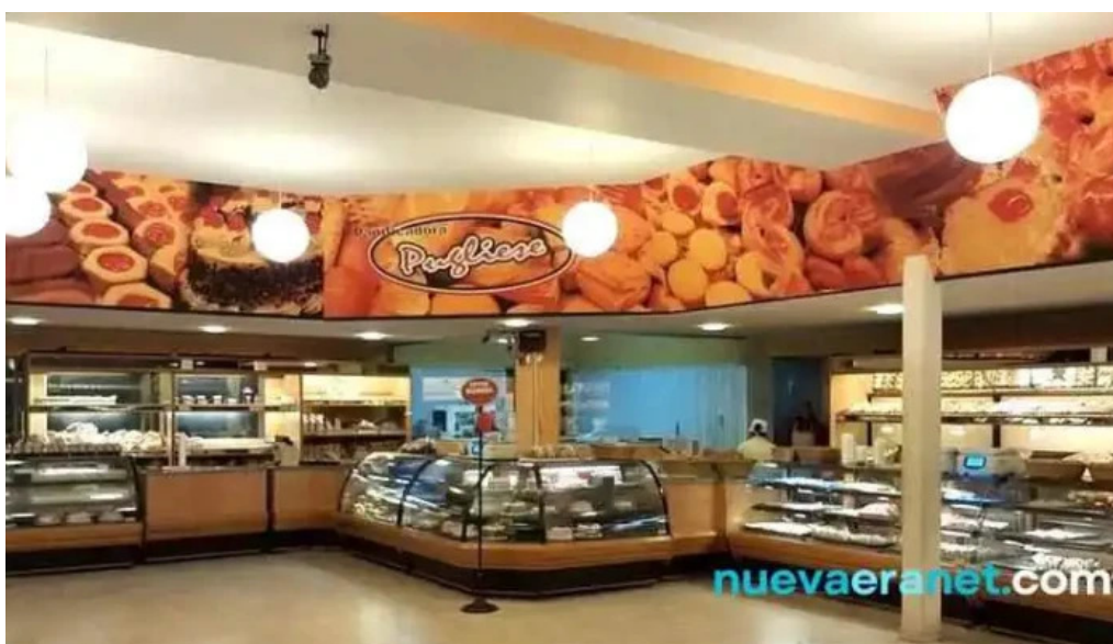
Panificadora pugliese suc luis agote cordoba