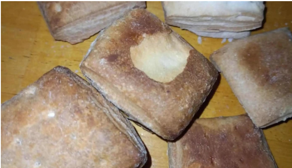
Panificadora pugliese sucluis agote videos