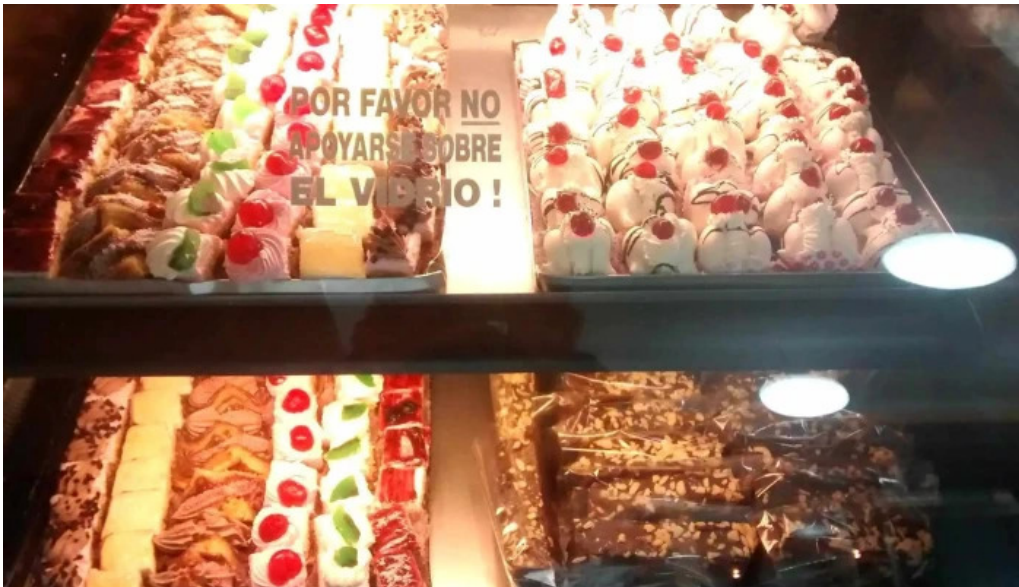
Panificadora pugliese sucluis agote pastel