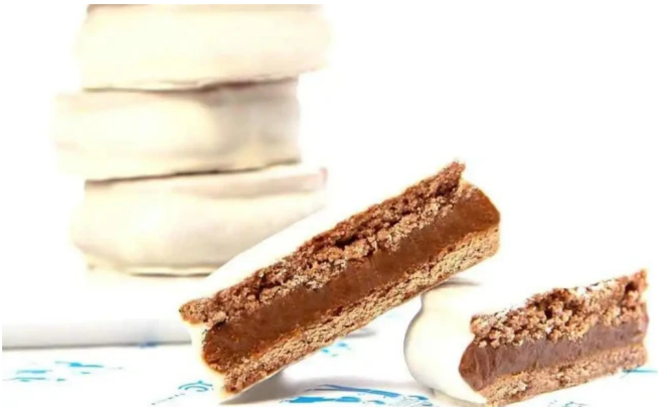
La celester PAnADERIA 1952 sucursal independencia chocolate