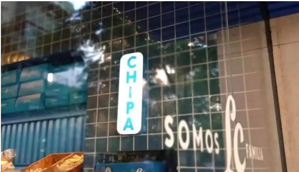
La celeste® – ?????????? 1952 sucursal independencia cordoba

nuestro equipo administrativo y en cuanto nos den una respuesta nos comunicaremos por este medio!