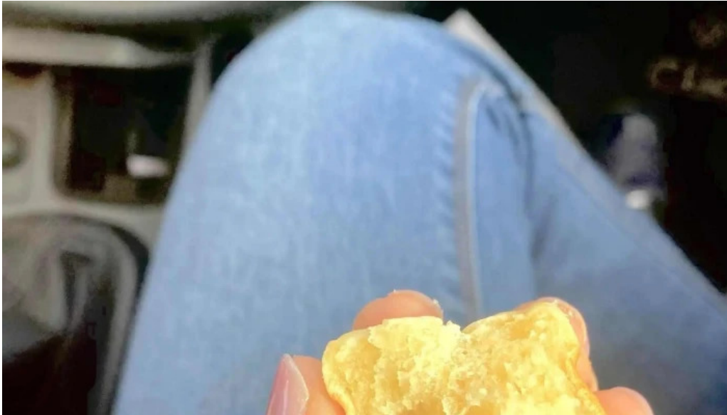
La celester PAnADERIA 1952 sucursal independencia donde