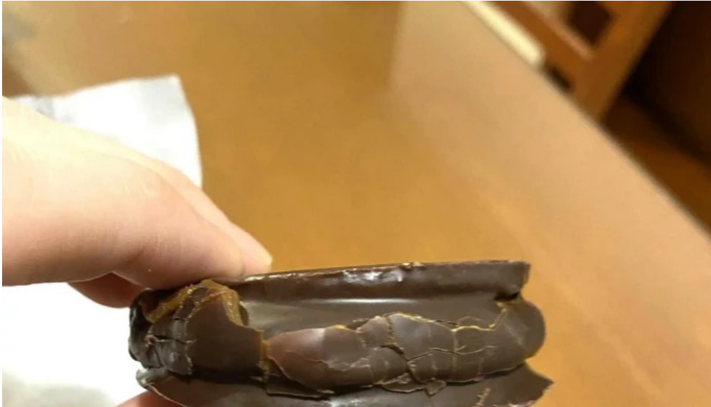
La celester PAnADERIA 1952 sucursal independencia cordoba