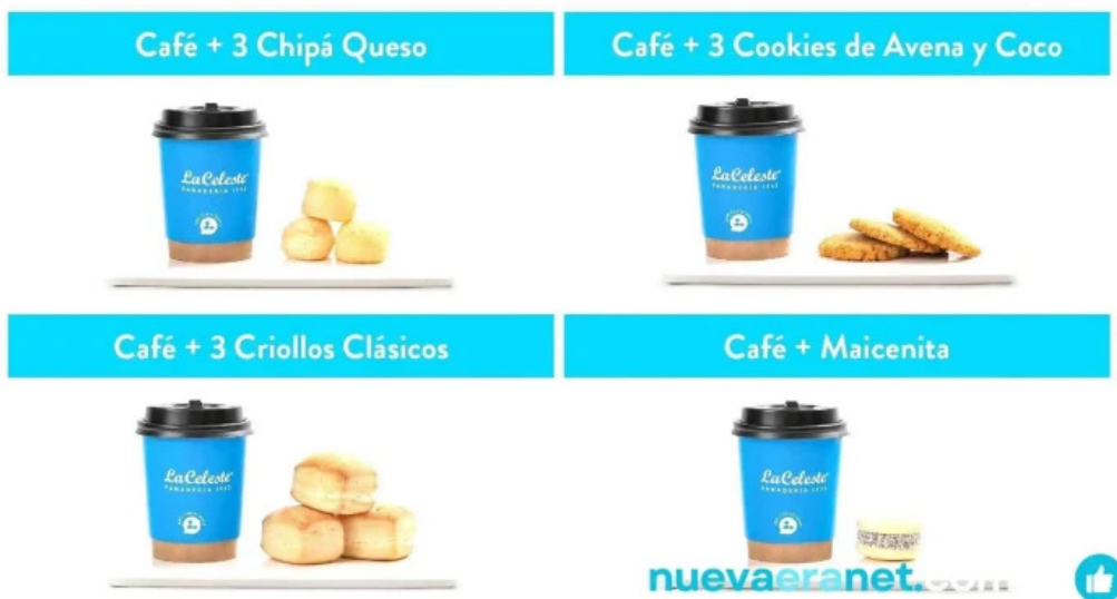
La celester PAnADERIA 1952 sucursal independencia carta