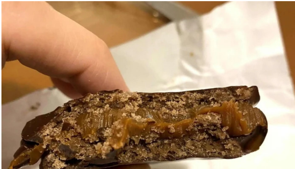
La celester PAnADERIA 1952 sucursal independencia horario