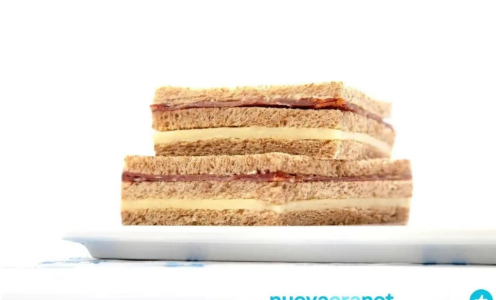
La celester PAnADERIA 1952 sucursal independencia comida y bebida