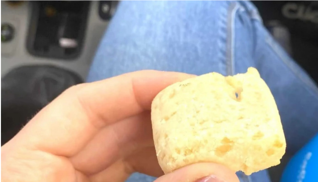
La celester PAnADERIA 1952 sucursal independencia sitio web