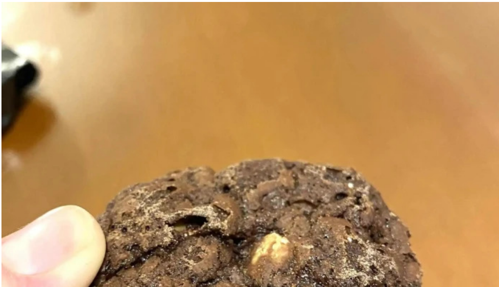
La celester PAnADERIA 1952 sucursal independencia comentarios