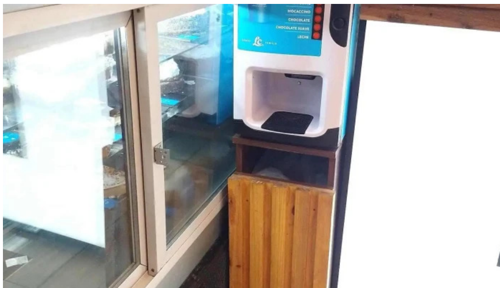
La celester PAnADERIA 1952 sucursal independencia ambiente