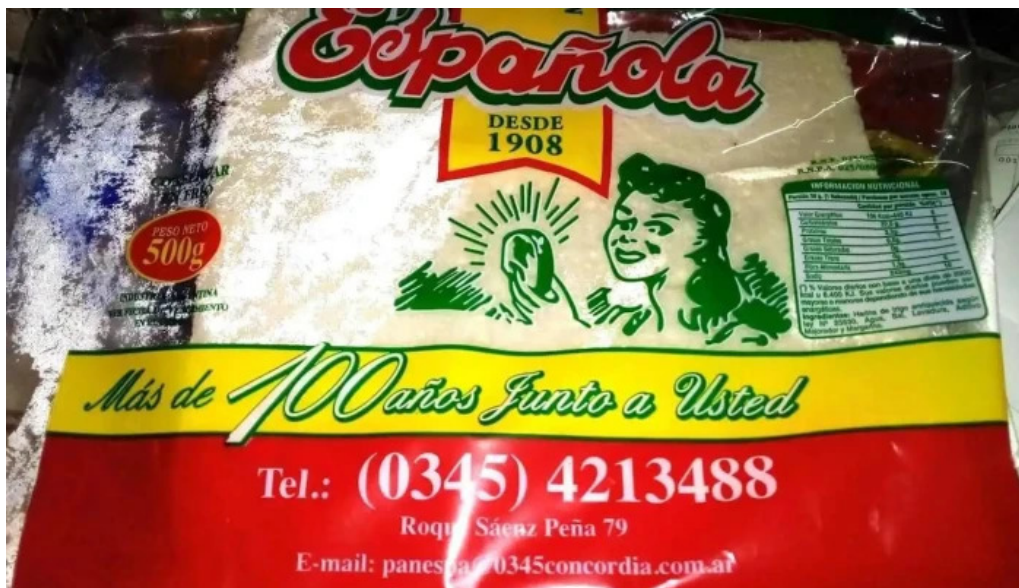
Panificacion espanola concordia