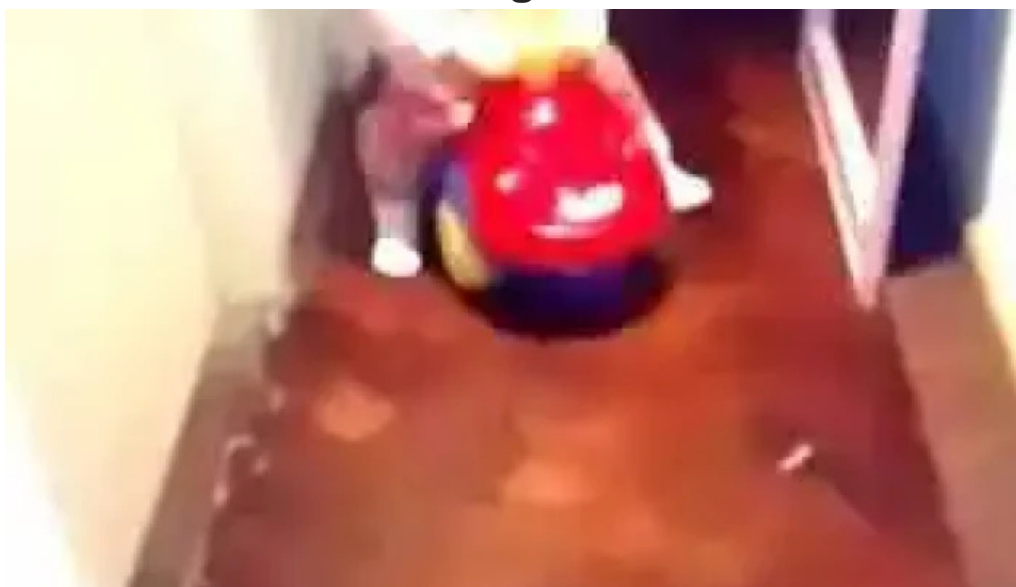
Panificacion espanola videos