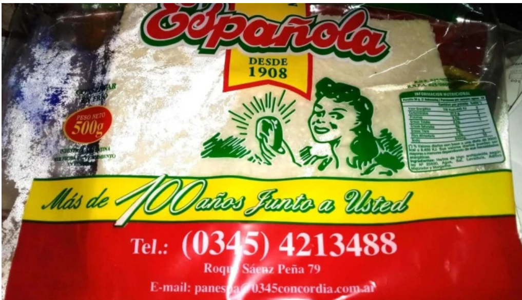
Panificacion espanola opiniones