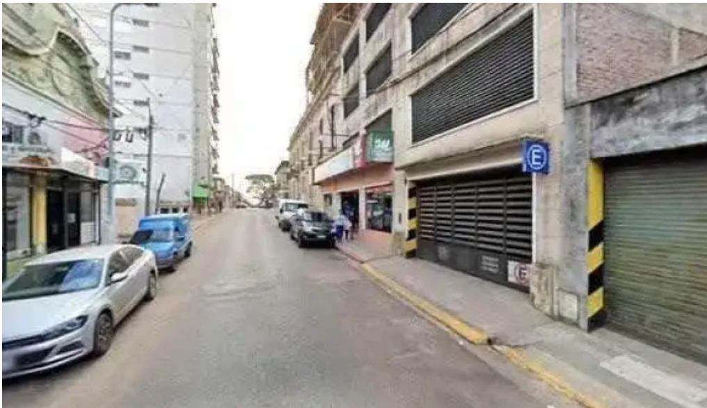
Panificacion espanola opinionesdeg