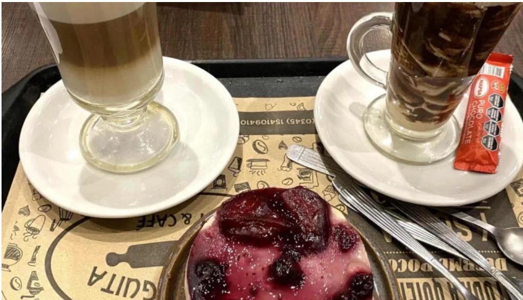
La milonguita panaderia y cafe concordia