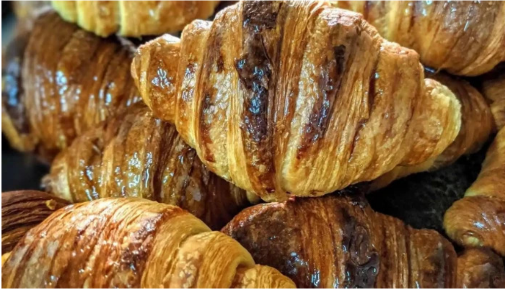
La milonguita panaderia y cafe comida y bebida