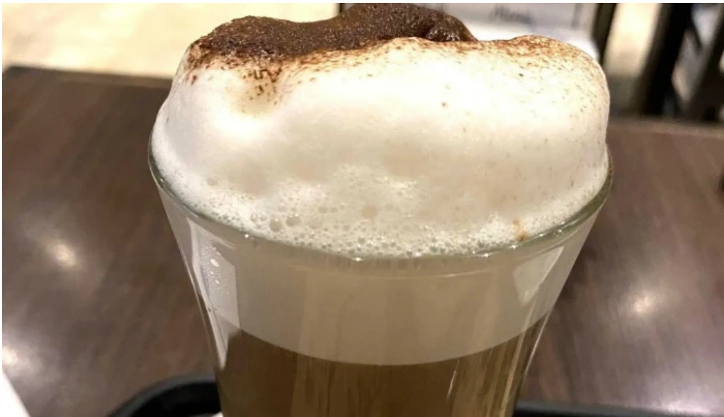
La milonguita panaderia y cafe numero