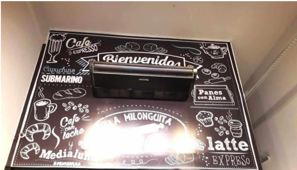
La milonguita panaderia y cafe carta