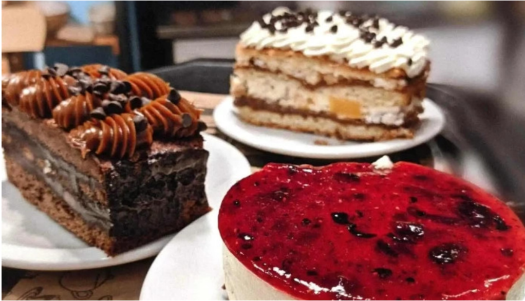
La milonguita panaderia y cafe pastel