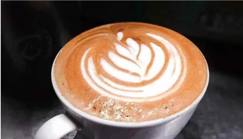
La milonguita panaderia y cafe capuchino