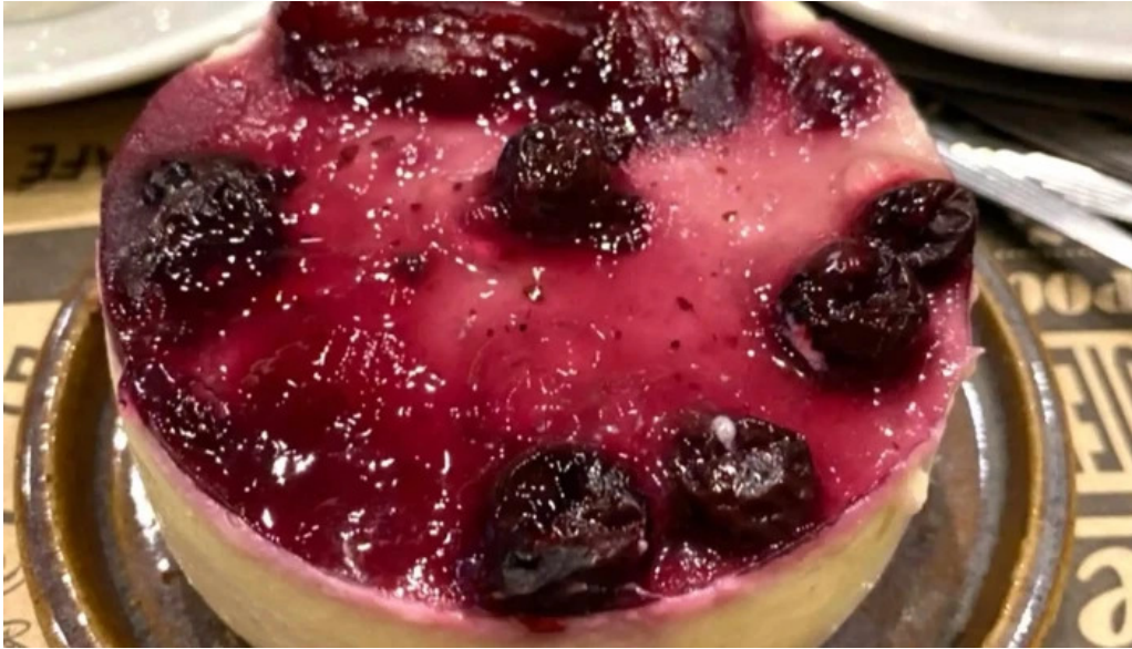
La milonguita panaderia y cafe descuentos