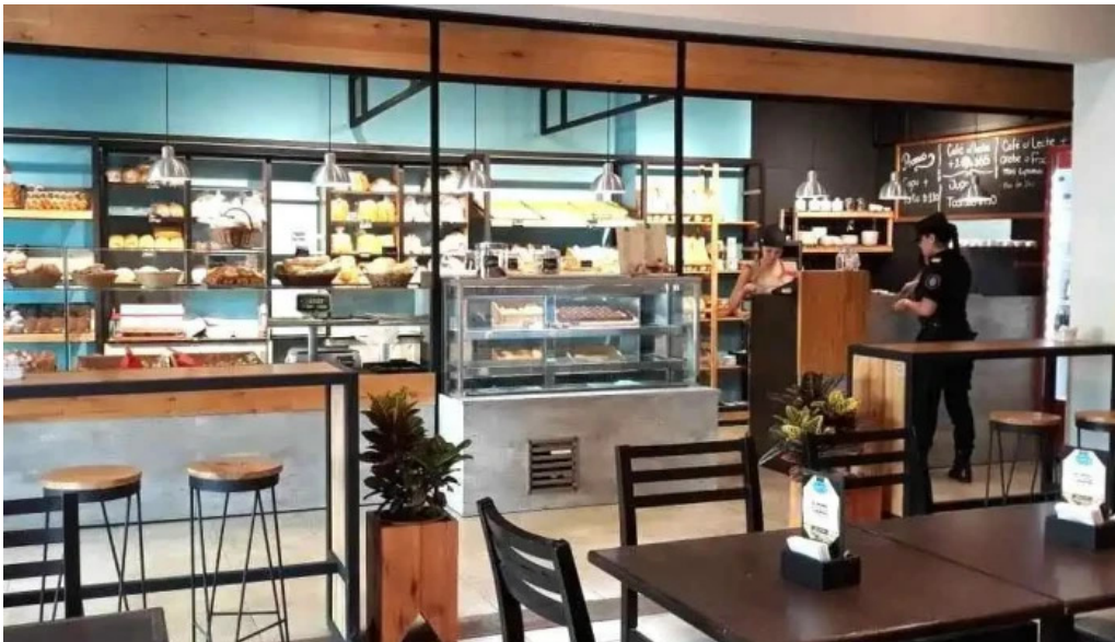
La milonguita panaderia y cafe ambiente