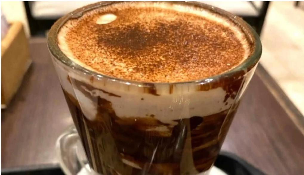
La milonguita panaderia y cafe ubicacion