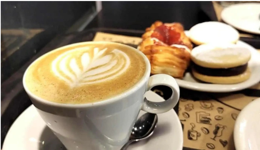
La milonguita panaderia y cafe del propietario