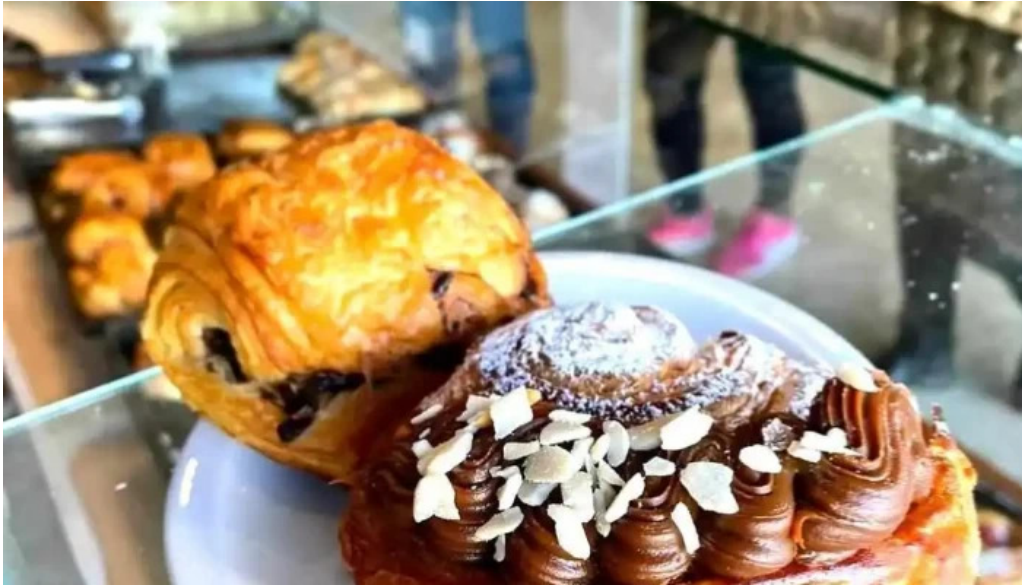
La milonguita panaderia y cafe croissant