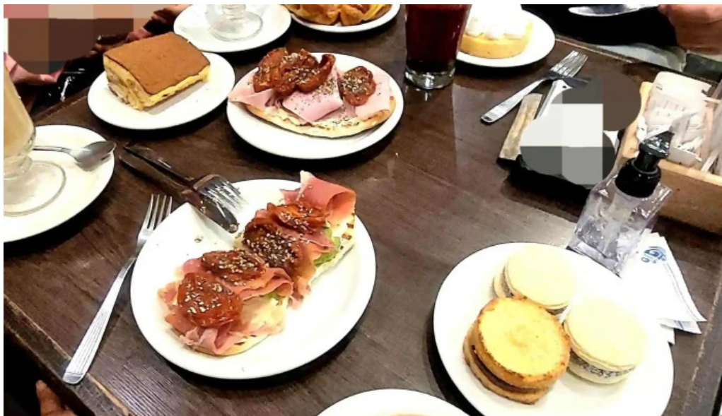
La milonguita panaderia y cafe instagram