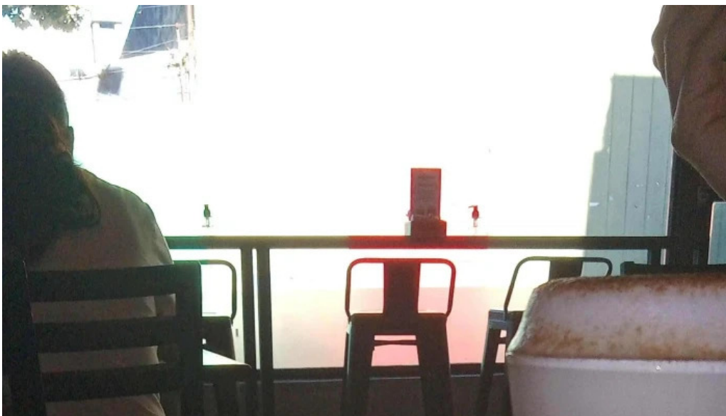
La milonguita panaderia y cafe precios