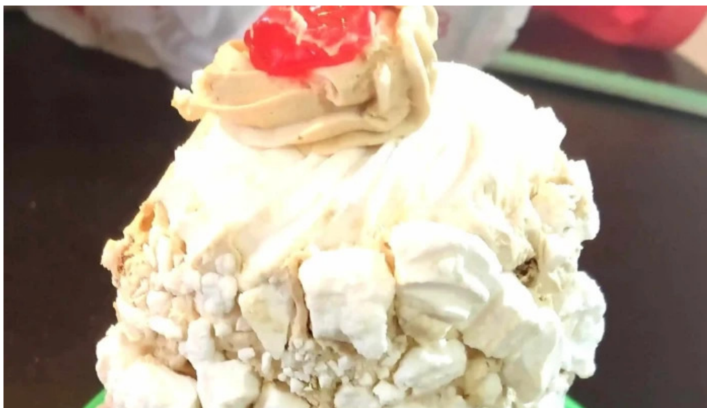
Panaderia y confiteria san carlos donde