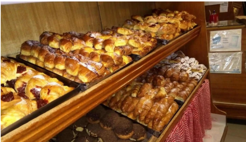
Panaderia y confiteria san carlos vitrina