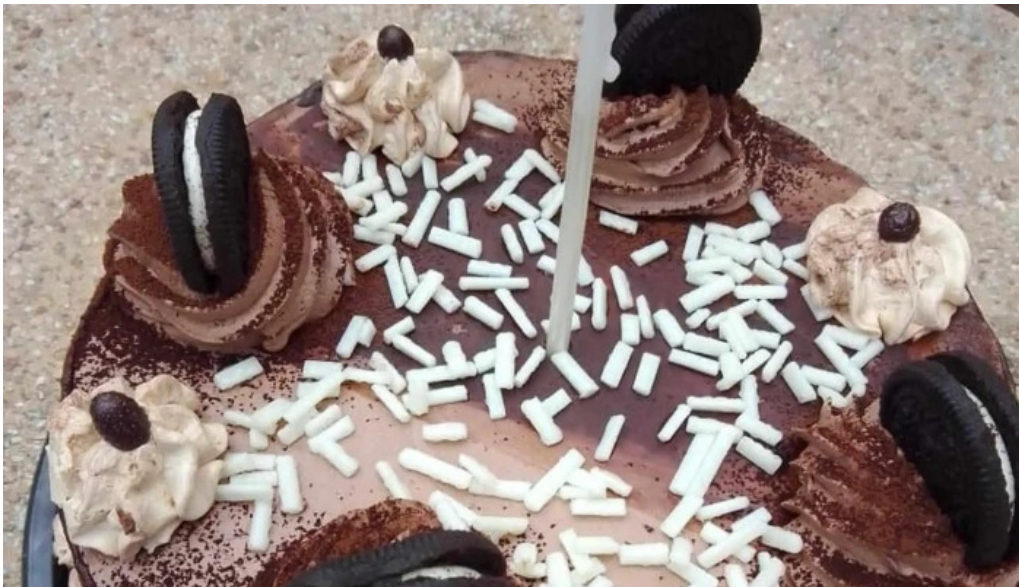
Panaderia y confiteria san carlos concepcion del uruguay