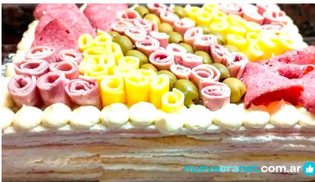
Panaderia y confiteria san carlos del propietario