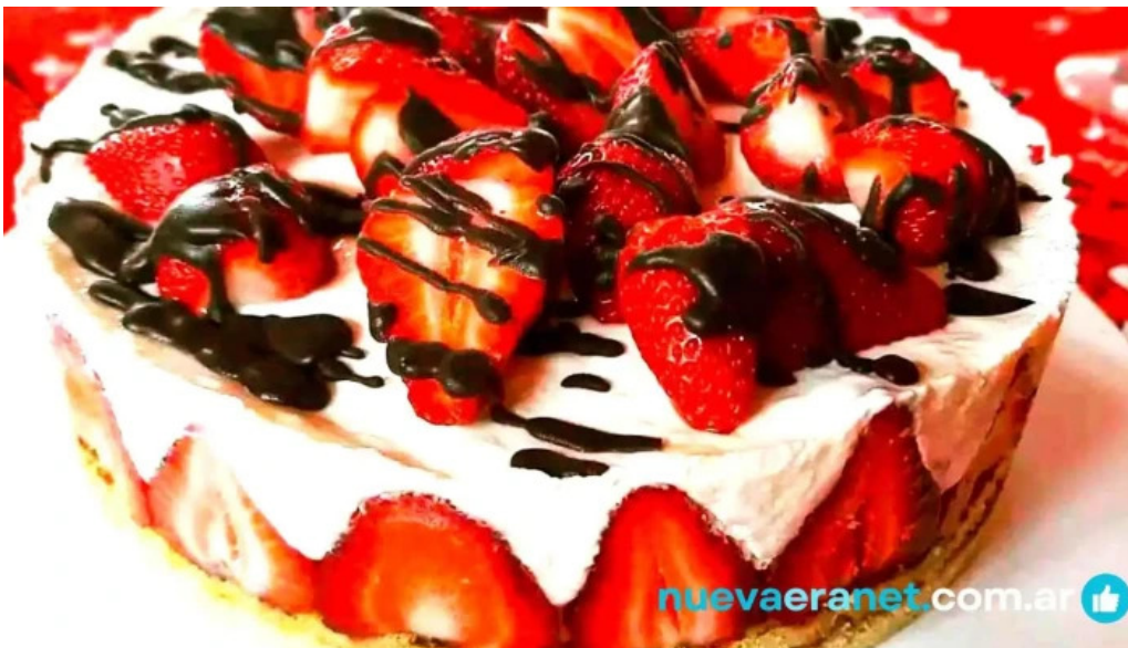
Panaderia y confiteria san carlos comida y bebida