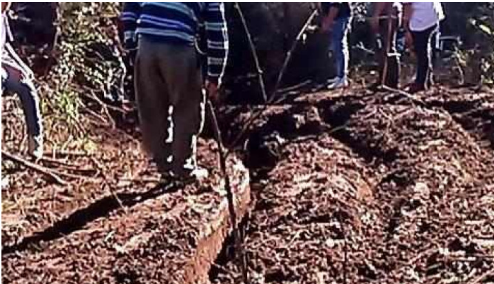
Panaderia y confiteria san carlos videos