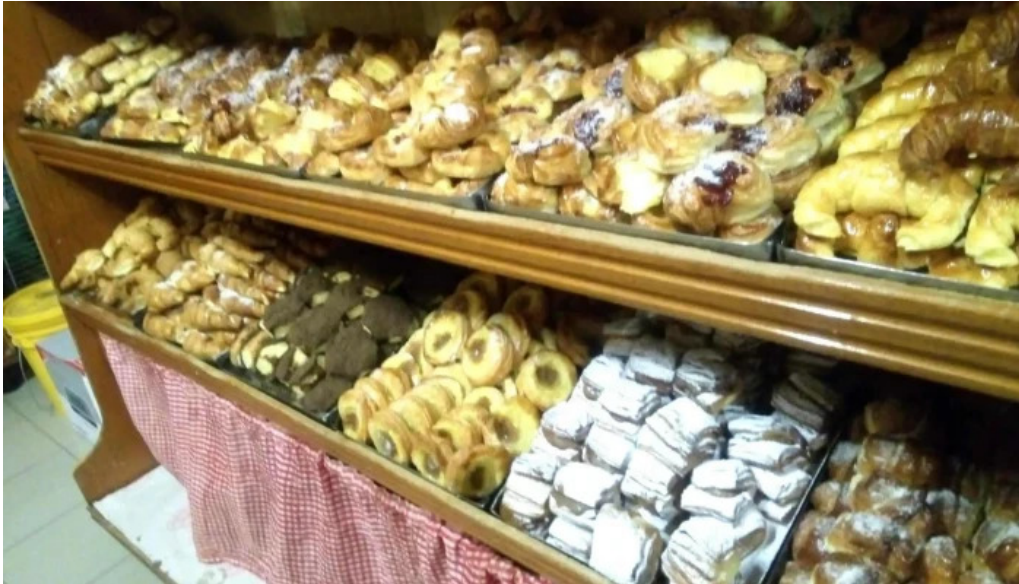
Panaderia y confiteria san carlos ambiente