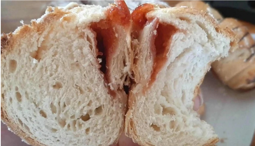
Panificadora don carlos km5 catalogo