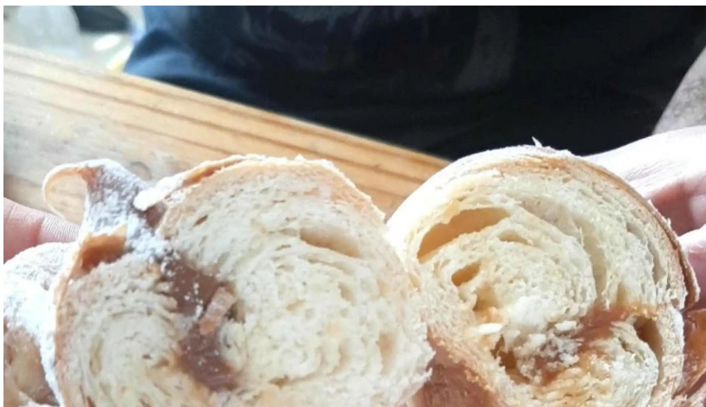
Panificadora don carlos km5 comodoro rivadavia