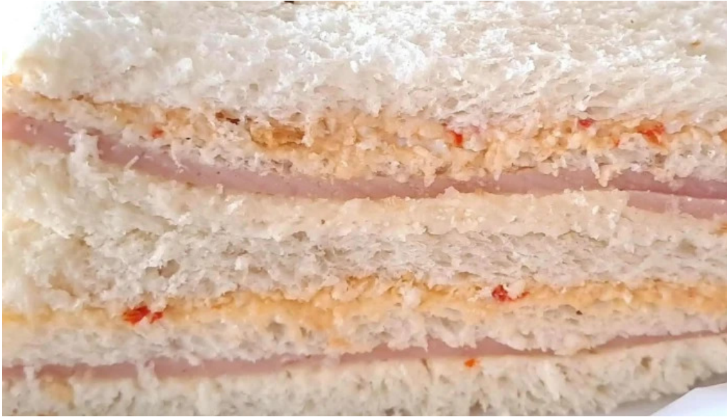
Panificadora don carlos km5 videos