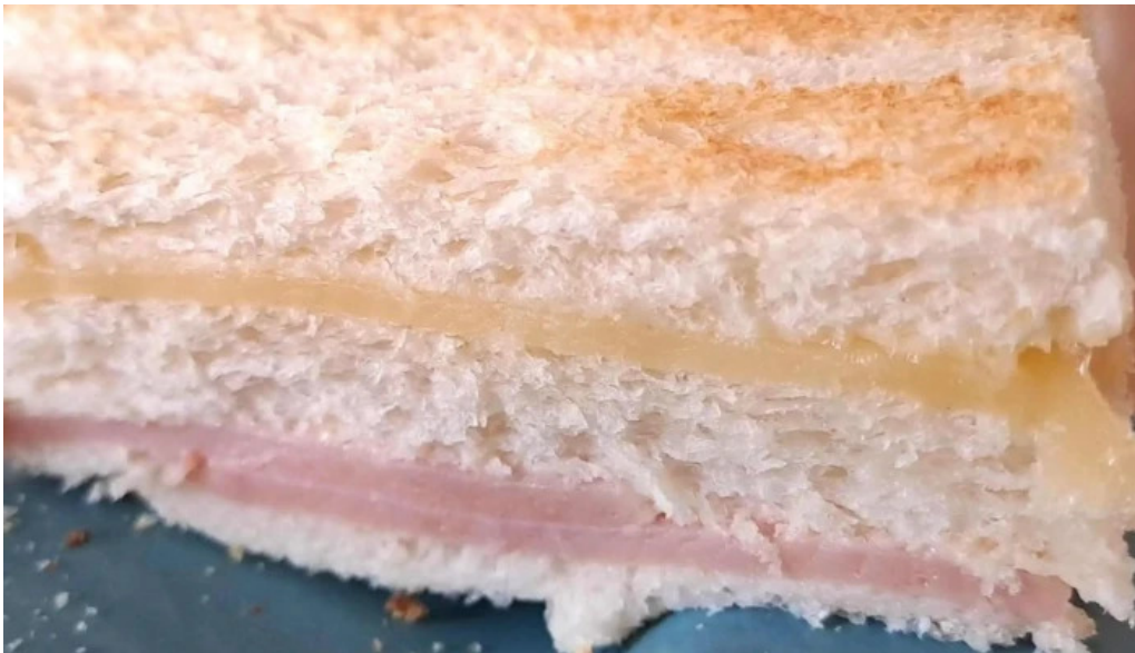
Panificadora don carlos km5 opiniones