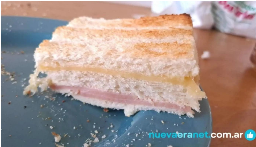
Panificadora don carlos km5 pastel