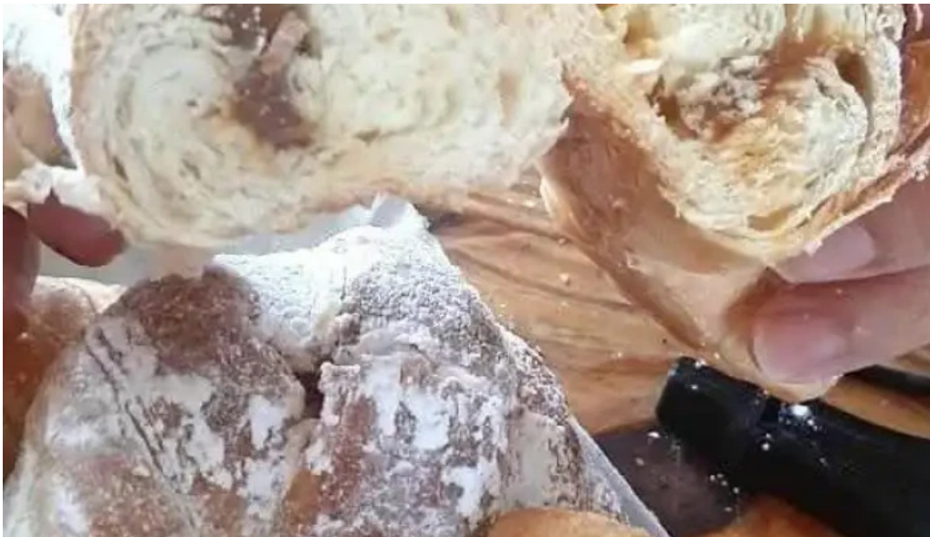
Panificadora don carlos • km5 comodoro rivadavia