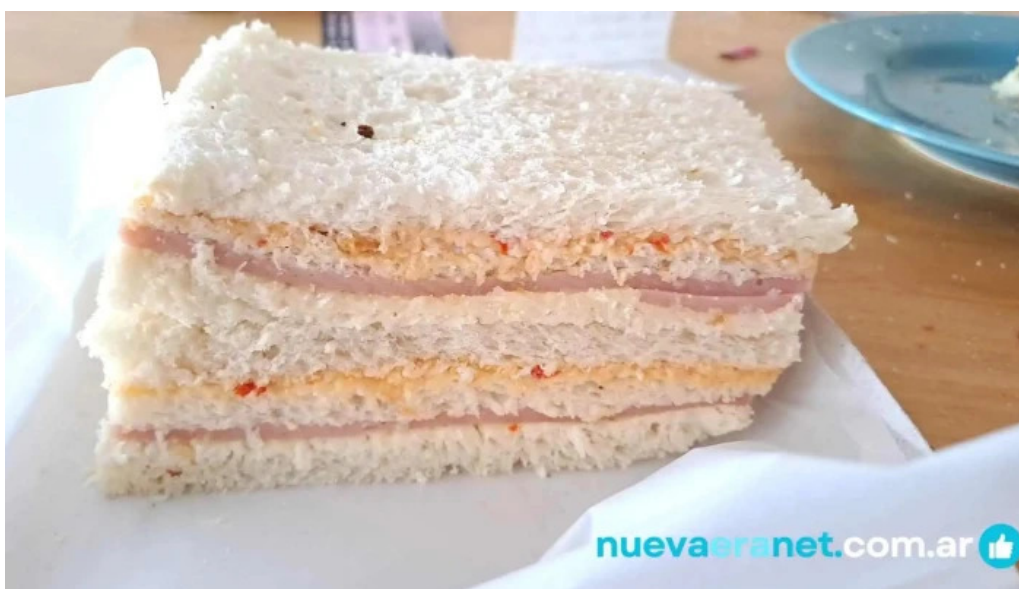
Panificadora don carlos km5 comida y bebida