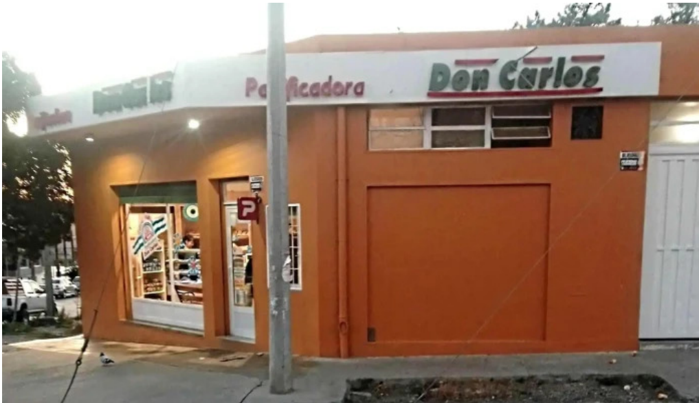
Panificadora don carlos km3 descuentos