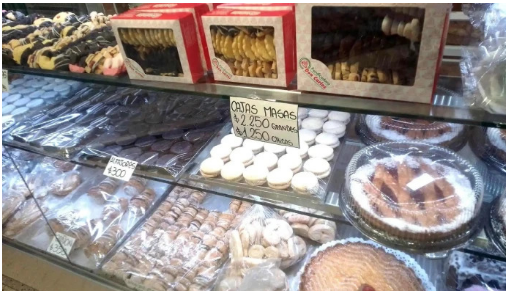
Panificadora don carlos km3 ambiente