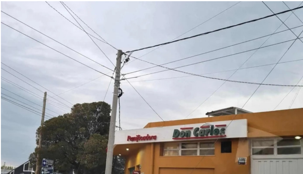
Panificadora don carlos km3 puntaje