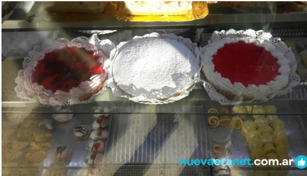
Panificadora don carlos km3 comida y bebida