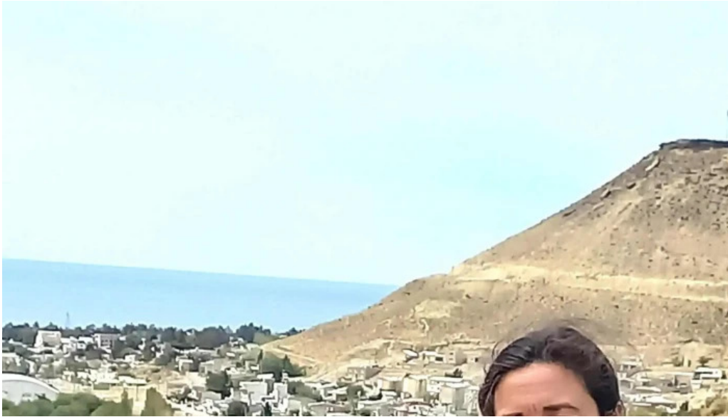
Panificadora don carlos km3 fotos