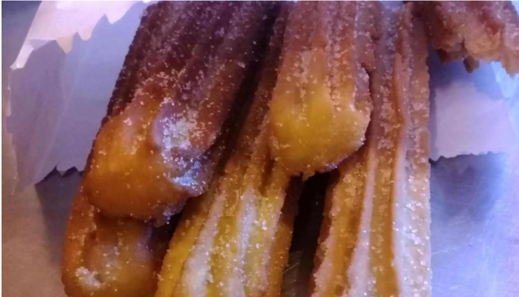
Panificadora don carlos km3 abierto ahora