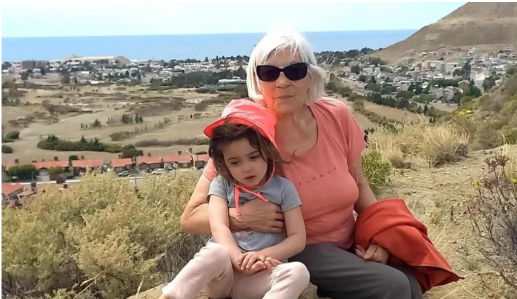
Panificadora don carlos km3 horario