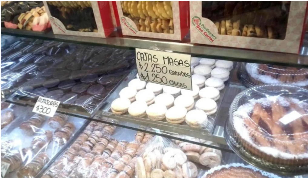
Panificadora don carlos km3 comodoro rivadavia