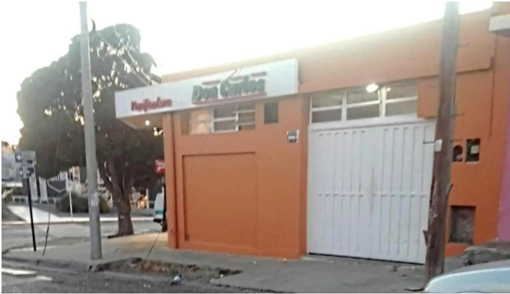
Panificadora don carlos km3 zona

Panificadora don carlos • km3 comodoro rivadavia