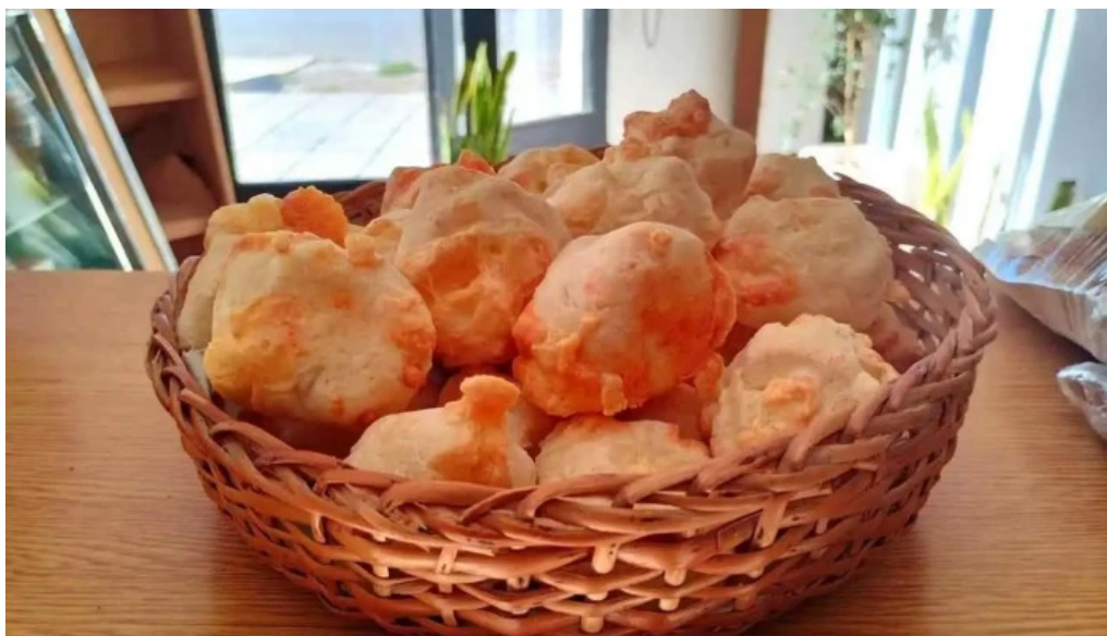
Panaderia san felipe comida y bebida