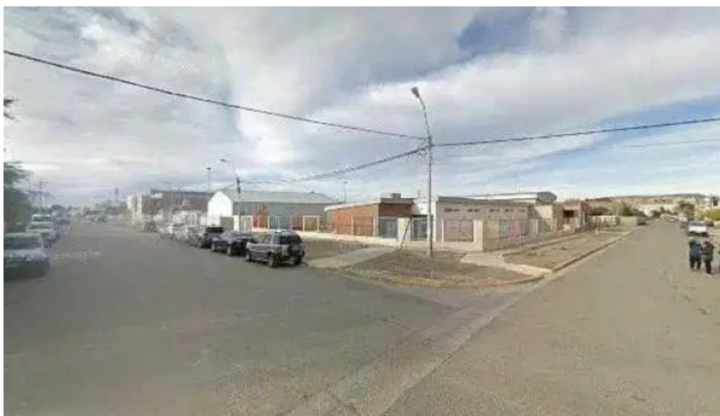
Panadería san felipe fotosdeg