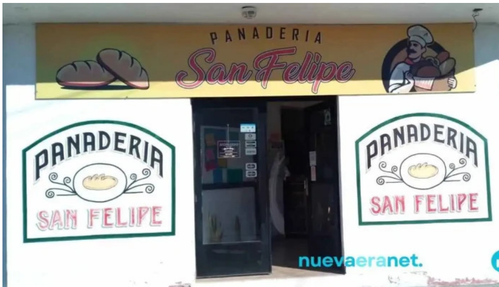
Panaderia san felipe fotos