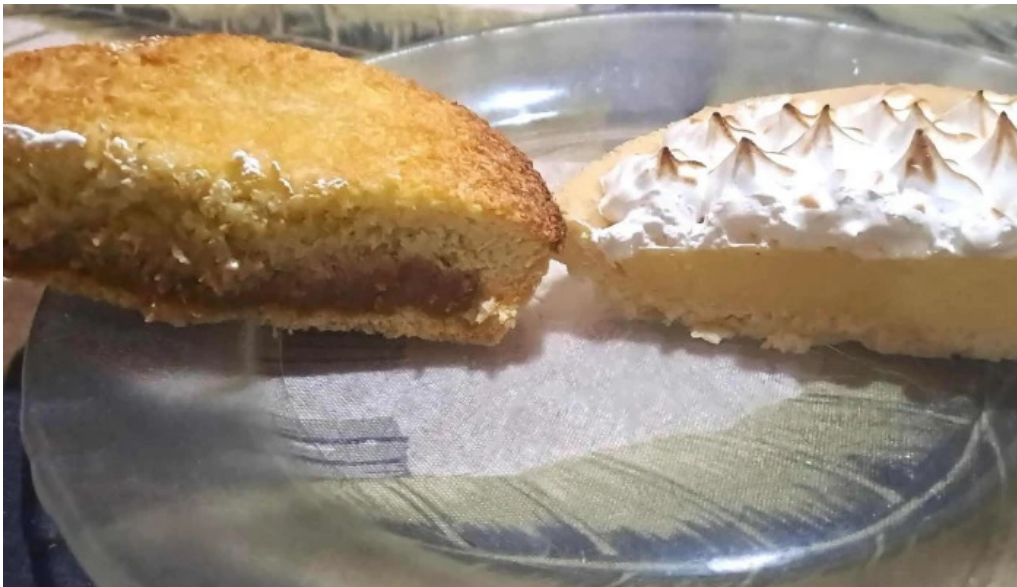
Panaderia amapola gluten free abierto ahora