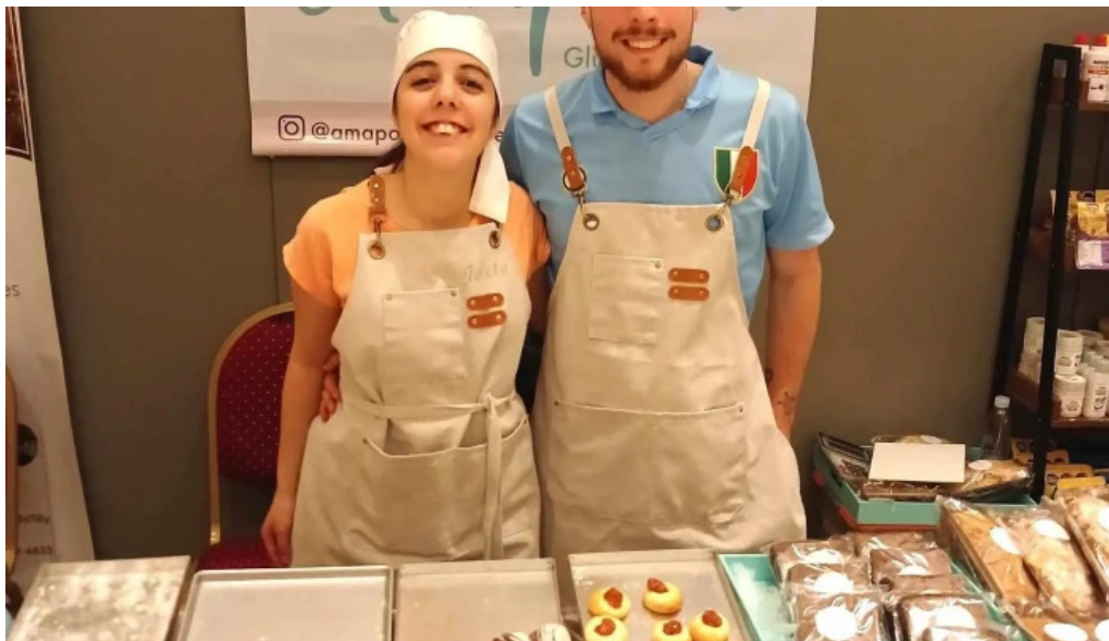
Panaderia amapola gluten free comodoro rivadavia