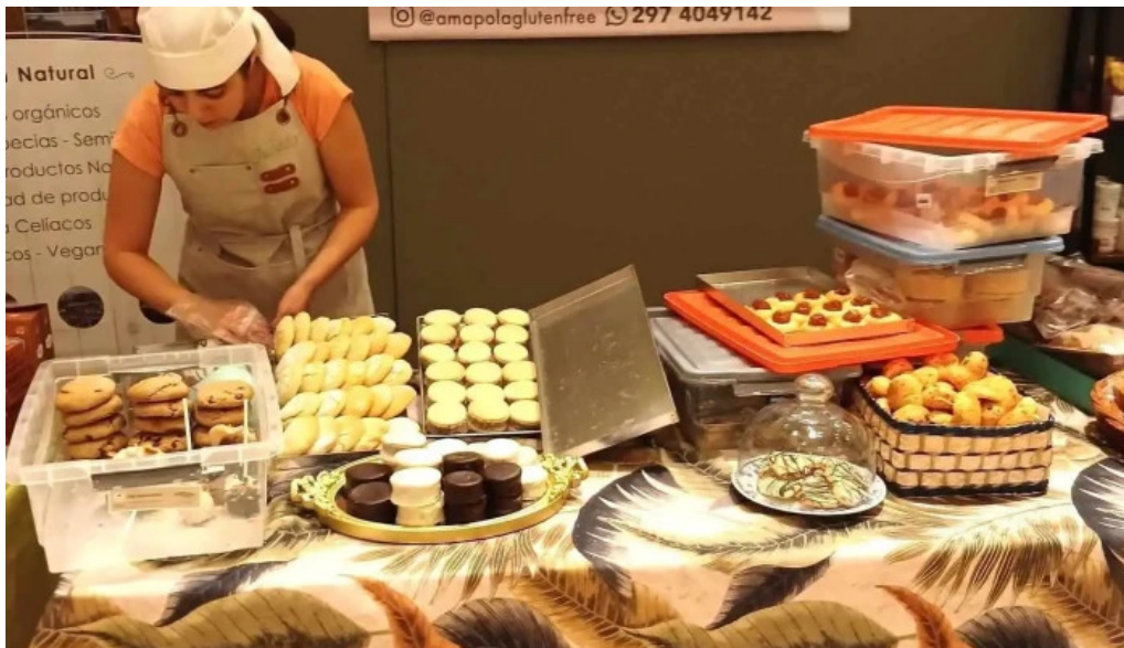
Panaderia amapola gluten free comida y bebida