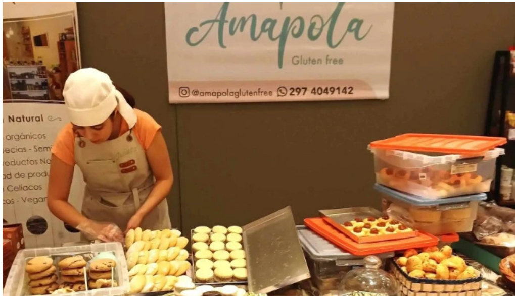
Panaderia amapola gluten free numero