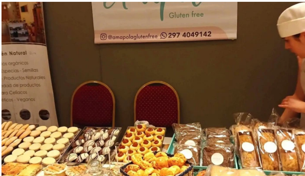
Panaderia amapola gluten free descuentos