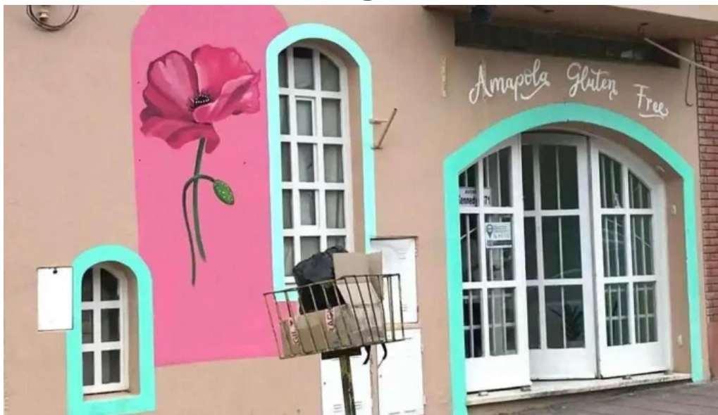
Panaderia amapola gluten free videos