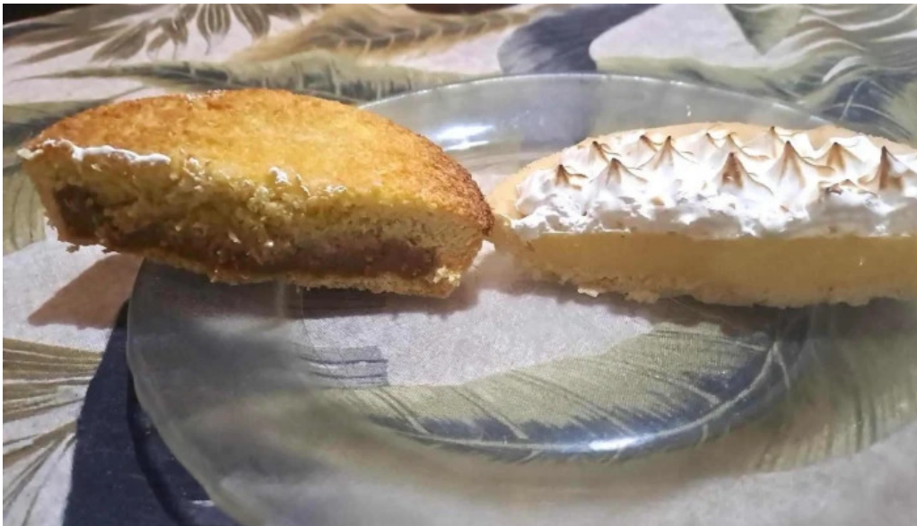
Panaderia amapola gluten free pastel