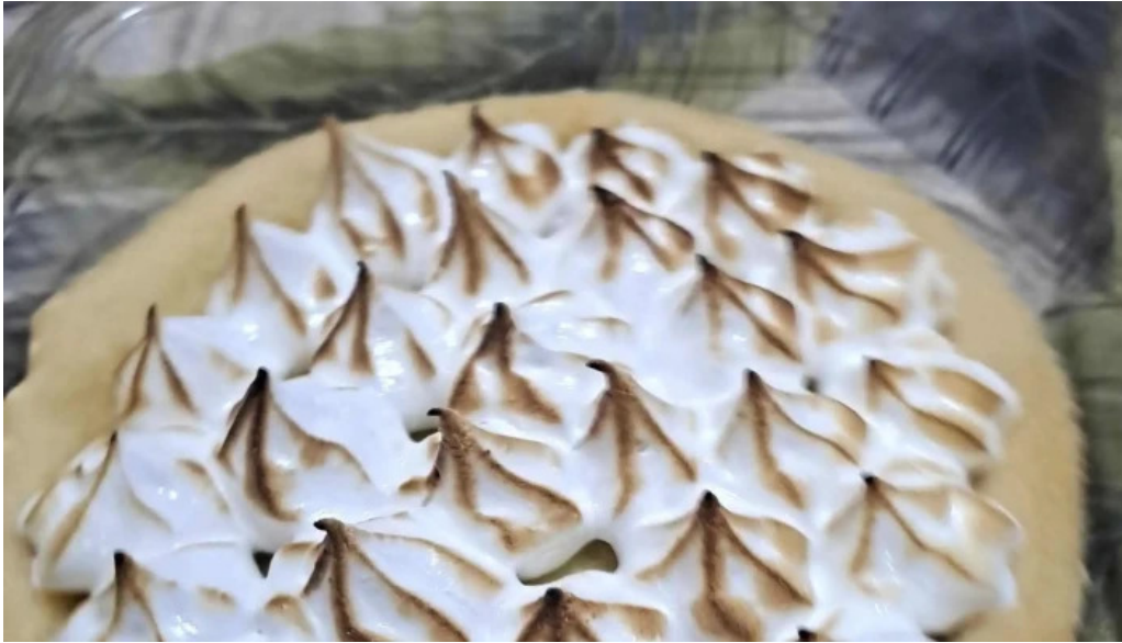
Panaderia amapola gluten free telefono