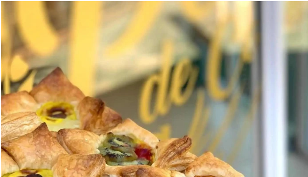
La perla costanera comida y bebida