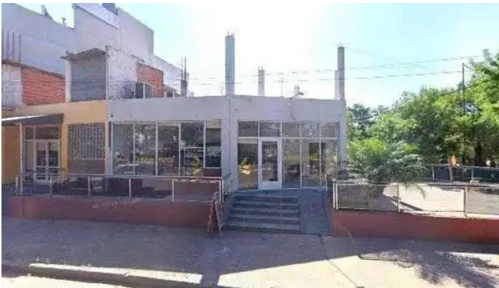
La perla costanera comentariosdeg