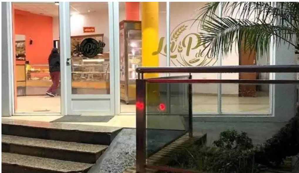
La perla costanera colon