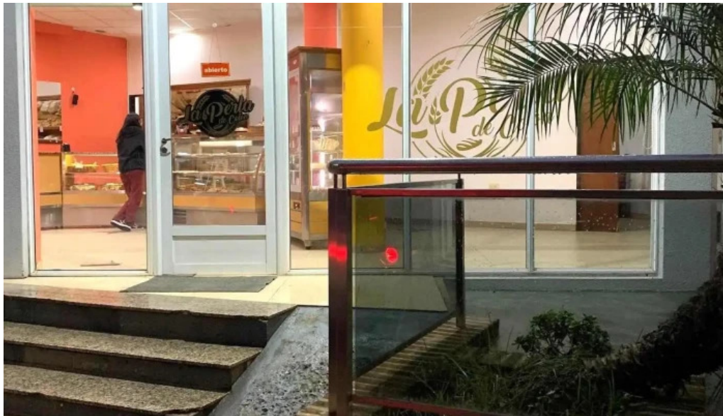
La perla costanera comentarios