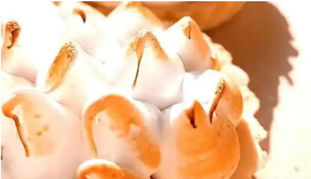
Jireh pasteleria libre de gluten del propietario