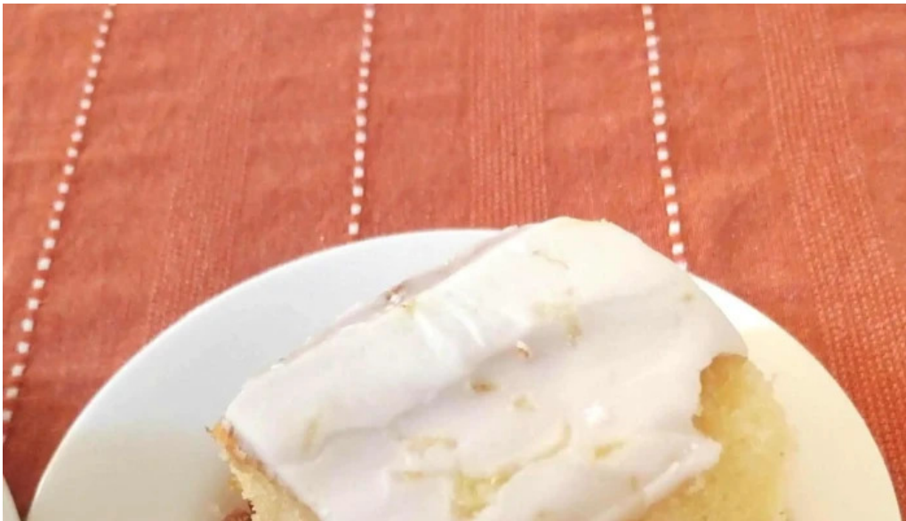
Jireh pasteleria libre de gluten como llegar