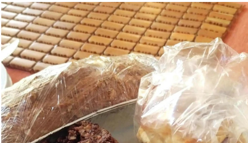
Jireh pastelería libre de gluten colon