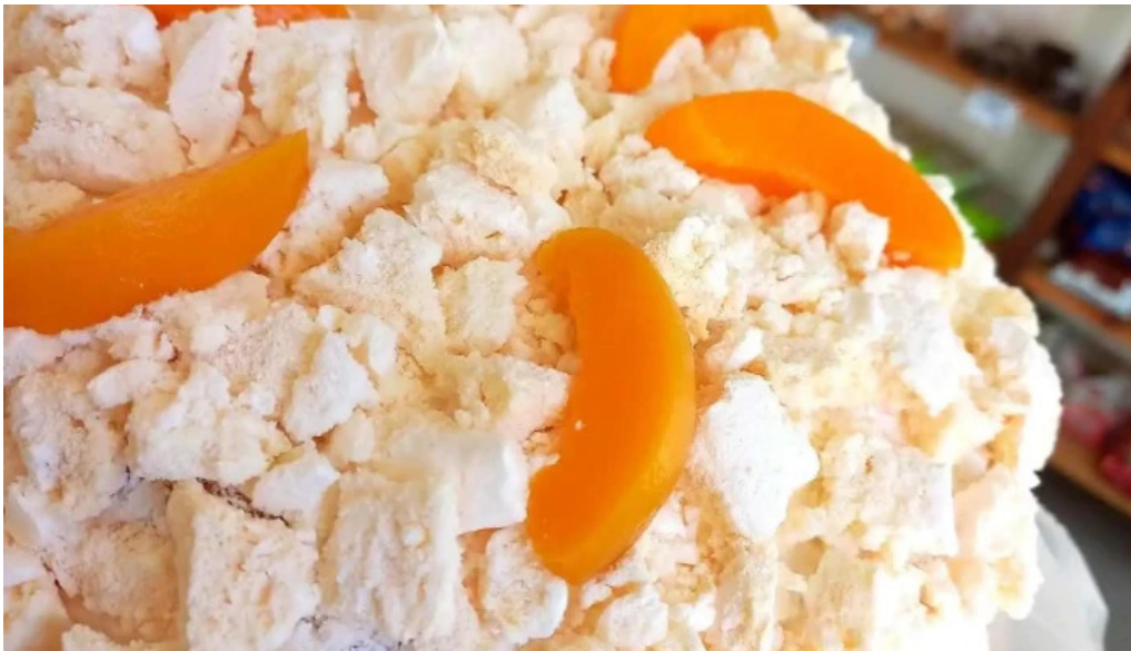
Jireh pasteleria libre de gluten pastel