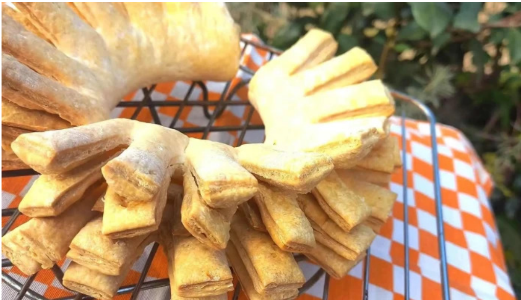
Jireh pasteleria libre de gluten comida y bebida