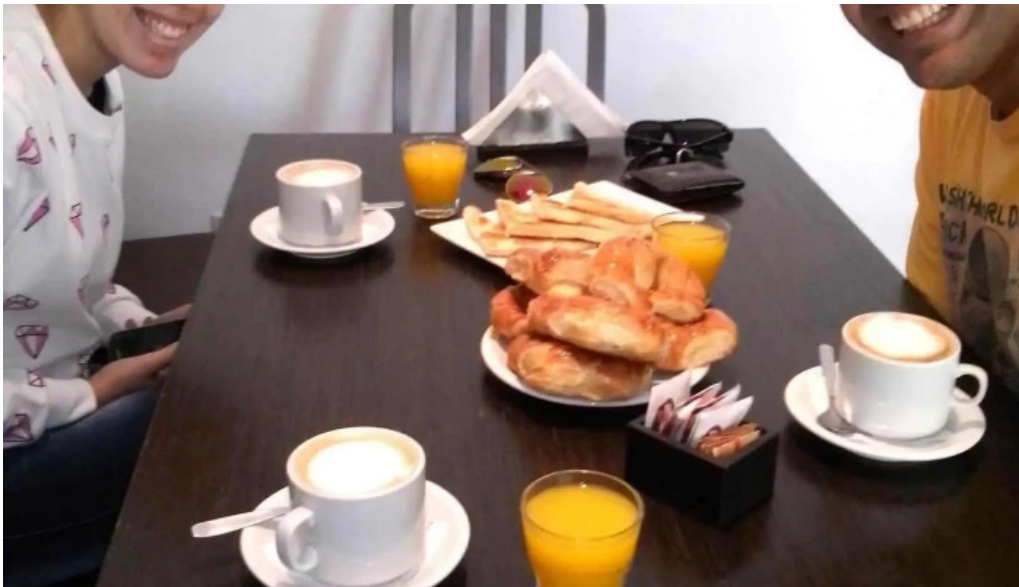
Alem comida y bebida