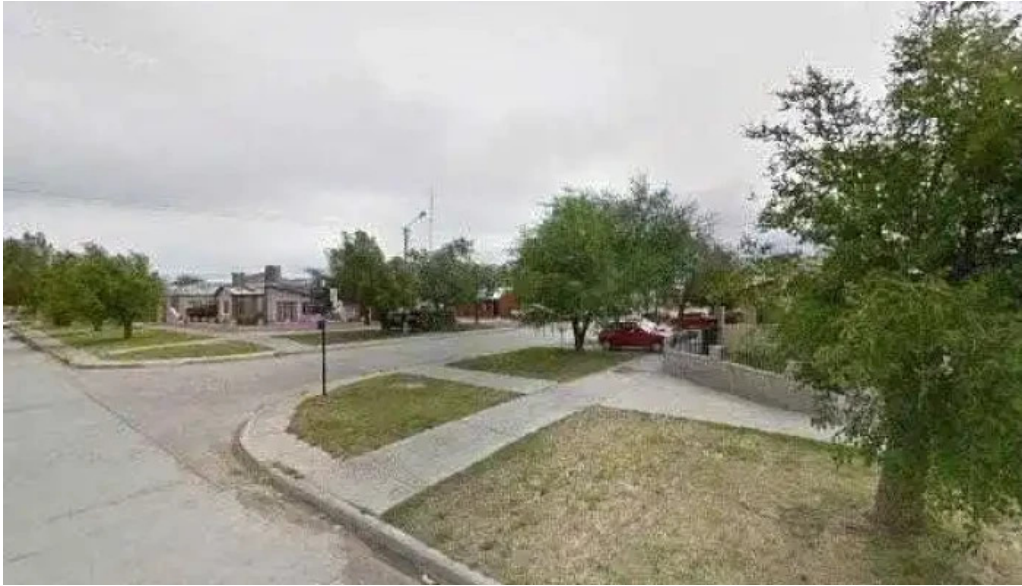
Tio lucas fotosdeg