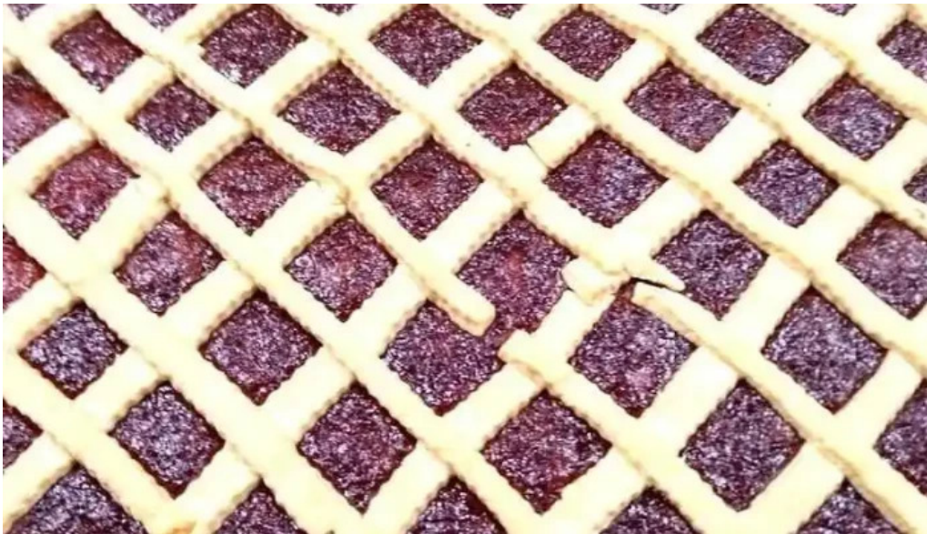
Tío lucas cmte luis piedrabuena