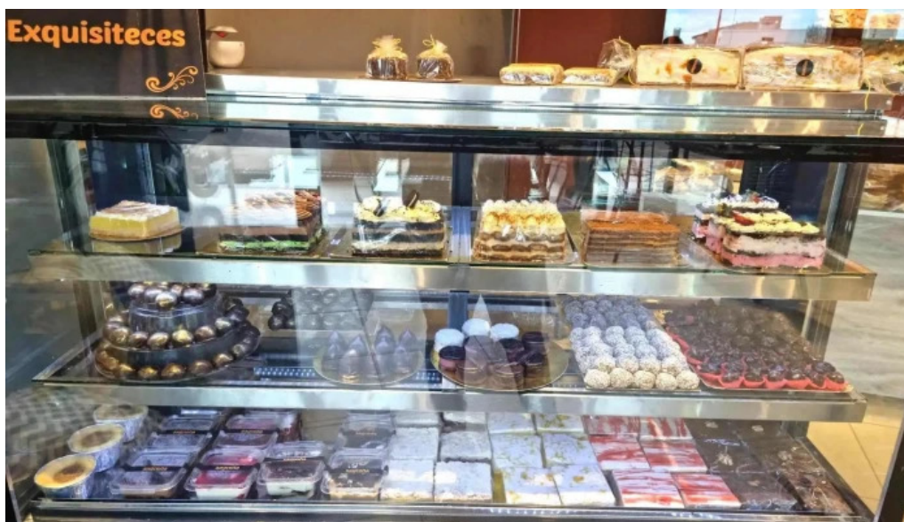
Sagrena panes y pastas caseras ambiente