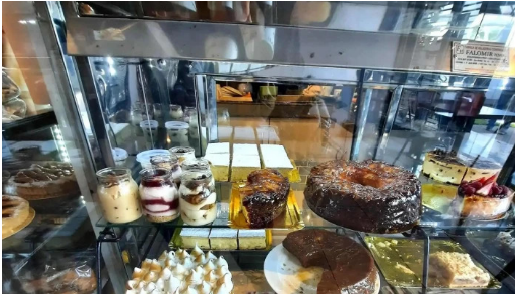
Sagrena panes y pastas caseras horario