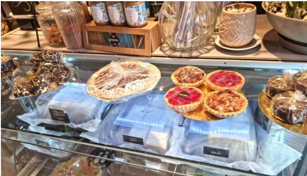
Sagrena panes y pastas caseras comida y bebida