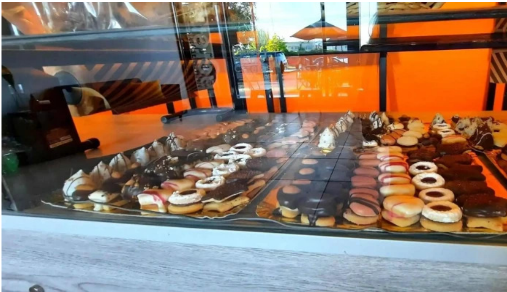
Sagrena panes y pastas caseras cipolletti