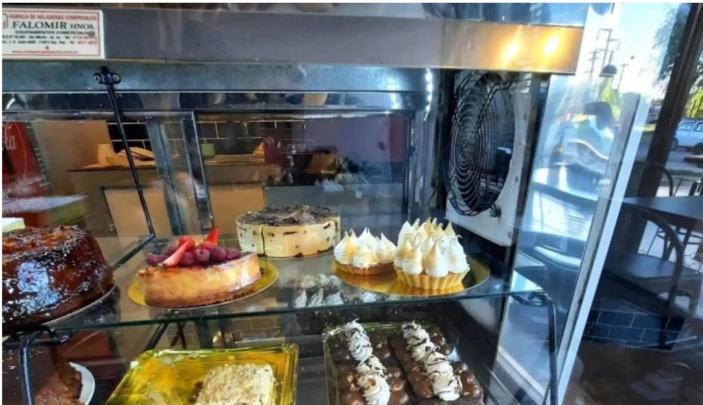
Sagrena panes y pastas caseras cerca de mi