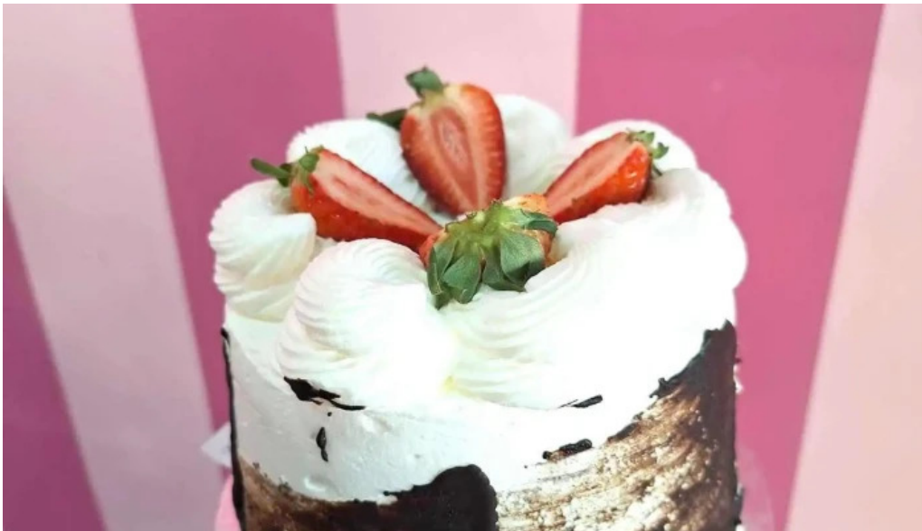
Rujtika panaderia y pasteleria del propietario