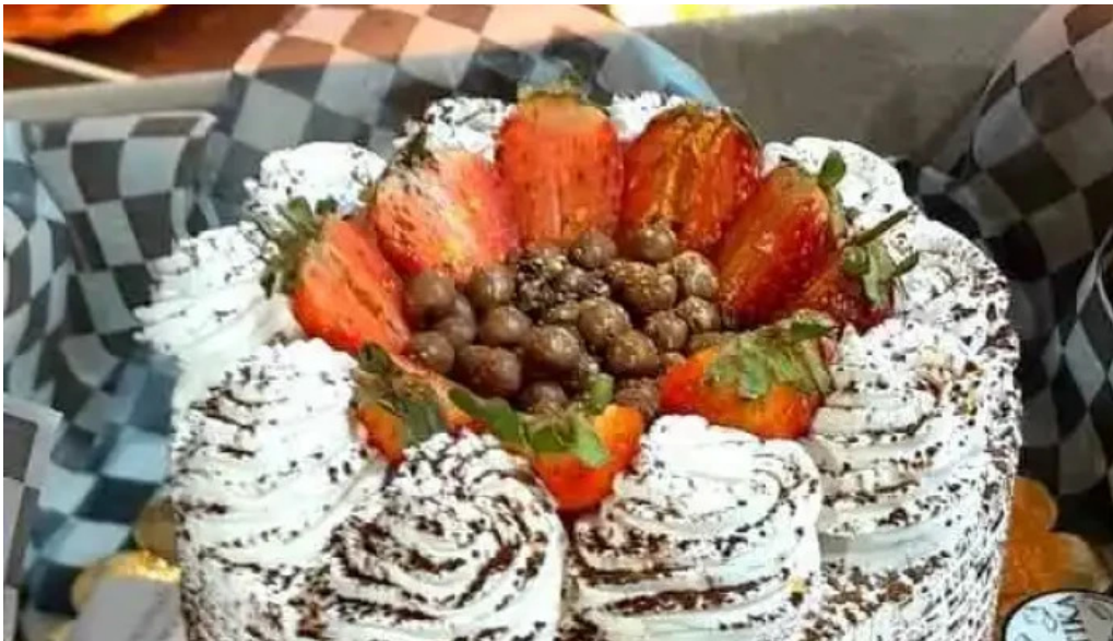
Rujtika panaderia y pasteleria donde