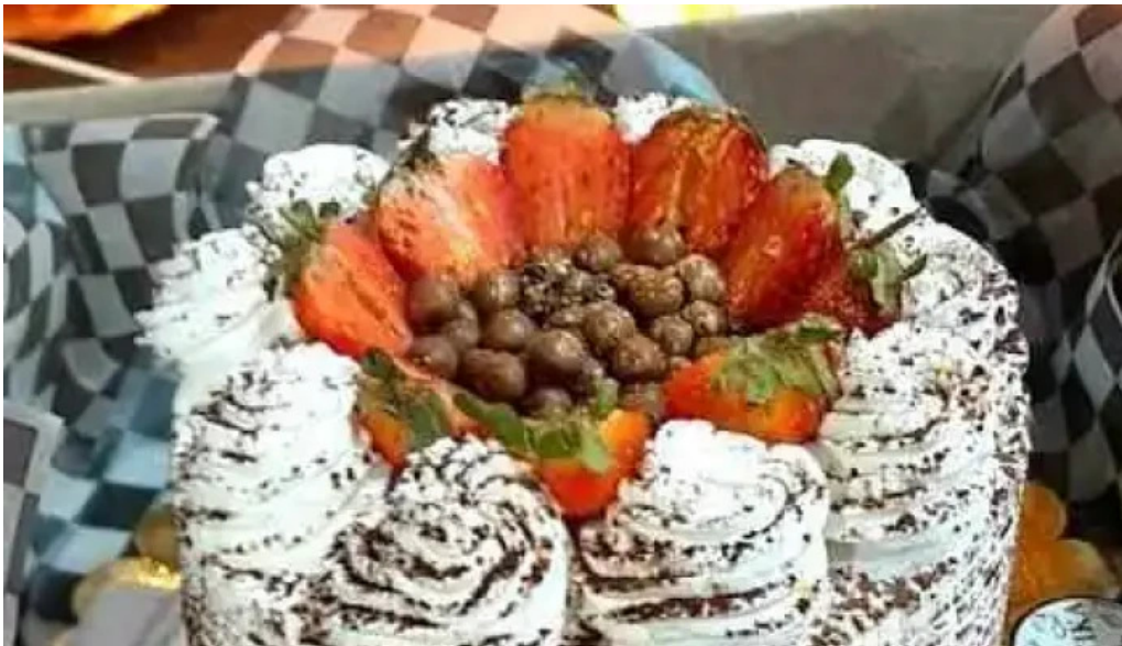
Rujtika panaderia y pasteleria cipolletti