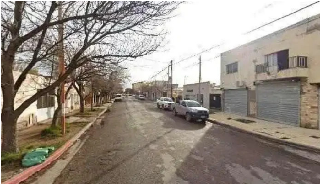
Rujtika panaderia y pasteleria dondedeg