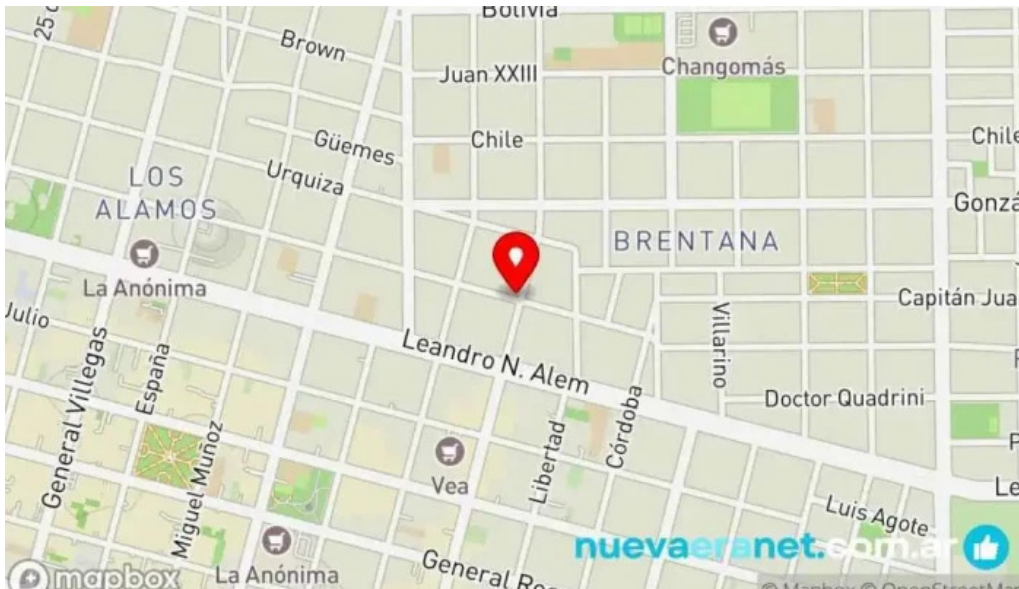
Rujtika panaderia y pasteleria mapa