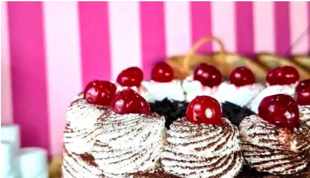
Rujtika panaderia y pasteleria comida y bebida