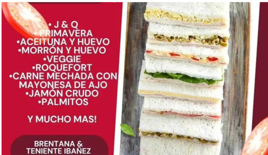
Rujtika panaderia y pasteleria carta