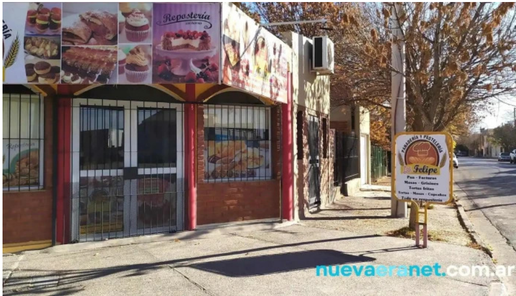
Panaderia los felipes puntaje