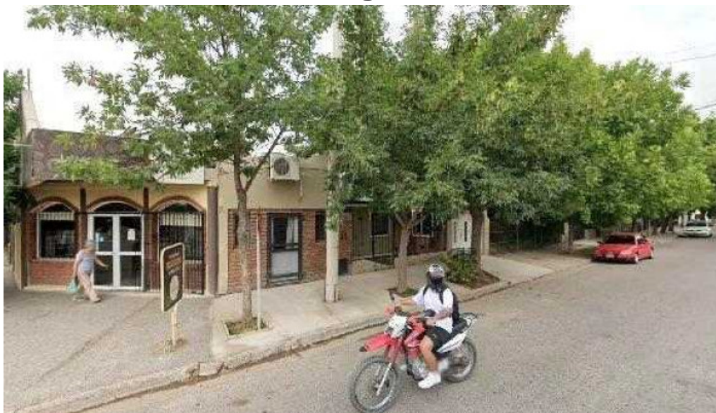
Panaderia los felipes puntajedeg