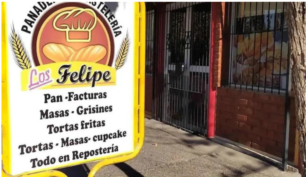
Panaderia los felipes carta