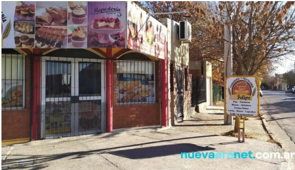
Panaderia los felipes cipolletti