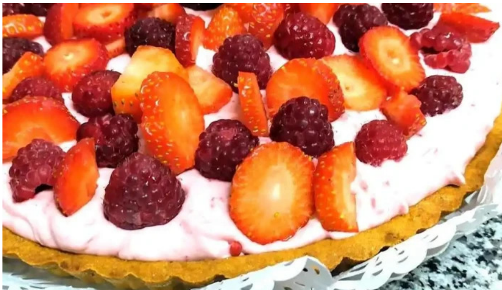
Panaderia los felipes comida y bebida