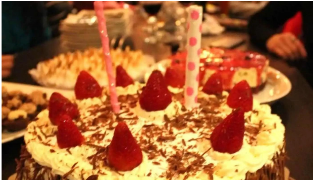
Panaderia los felipes pastel