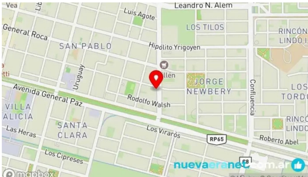
Panaderia los felipes mapa