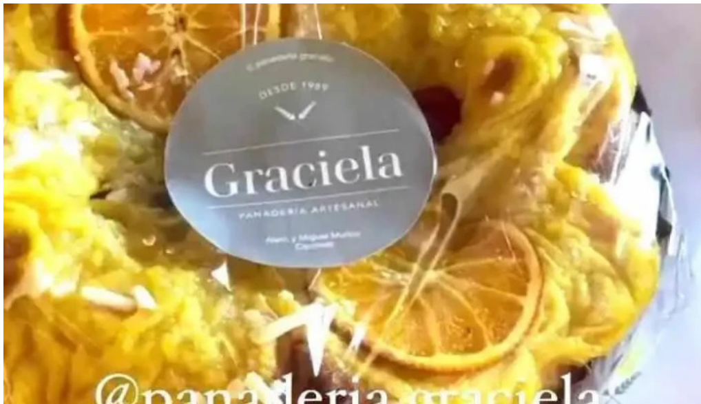
Panaderia graciela videos