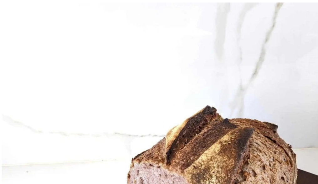
Panadería Graciela cipolletti