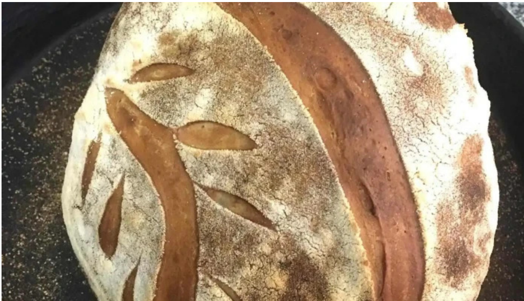
Panaderia graciela del propietario