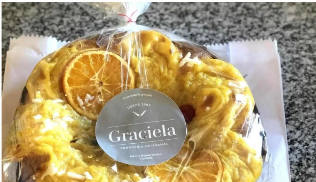
Panaderia graciela numero