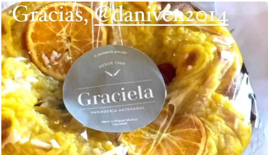
Panaderia graciela precios