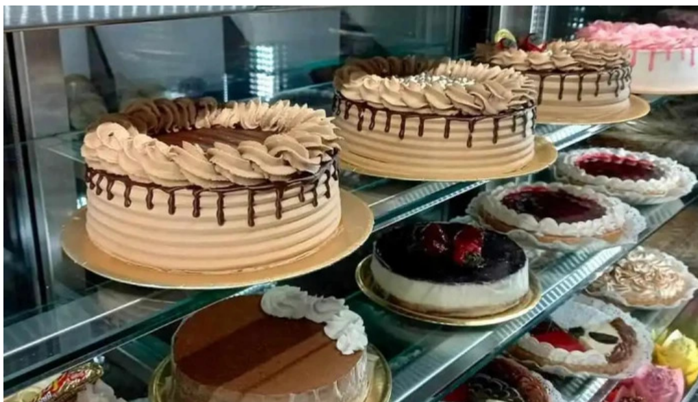
La artesana comida y bebida