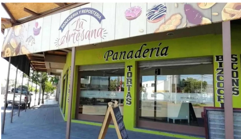
La artesana cipolletti