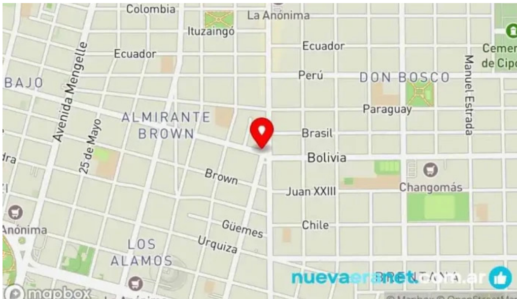
La artesana mapa