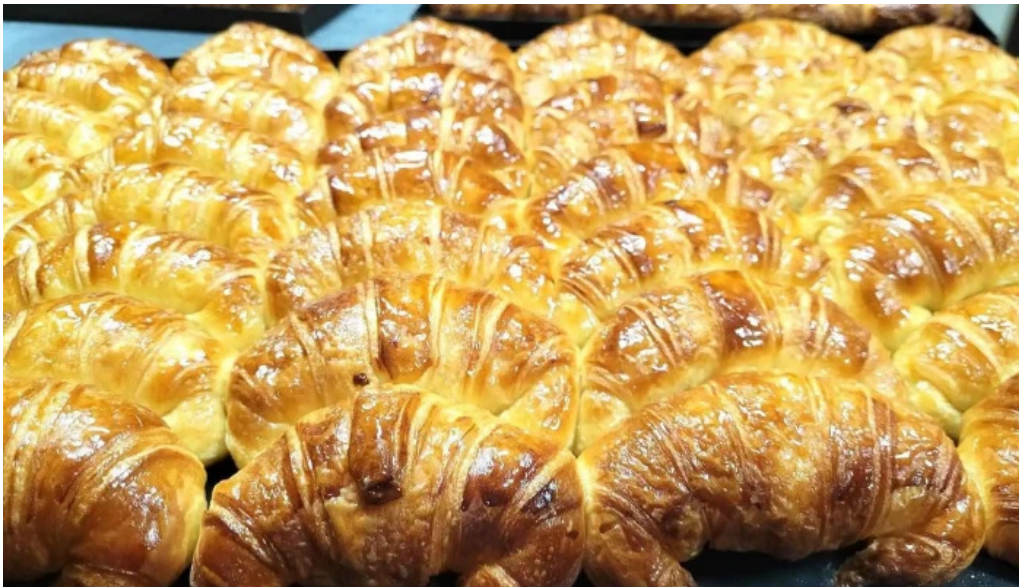
La artesana del propietario