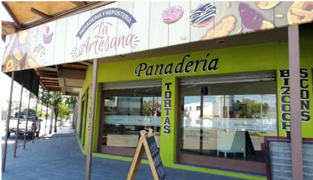
La artesana numero