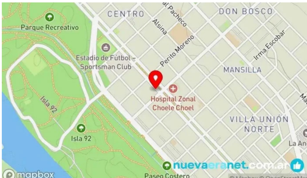
Flor de amancay mapa