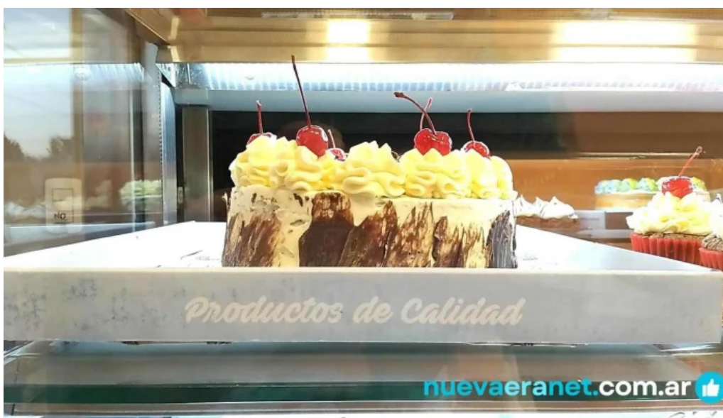
La malligastena comida y bebida