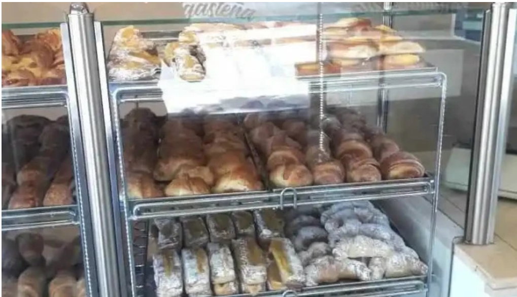
La malligastena vitrina