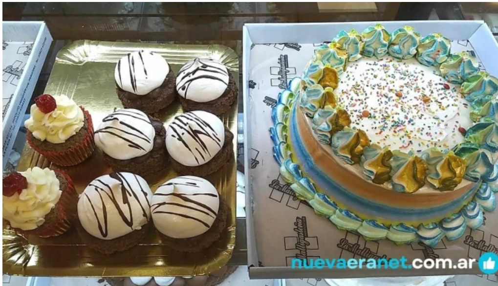
La malligastena pastel