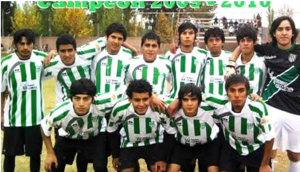
La malligastena sitio web