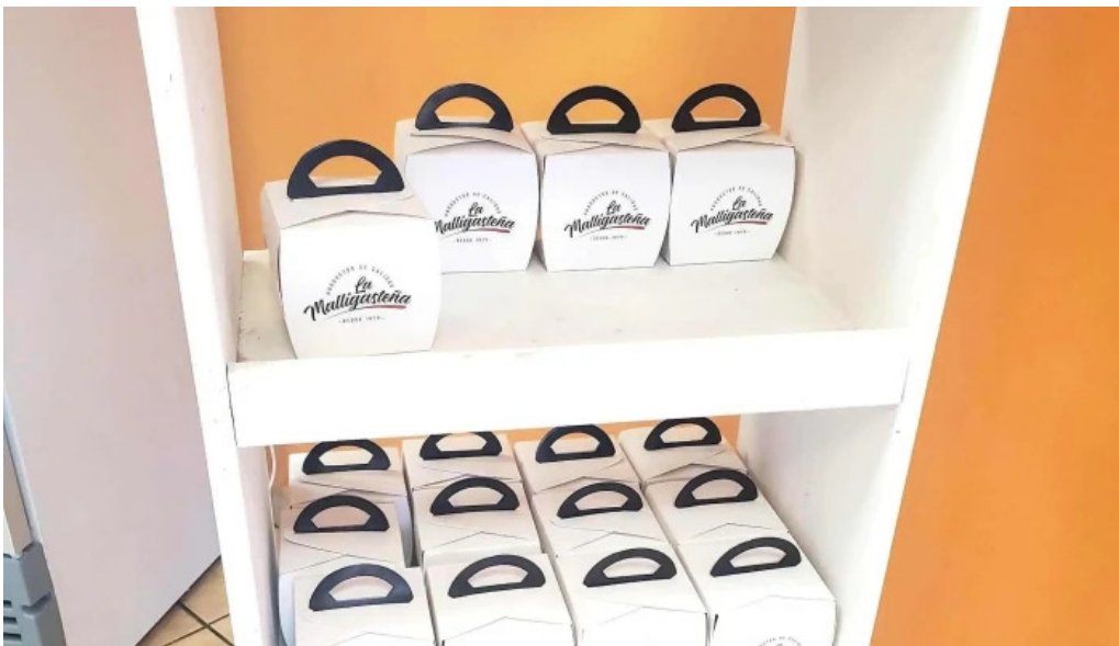
La malligastena videos