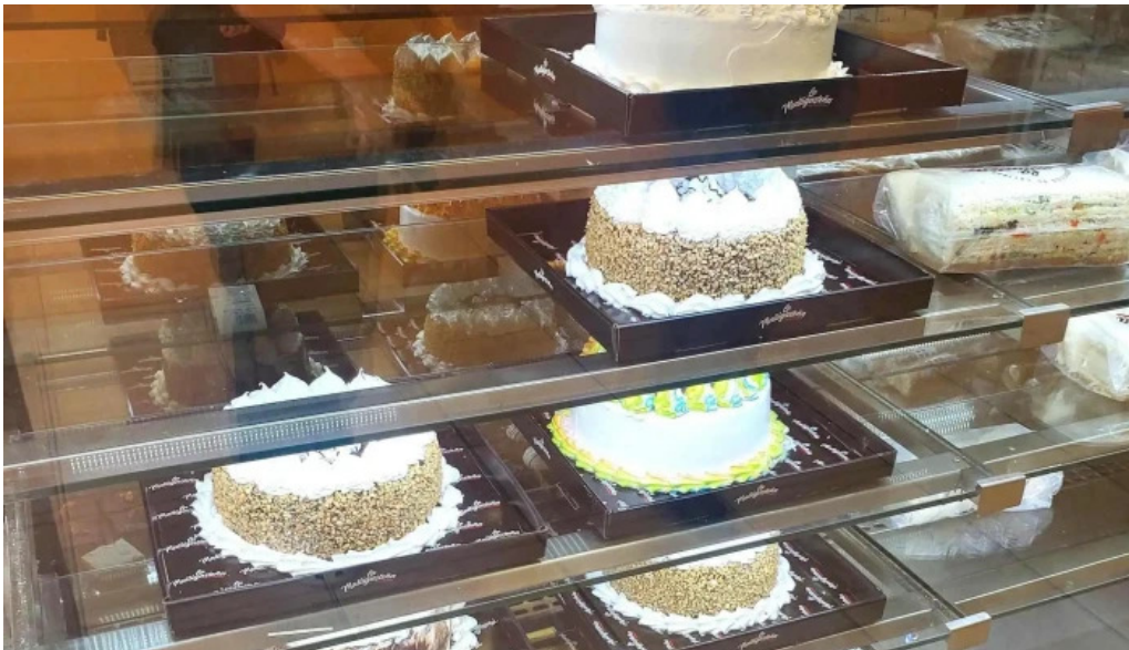
La malligastena cerca de mi