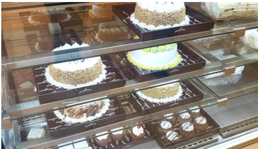
La malligastena ambiente