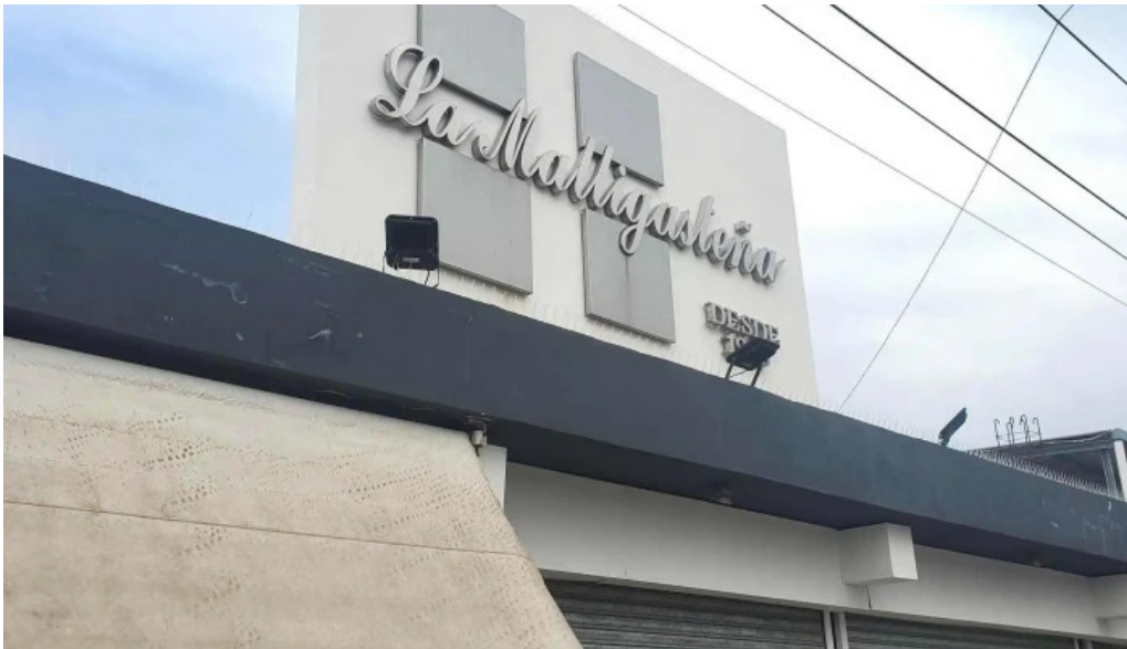
La malligastena chilecito