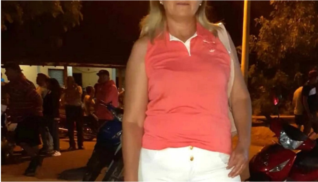
La malligastena telefono