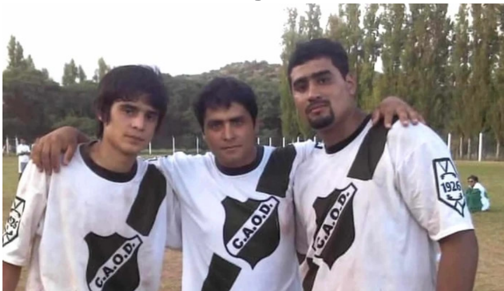
La malligastena zona