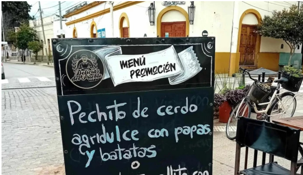
Delicias del pueblo donde