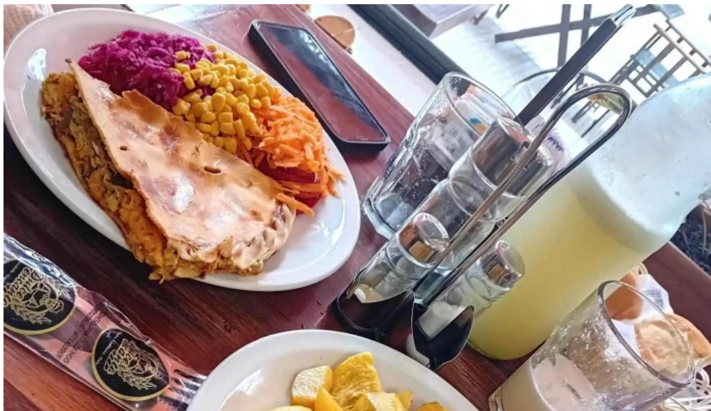
Delicias del pueblo chicoana