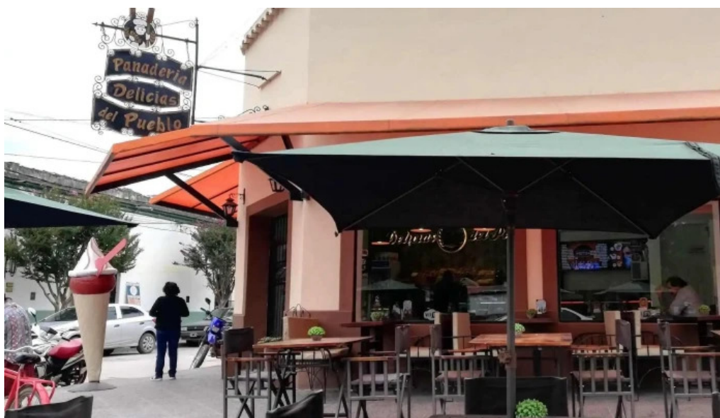
Delicias del pueblo ambiente