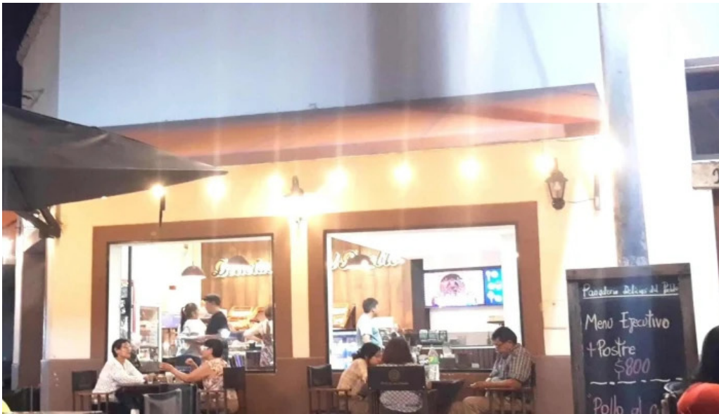
Delicias del pueblo puntaje