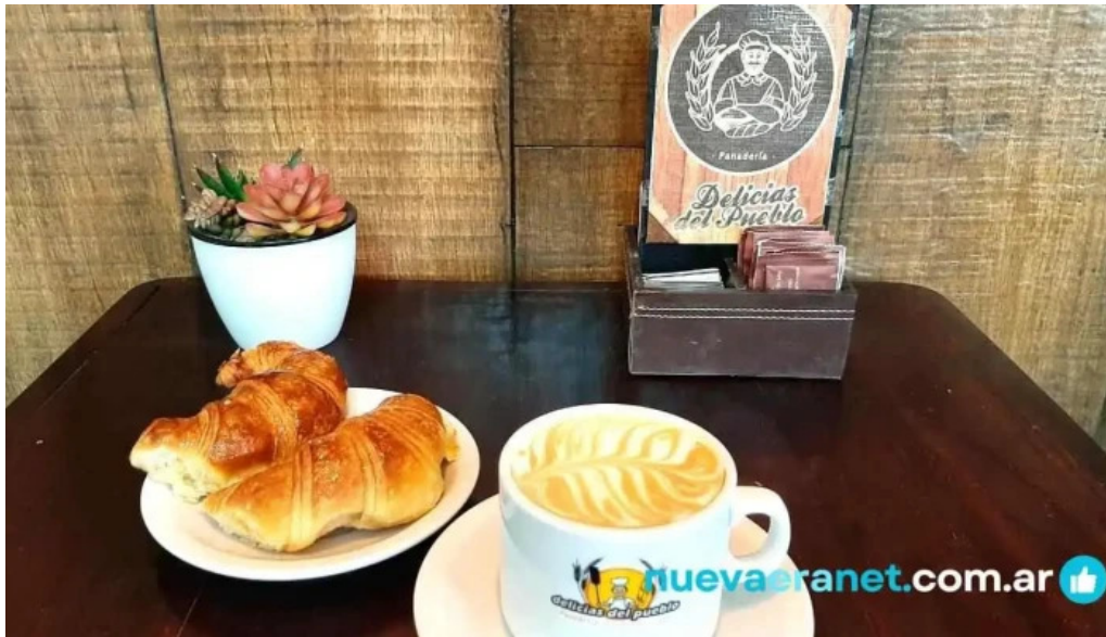
Delicias del pueblo comida y bebida