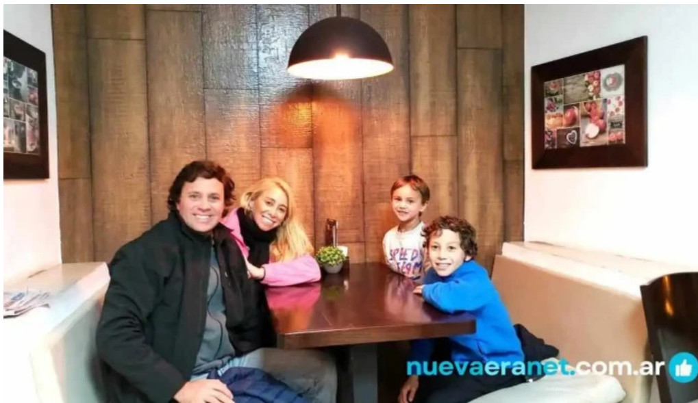
Delicias del pueblo del propietario