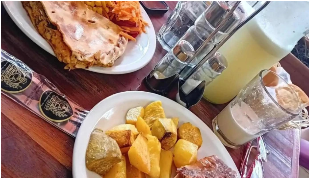
Delicias del pueblo mas recientes