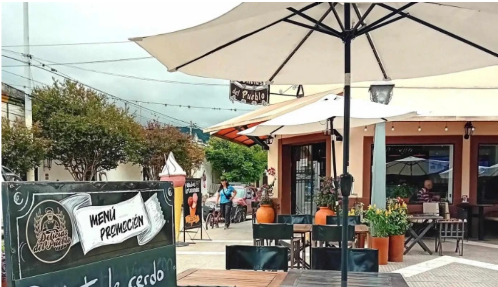
Delicias del pueblo numero