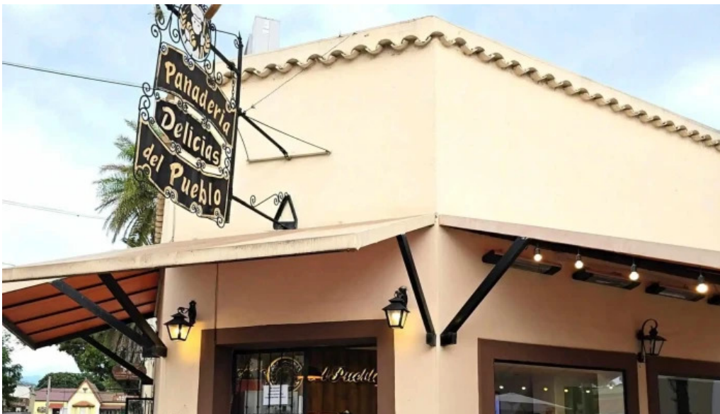
Delicias del pueblo videos