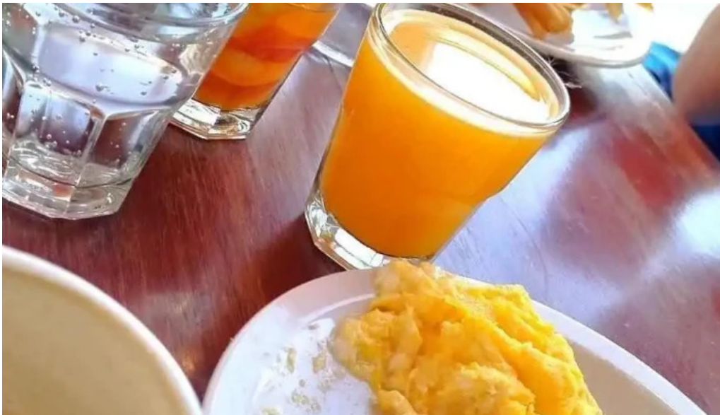
Delicias del pueblo jugo