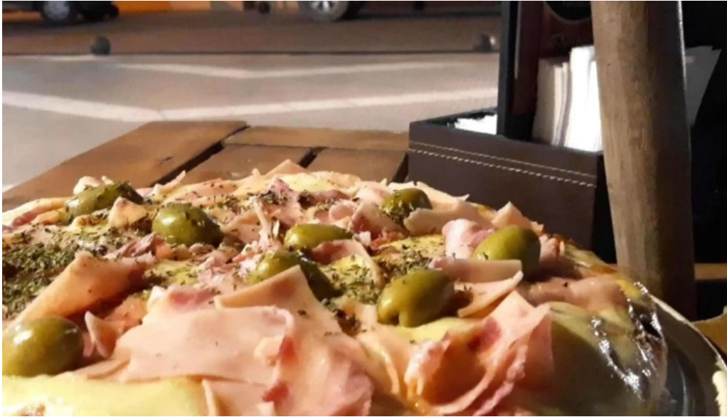
Delicias del pueblo ubicacion