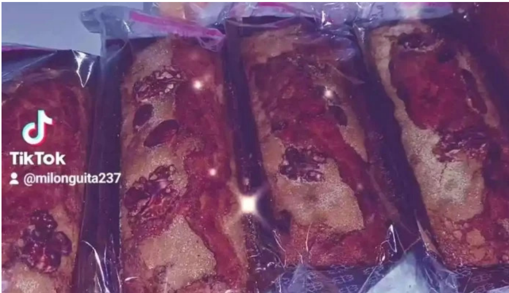
Panaderia milonguita comida y bebida