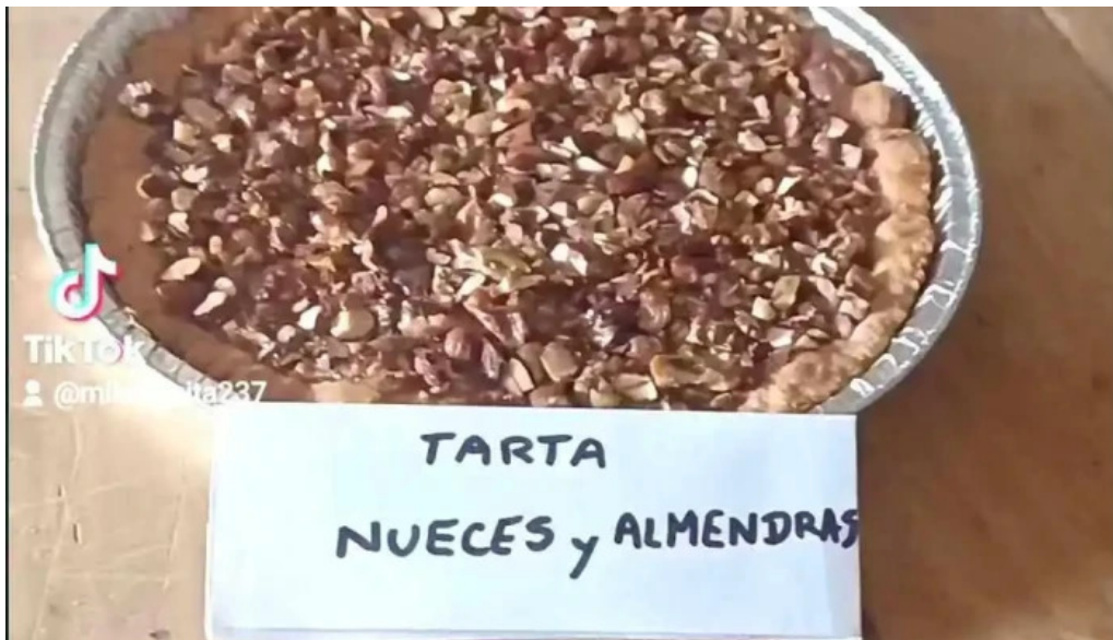
Panaderia milonguita del propietario