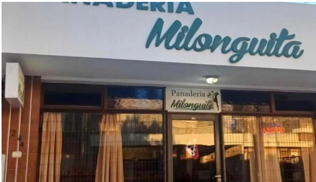
Panaderia milonguita horario