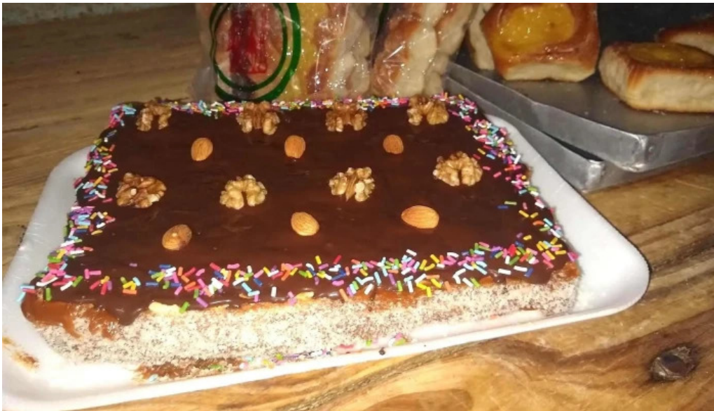
Panaderia milonguita pastel