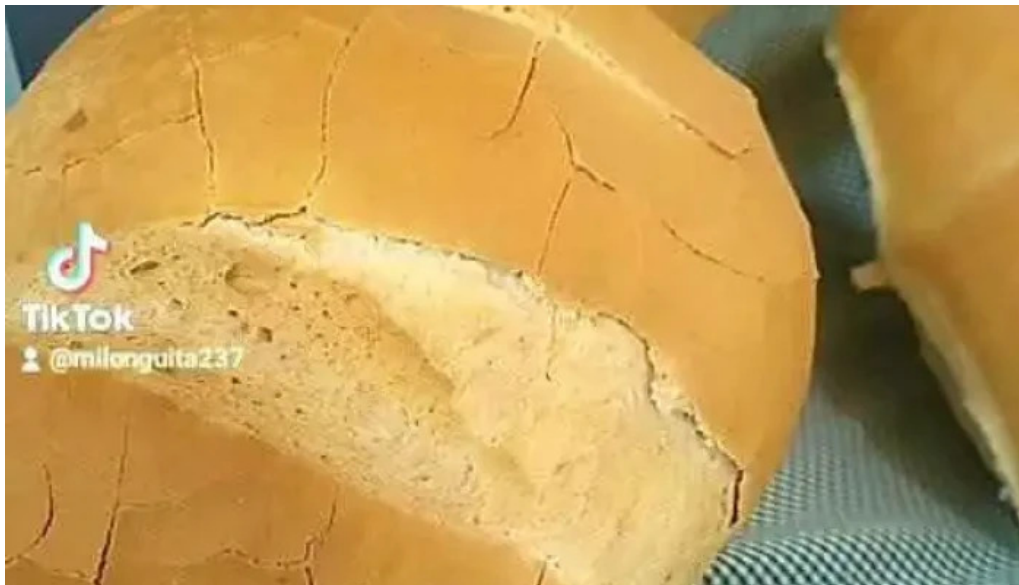
Panaderia milonguita videos