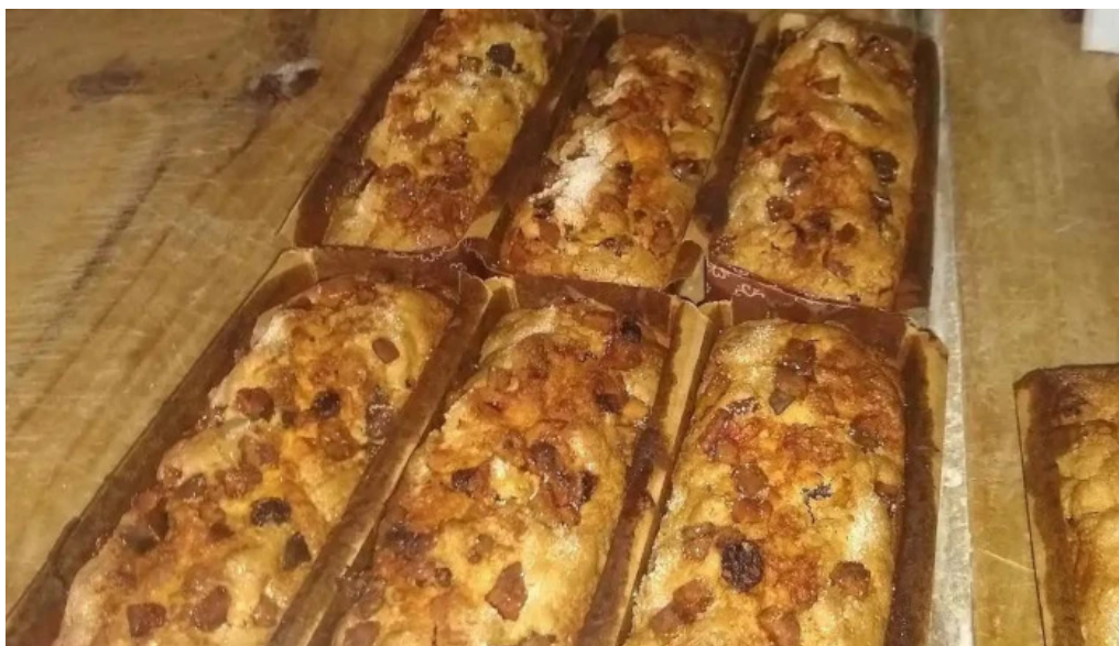
Panaderia milonguita baguette