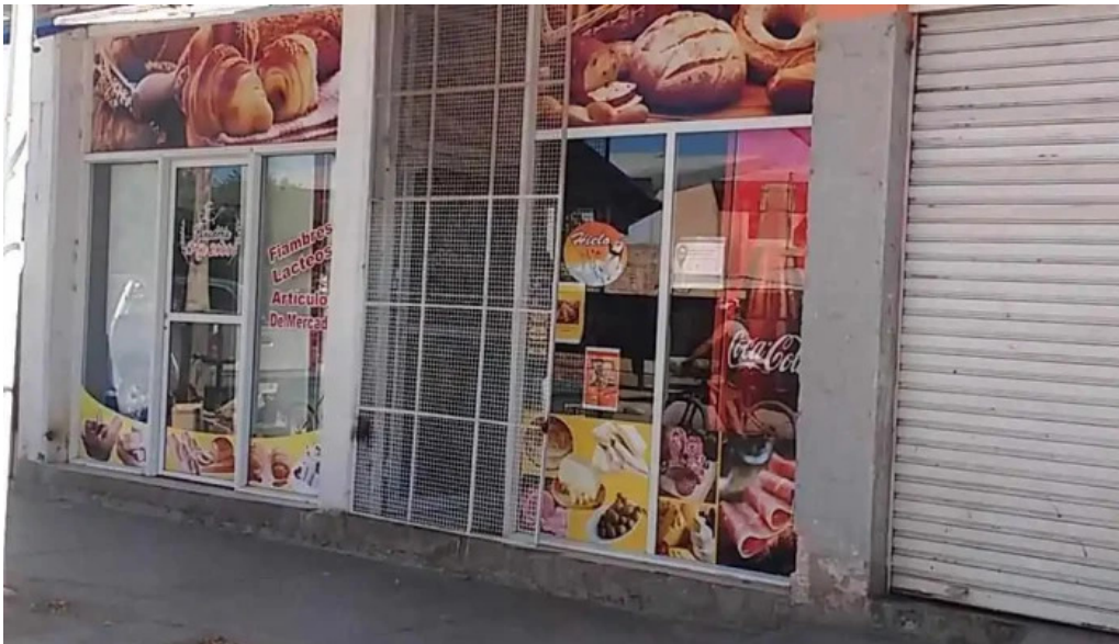
Panaderia ano 2000 como llegar