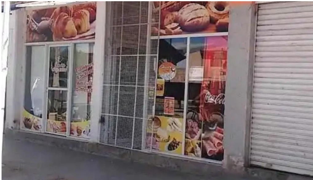
Panaderia ano 2000 centenario