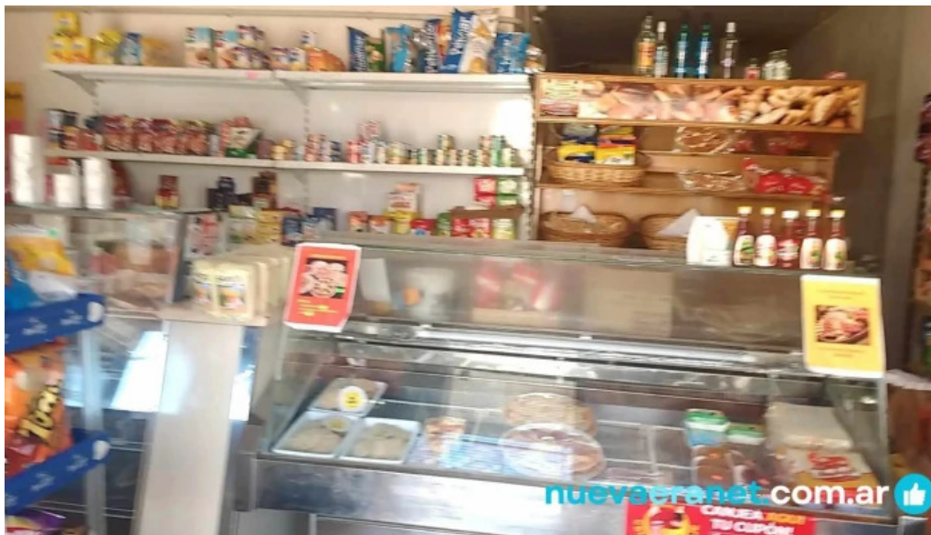
Panaderia ano 2000 ambiente