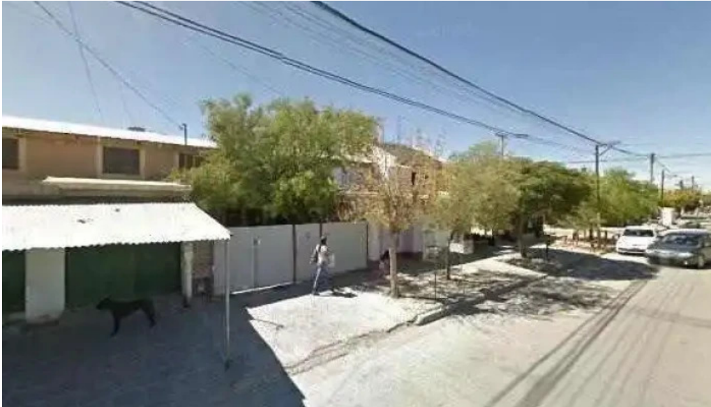
Panaderia ano 2000 como llegardeg