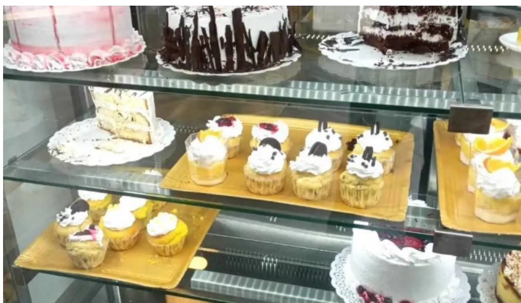
La panna ambiente