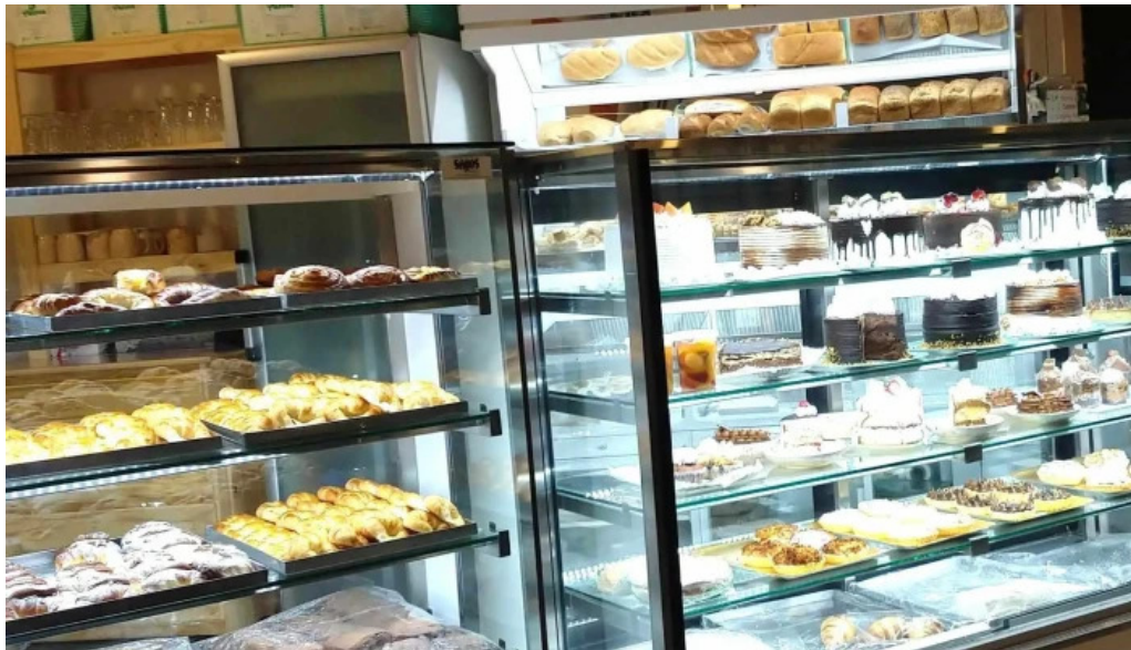
La panna puntaje