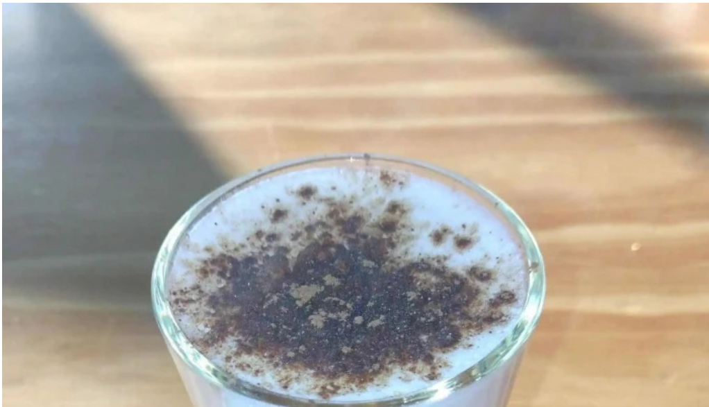
La panna sitio web