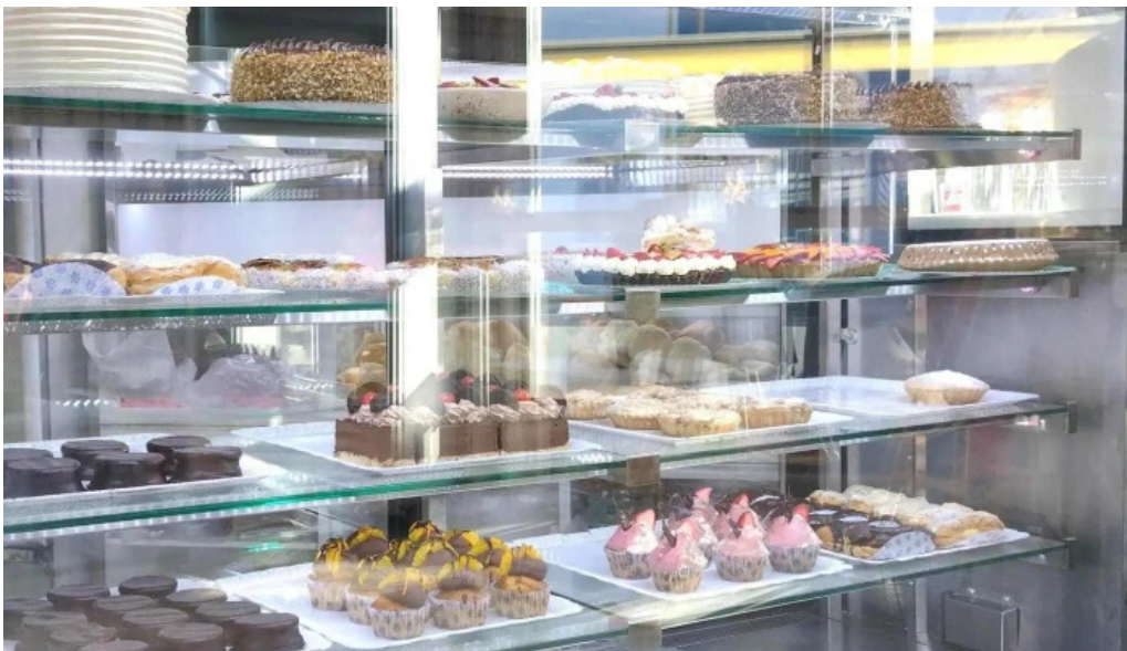
La panna direccion