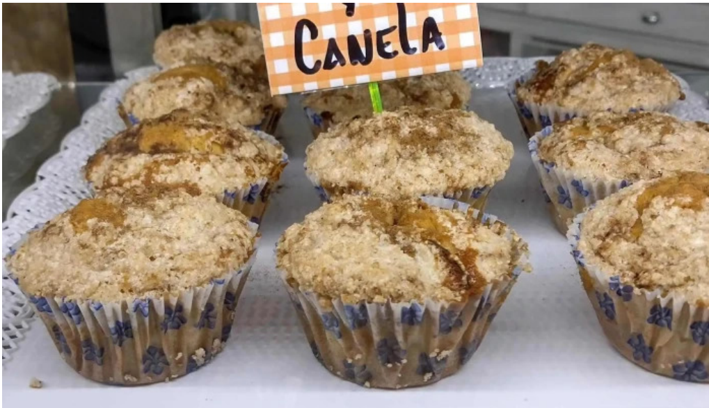
La panna comida y bebida