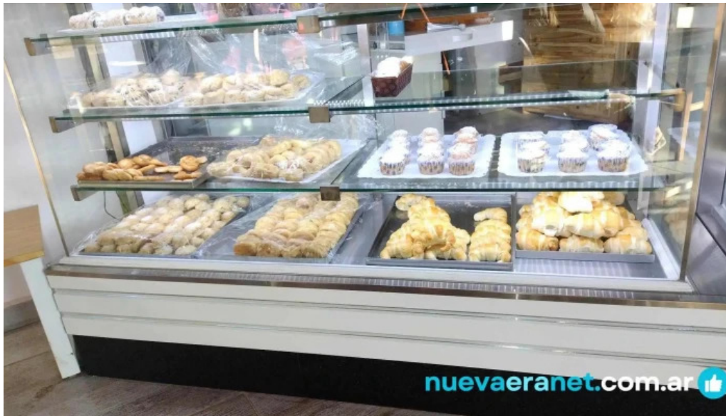
La panna vetrina