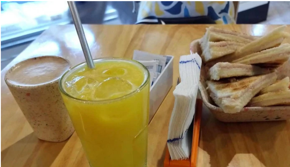
La panna centenario