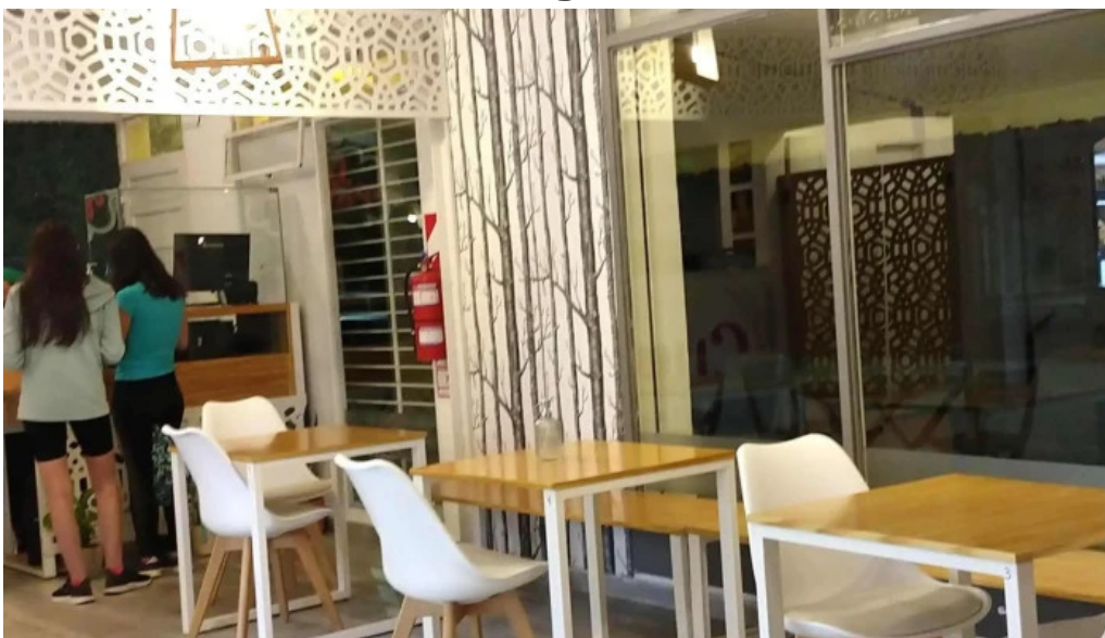
La panna zona