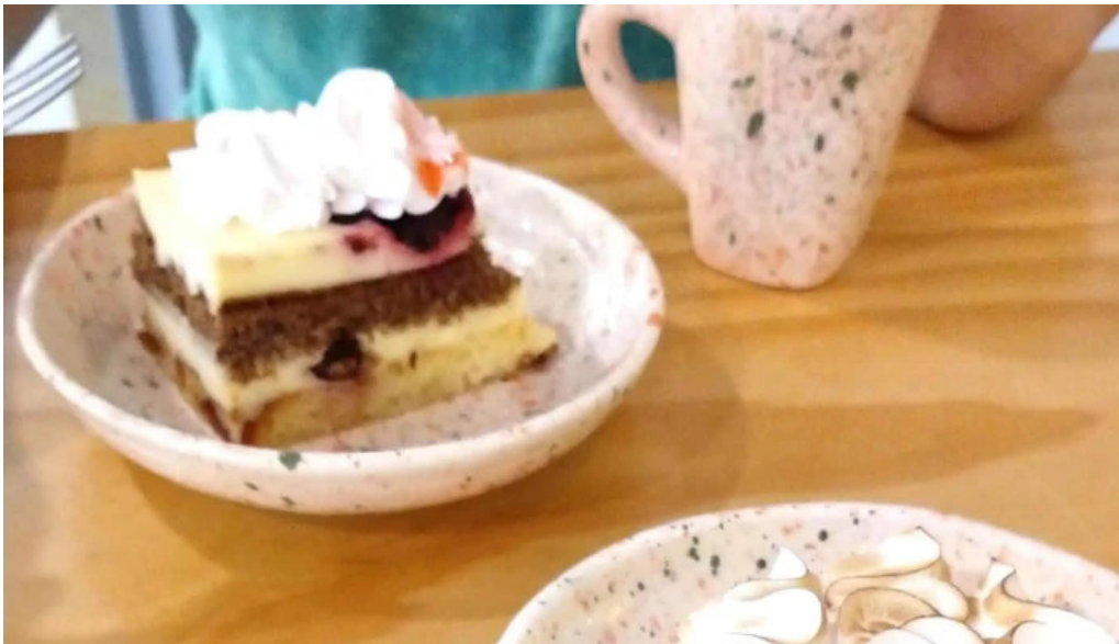
La panna fotos