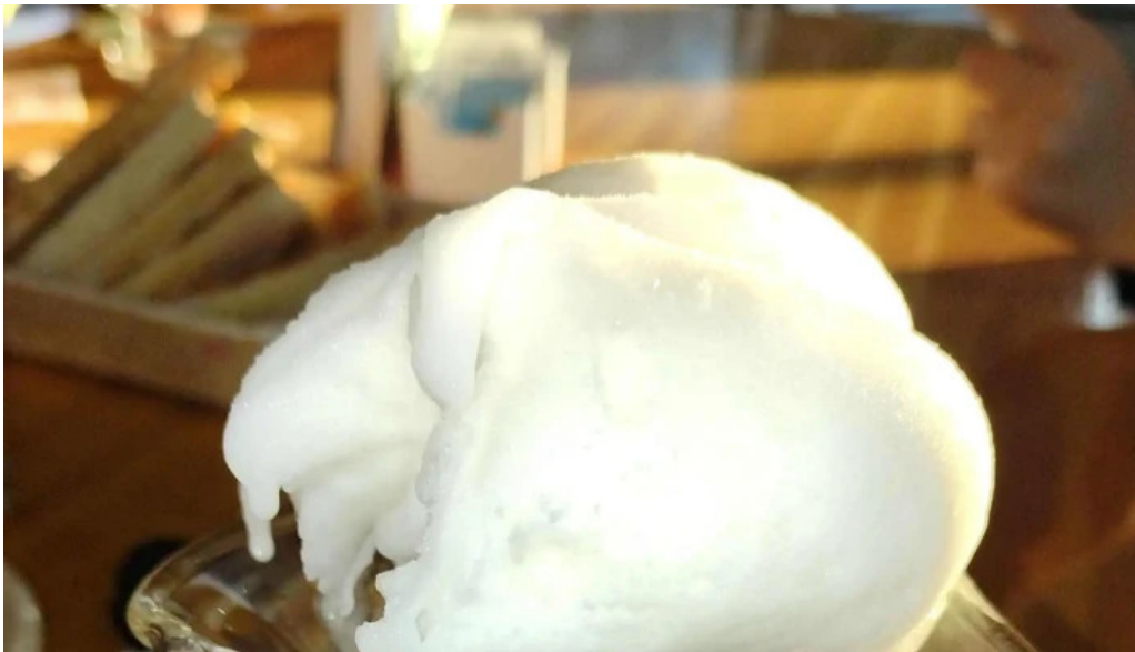
La panna telefono