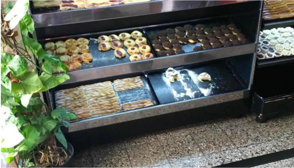
Las medialunas del abuelo vitrina