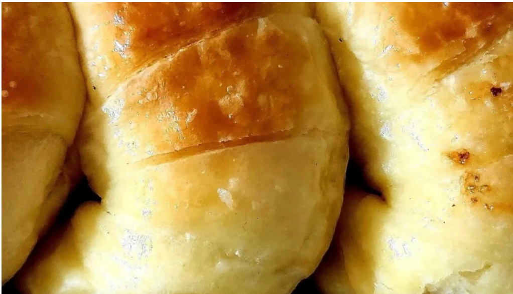
Las medialunas del abuelo cdad autonoma de buenos aires