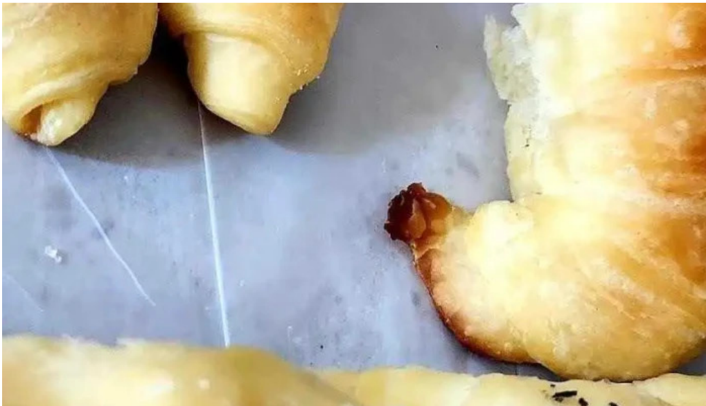
Las medialunas del abuelo comida y bebida