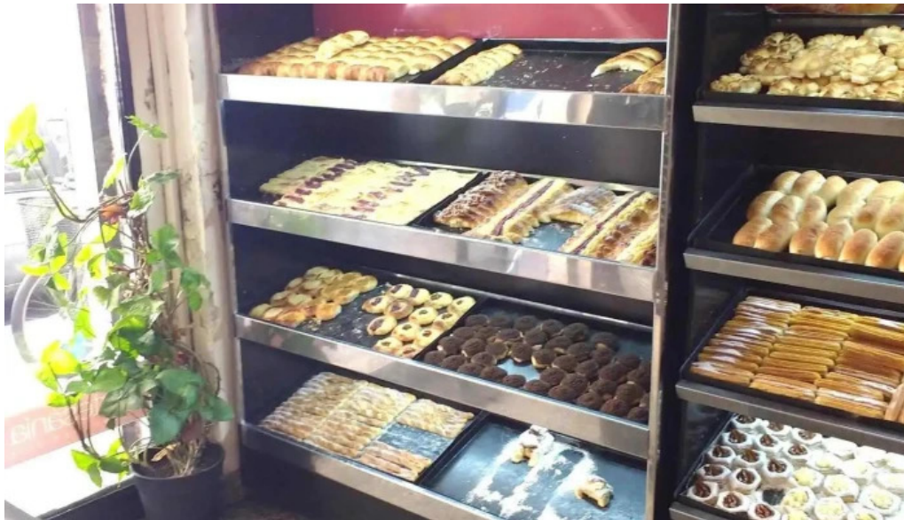
Las medialunas del abuelo ambiente