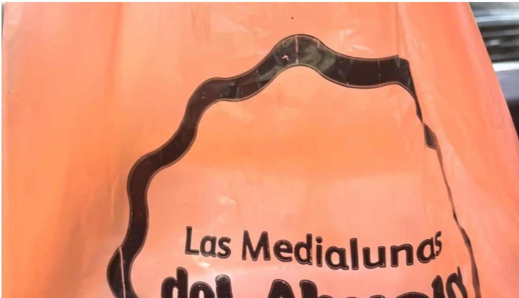
Las medialunas del abuelo videos