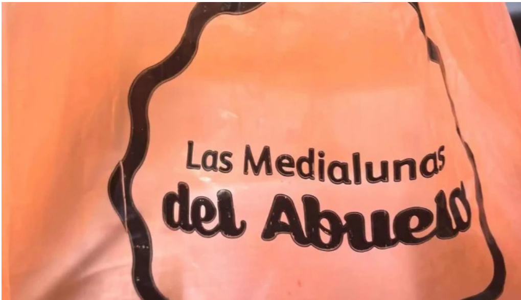
Las medialunas del abuelo mas recientes