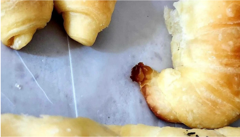
Las medialunas del abuelo cerca de mi