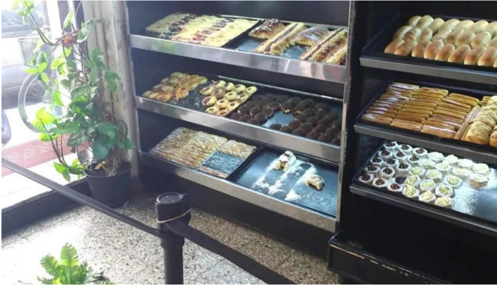
Las medialunas del abuelo pastel