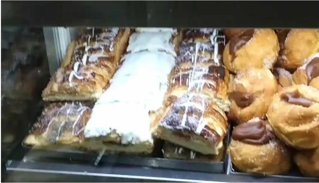
La primavera videos