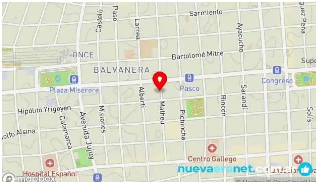
La primavera mapa