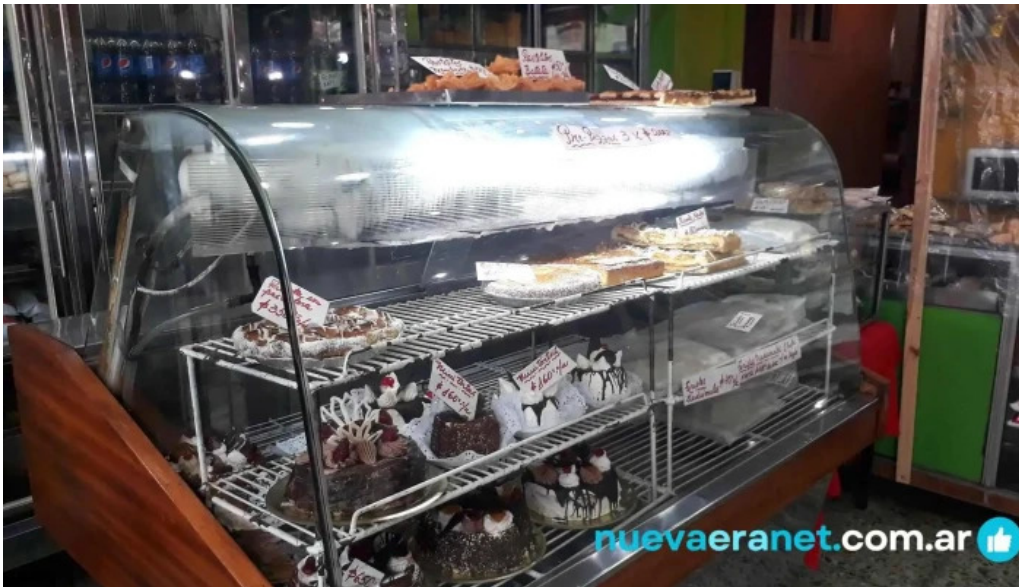
La primavera vitrina