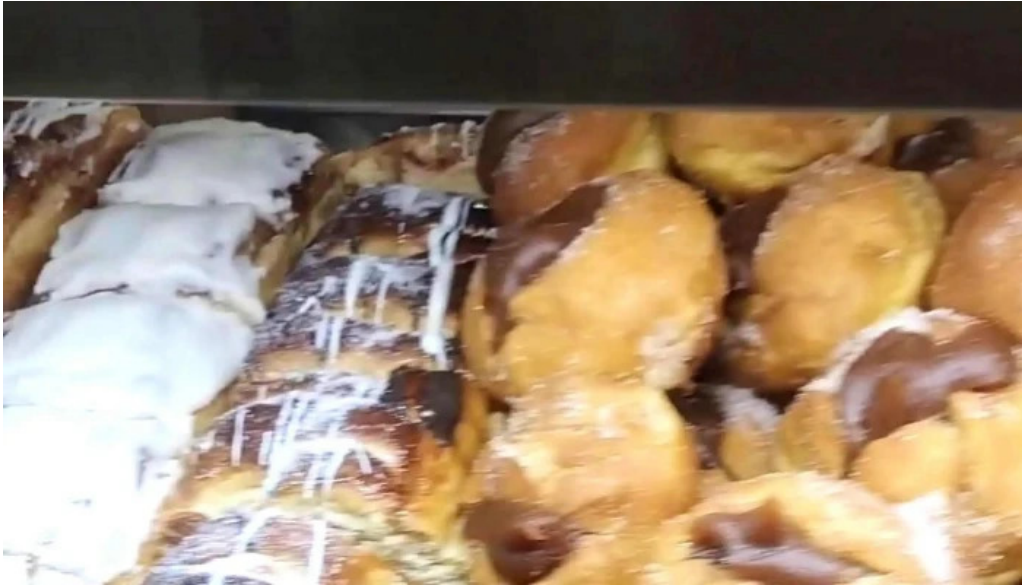
La primavera cdad autonoma de buenos aires