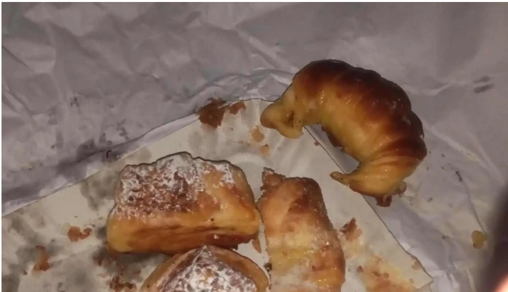
La primavera donde