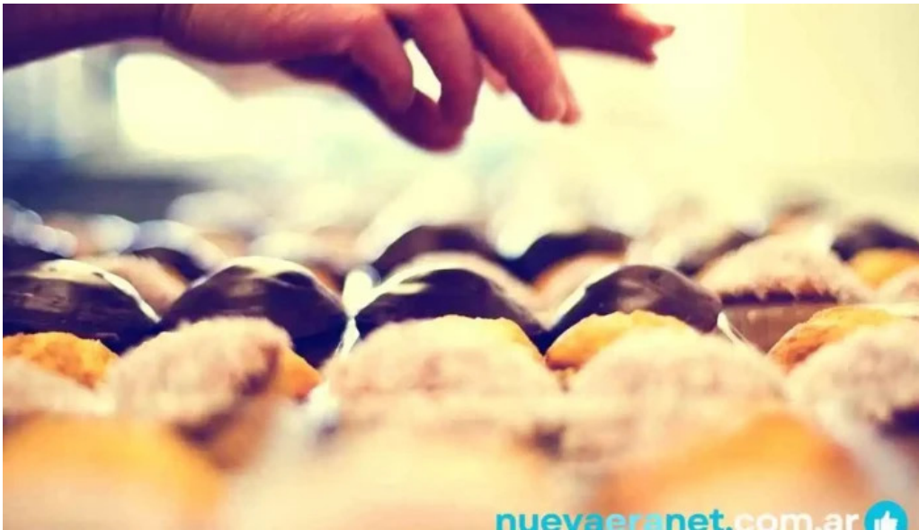
La primavera comida y bebida