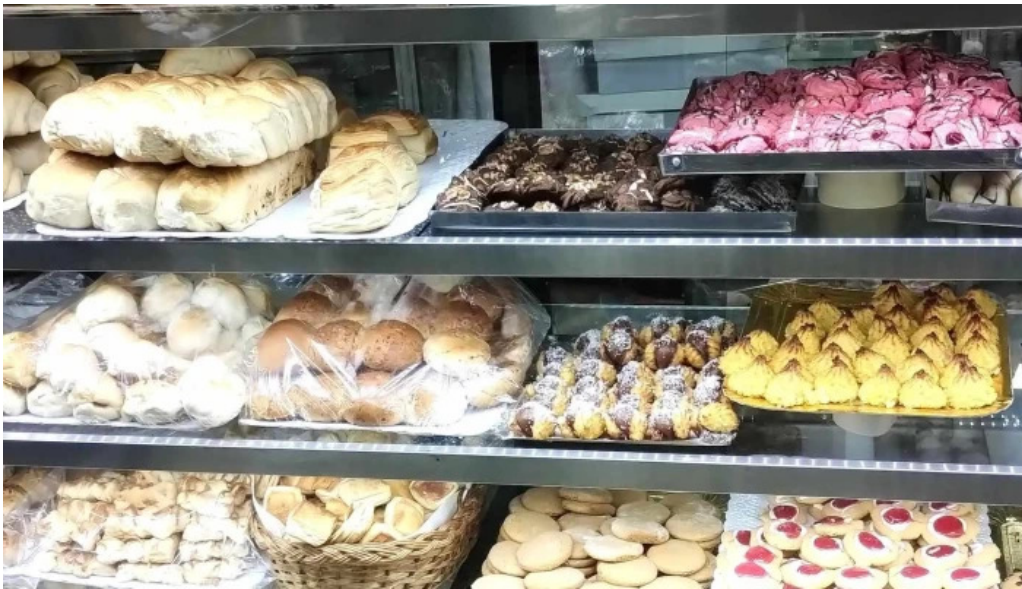
La primavera promocion