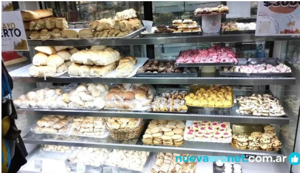
La primavera pastel