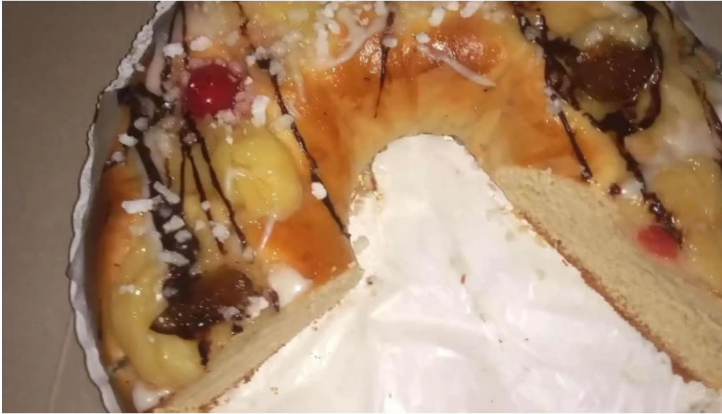
La primavera descuentos