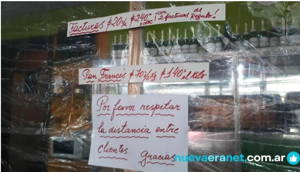
La primavera carta