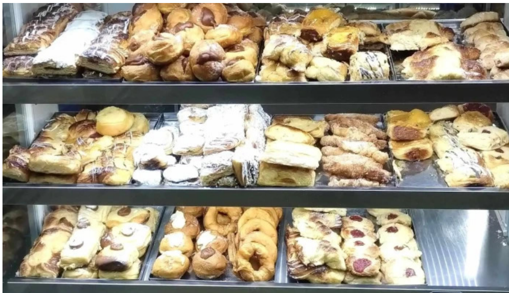
La primavera numero