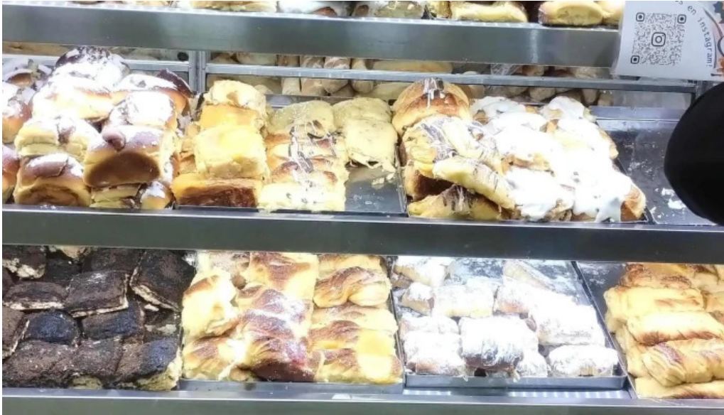
La primavera zona