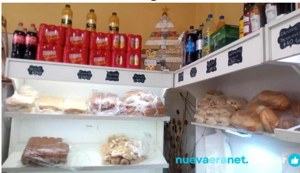
La nueva facultad vitrina