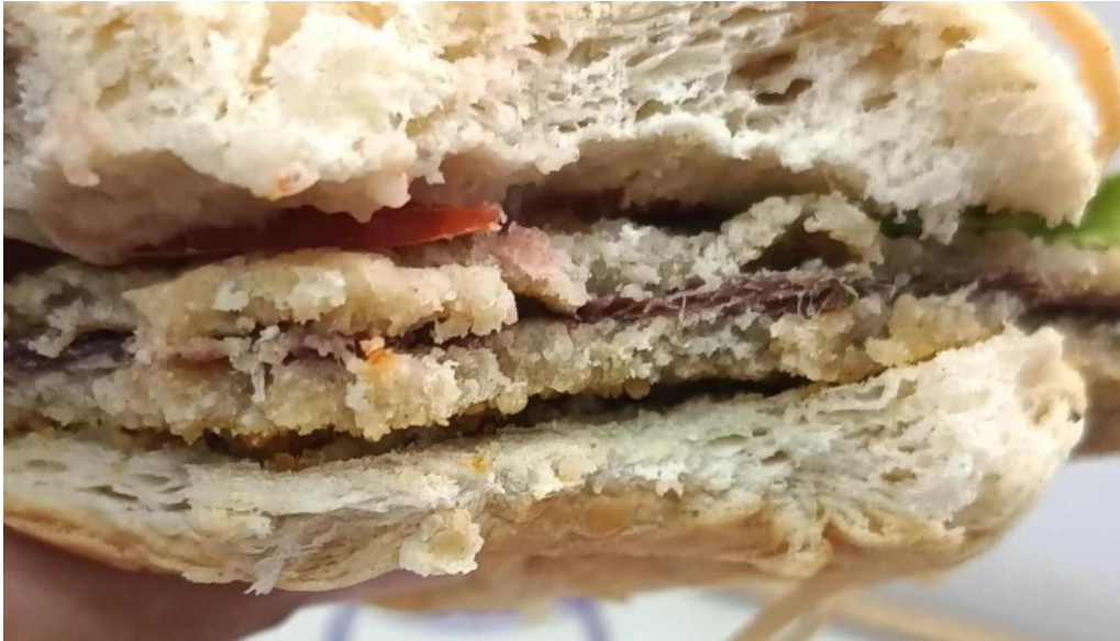
La nueva facultad cdad autonoma de buenos aires