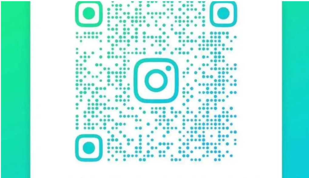
La nueva facultad mas recientes