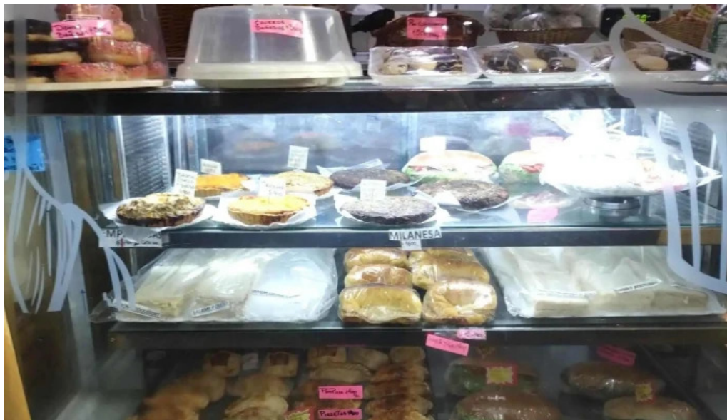
La nueva facultad pastel