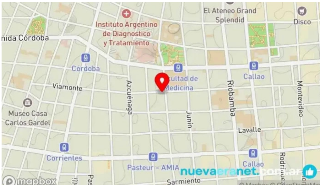
La nueva facultad mapa