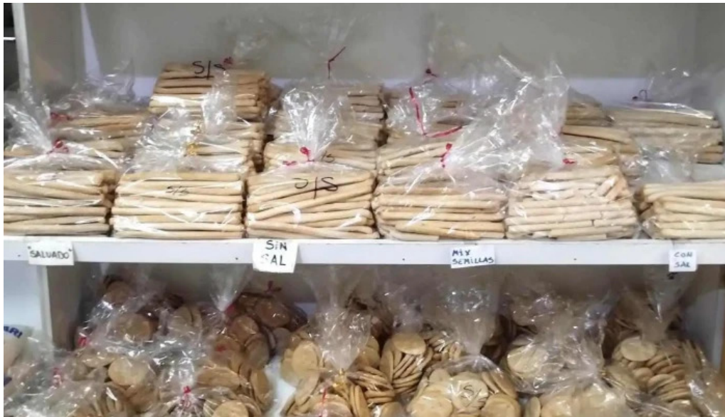
La nueva facultad del propietario