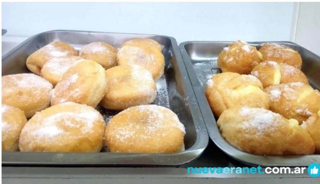
La nueva facultad comida y bebida