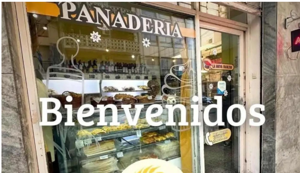
La nueva facultad videos