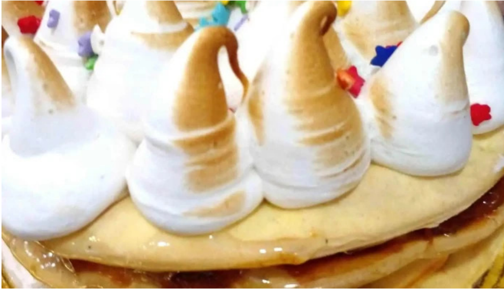
La mallorquina confiteria del propietario