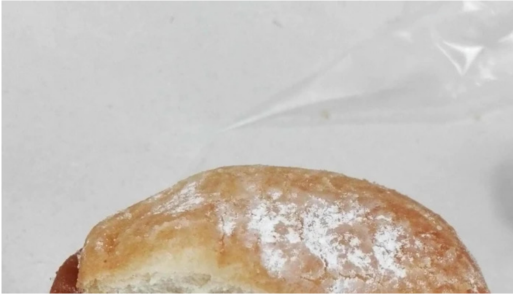
La mallorquina confiteria precios