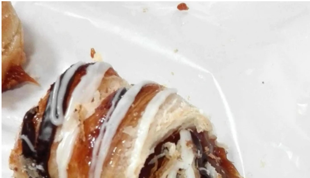
La mallorquina confiteria promocion