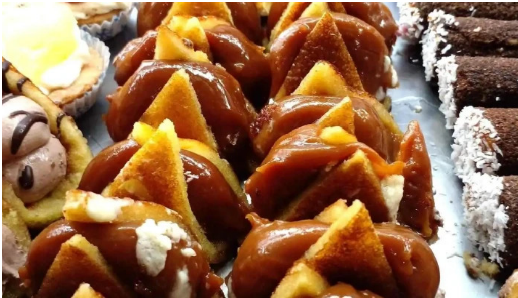
La mallorquina confiteria comida y bebida