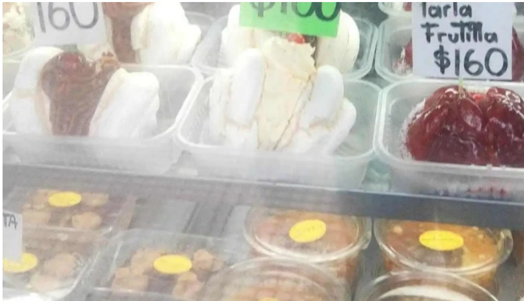
La mallorquina confiteria vitrina