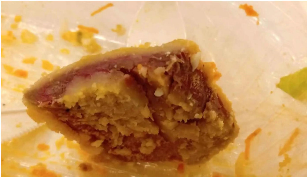
La mallorquina confiteria fotos