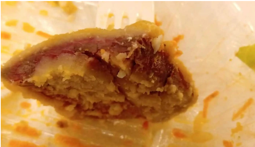
La mallorquina confiteria cdad autonoma de buenos aires