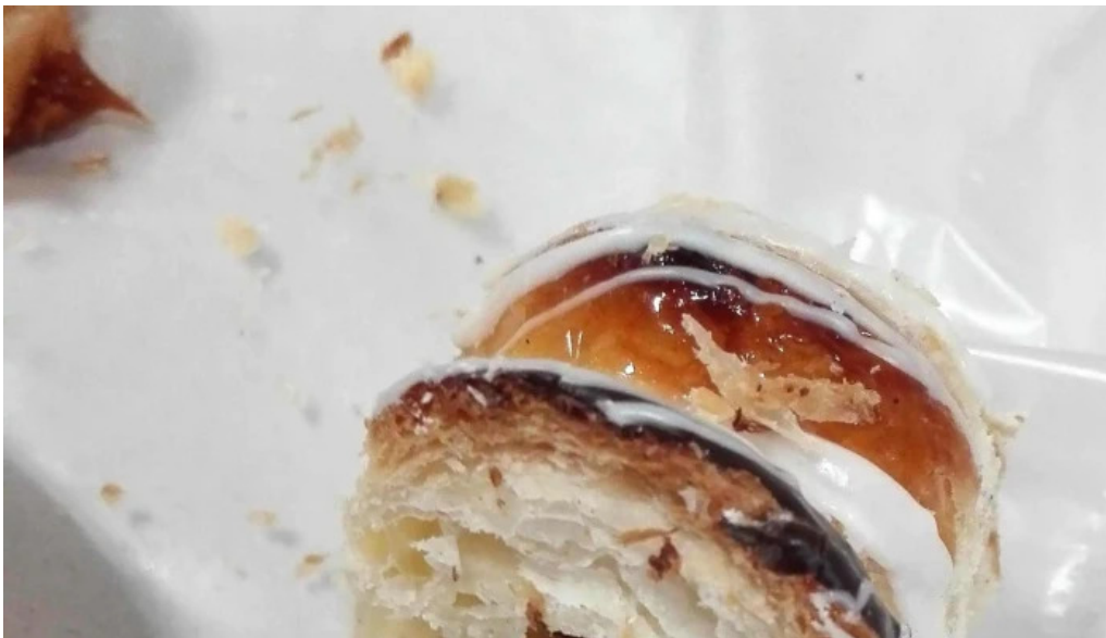
La mallorquina confitería zona