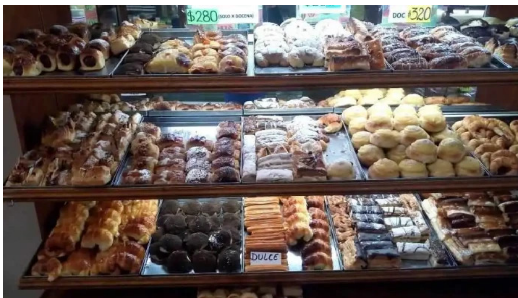
La mallorquina confiteria ambiente