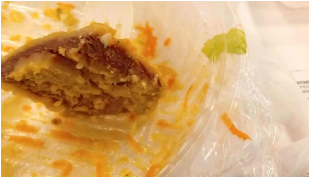
La mallorquina confiteria opiniones