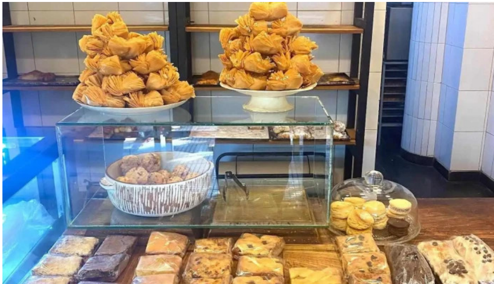
La aldea casa de medialunas ambiente