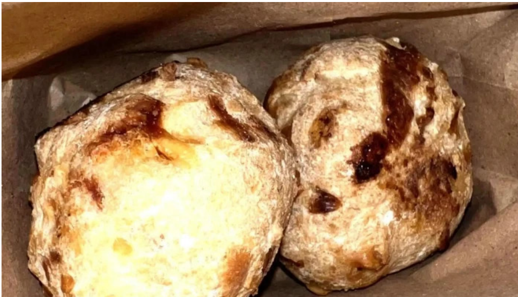
La aldea casa de medialunas catalogo