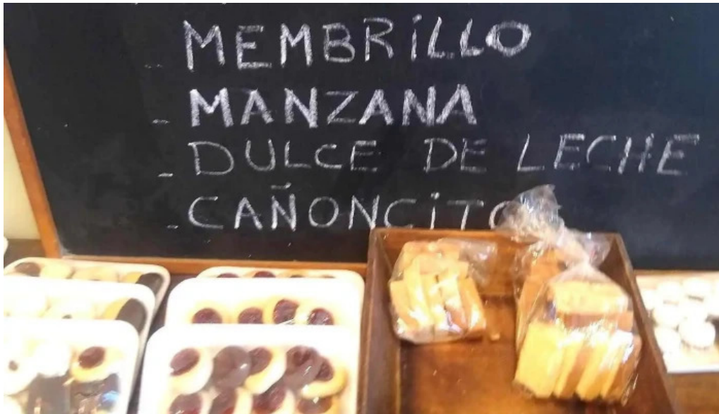
La aldea casa de medialunas carta