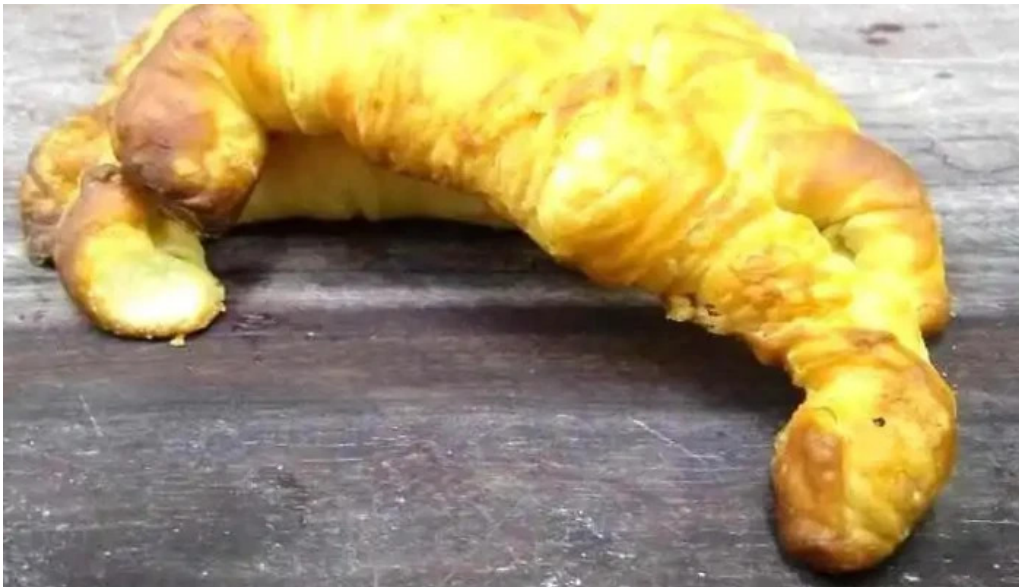
La aldea casa de medialunas croissant