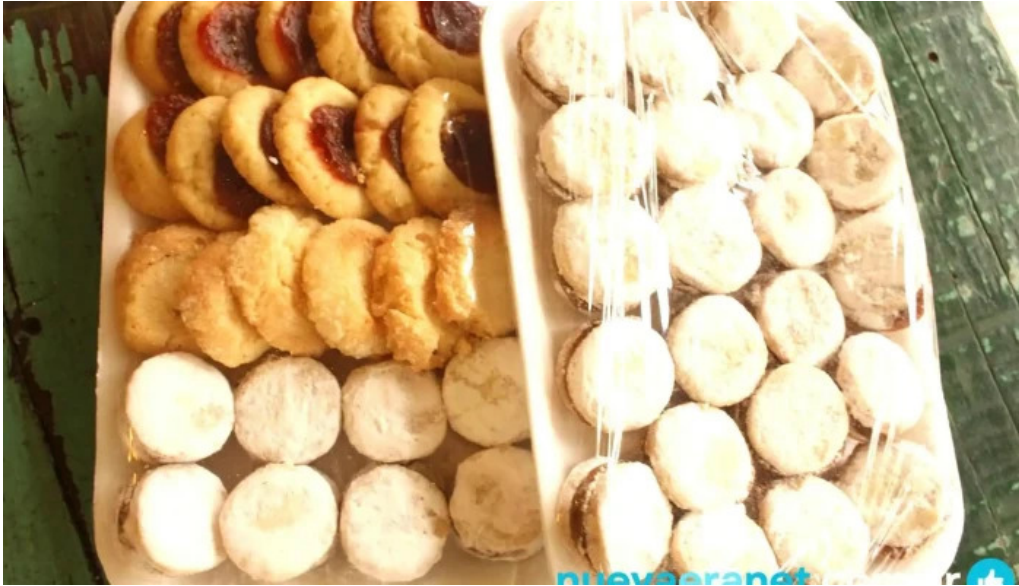
La aldea casa de medialunas del propietario