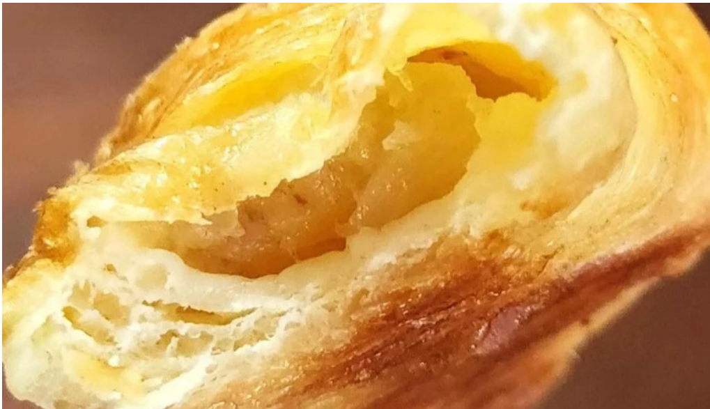
La aldea casa de medialunas promocion