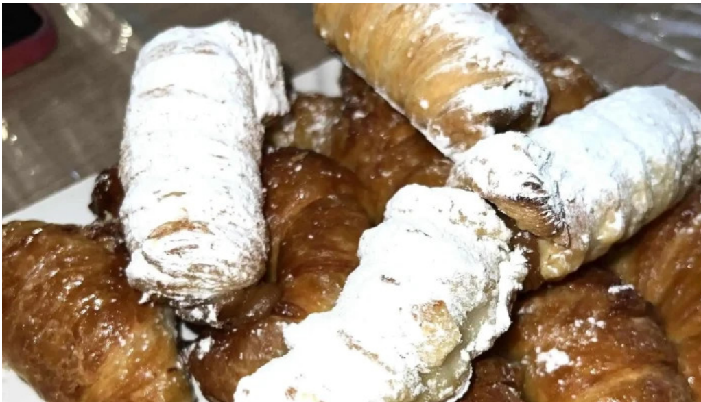
La aldea casa de medialunas telefono