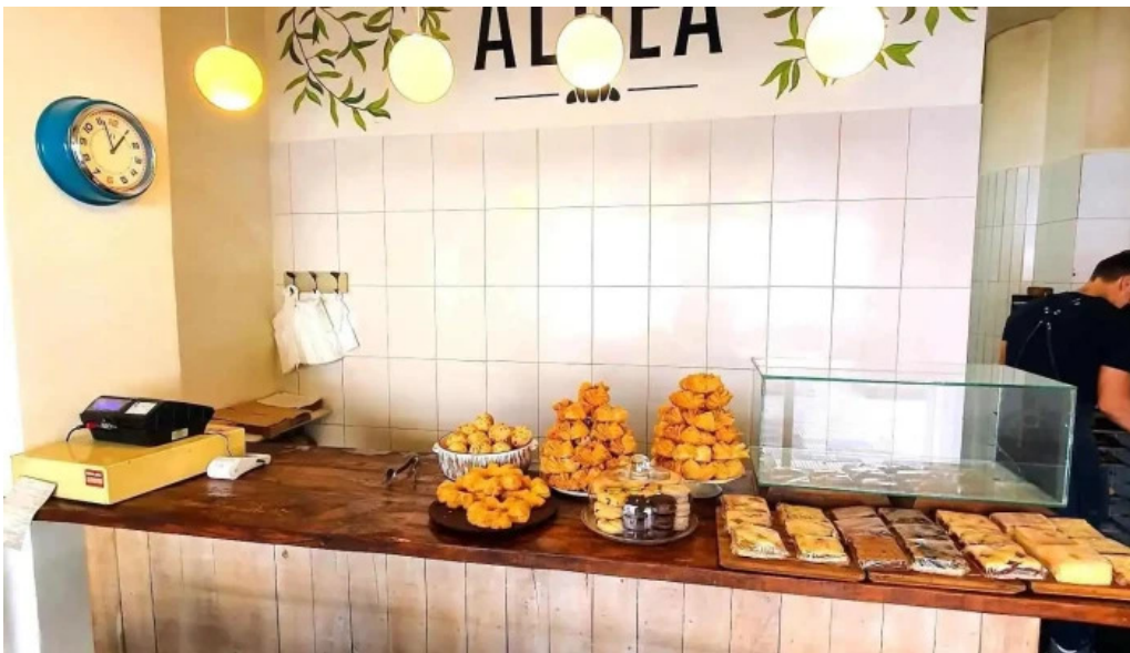
La aldea casa de medialunas comida y bebida