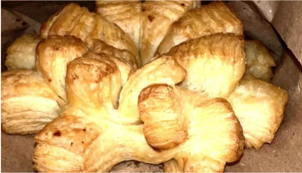
La aldea casa de medialunas ubicacion