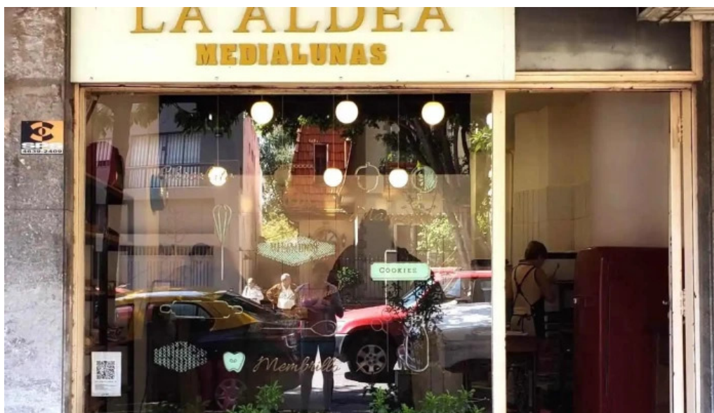
La aldea casa de medialunas vitrina