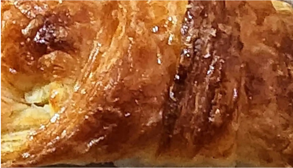
La aldea casa de medialunas cdad autonoma de buenos aires