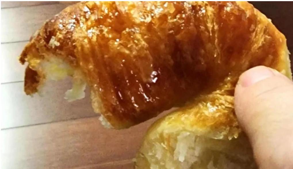
La aldea casa de medialunas como llegar