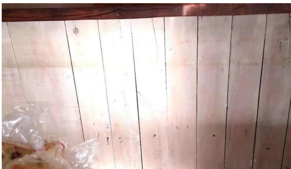
La aldea casa de medialunas videos