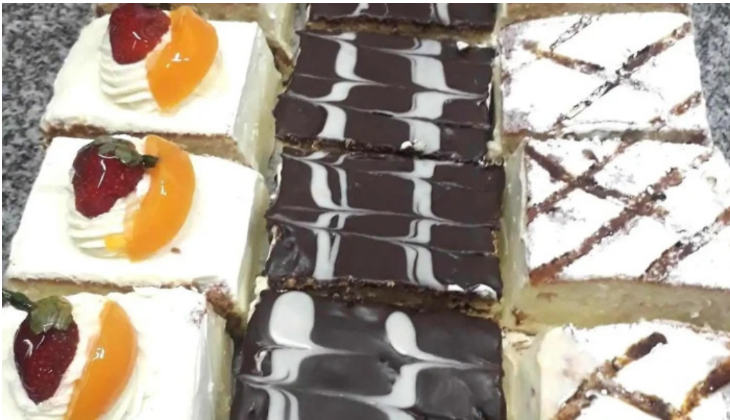
Cosas ricas comida y bebida