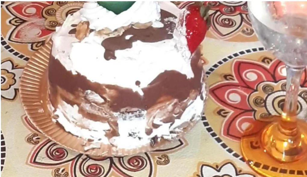
Cosas ricas cerca de mi