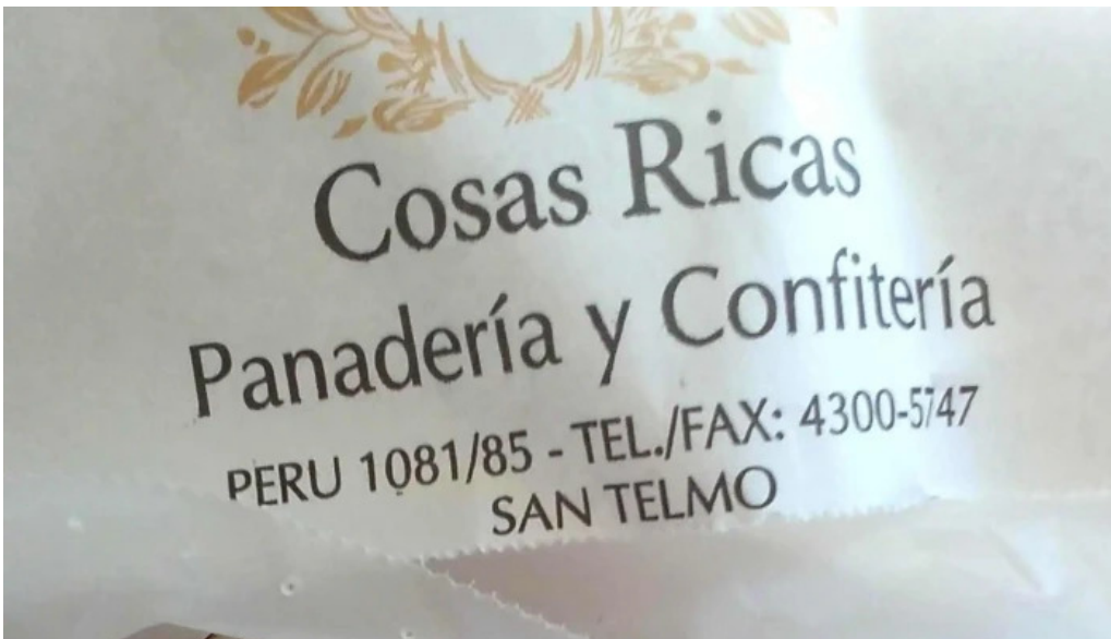
Cosas ricas cdad autonoma de buenos aires