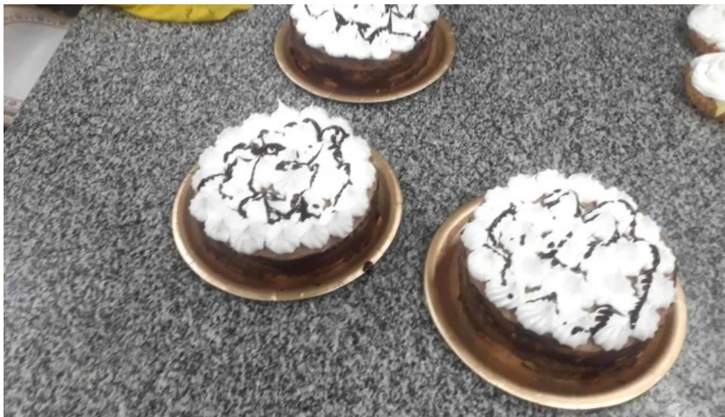
Cosas ricas pastel