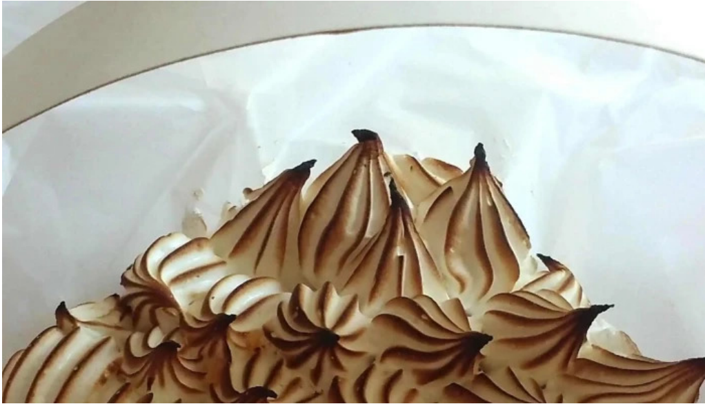
Cosas ricas fotos