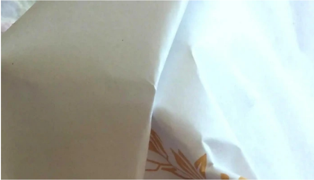
Cosas ricas direccion