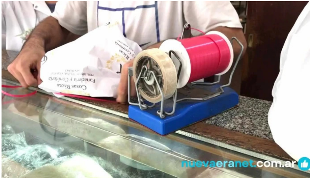
Cosas ricas videos