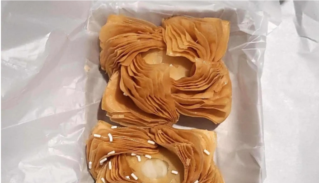
Cosas ricas numero