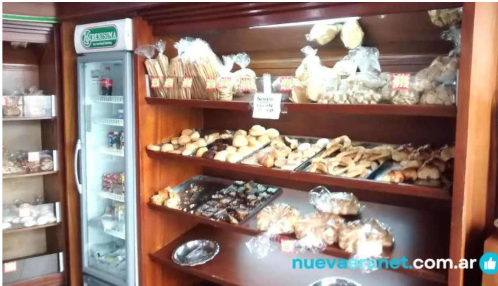
Cosas ricas ambiente