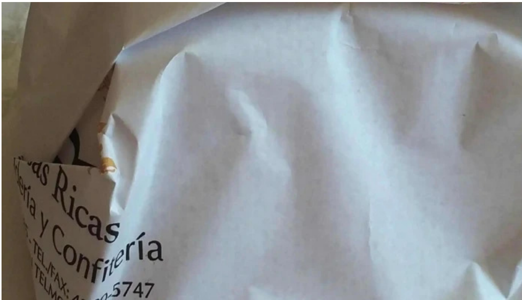
Cosas ricas donde