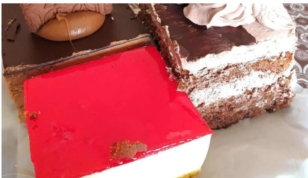
Confiteria panaderia la flor guarani abierto ahora