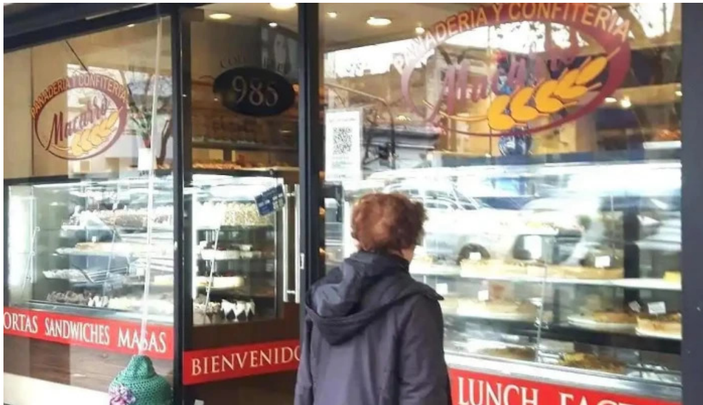
Confiteria panaderia la flor guarani vitrina