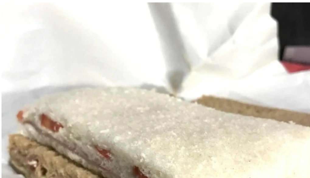
Confiteria panaderia la flor guarani cdad autonoma de buenos aires