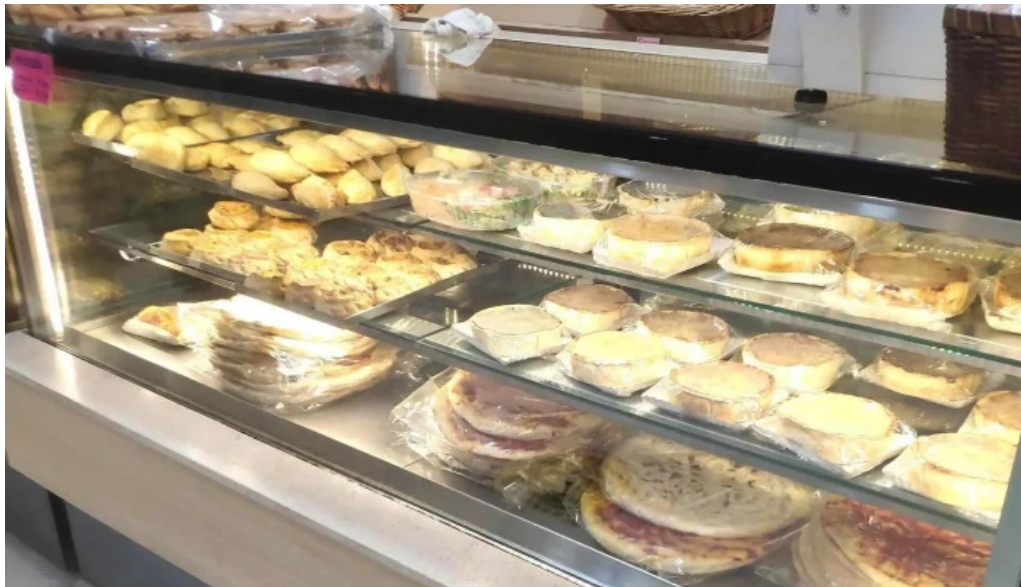
Confiteria panaderia gaby zona