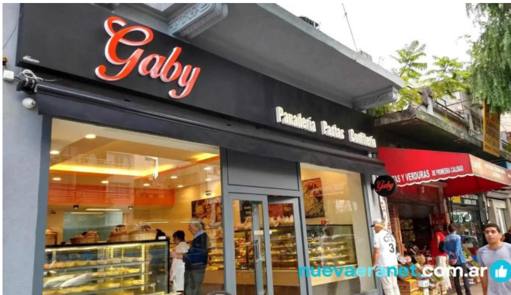
Confiteria panaderia gaby vitrina