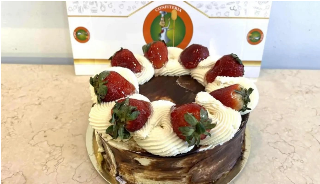
Confiteria panaderia gaby comida y bebida