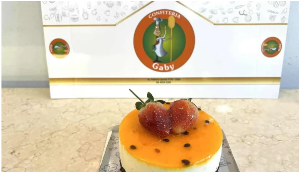
Confiteria panaderia gaby del propietario