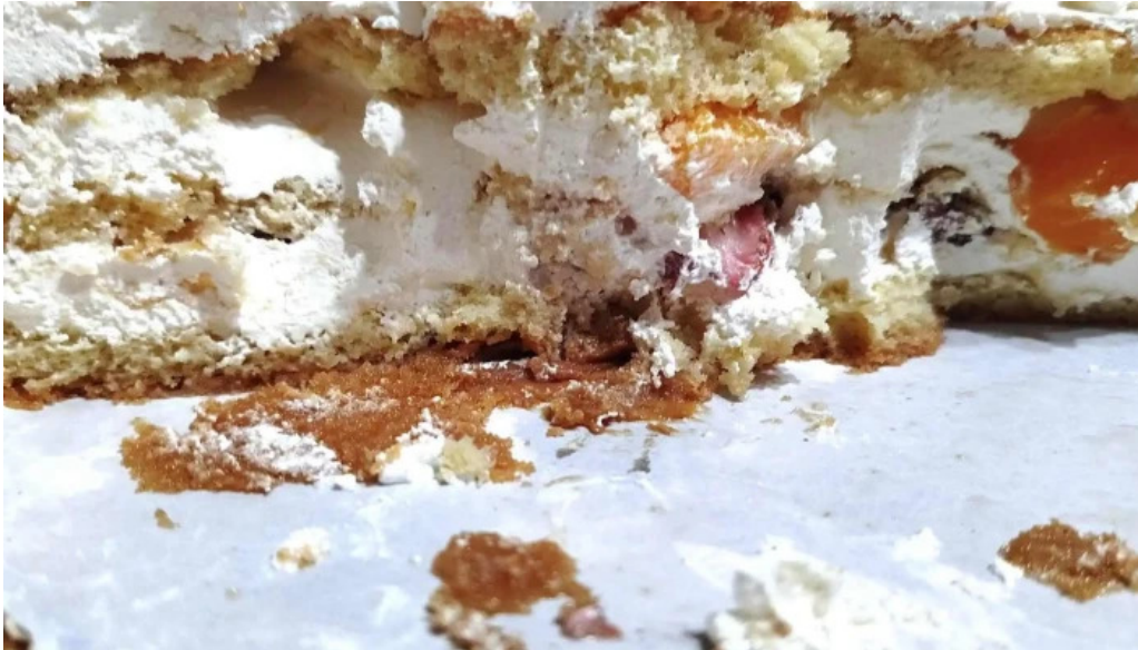
Confiteria panaderia gaby cdad autonoma de buenos aires