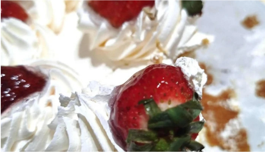
Confiteria panaderia gaby puntaje