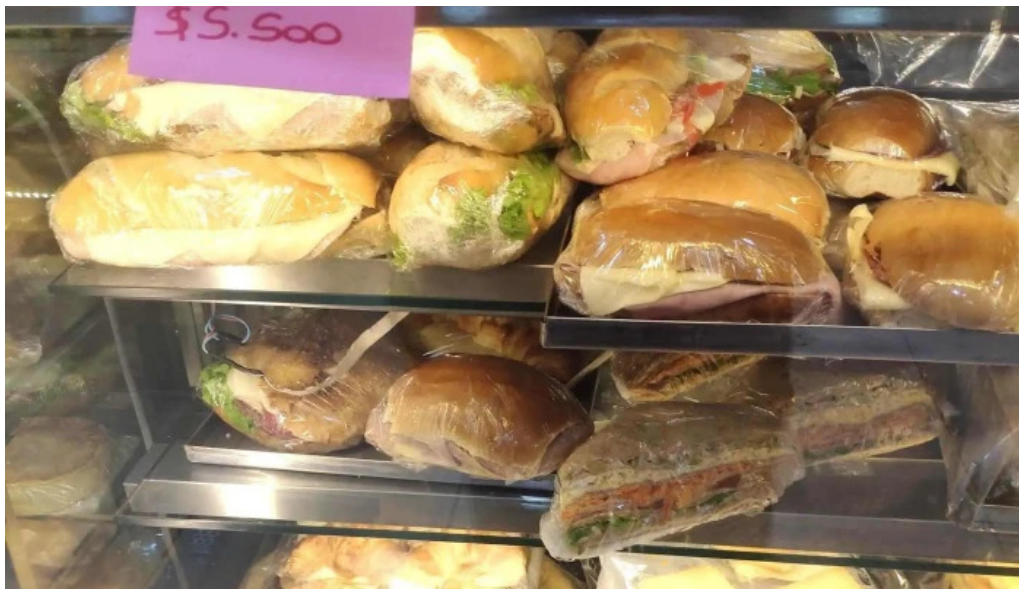
Confiteria panaderia gaby como llegar