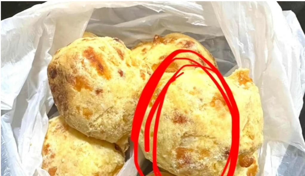
Confiteria panaderia gaby ubicacion