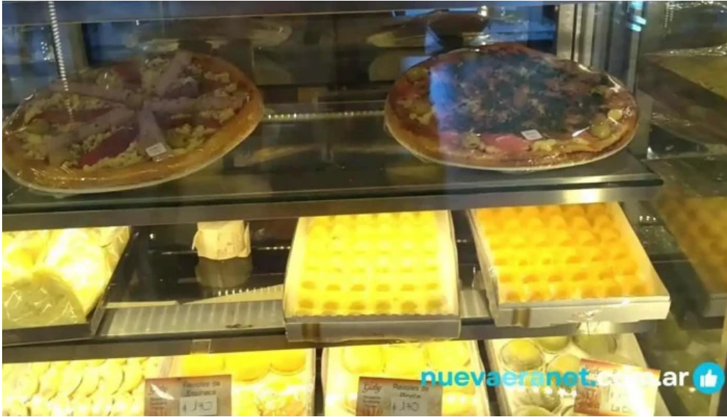
Confiteria panaderia gaby videos