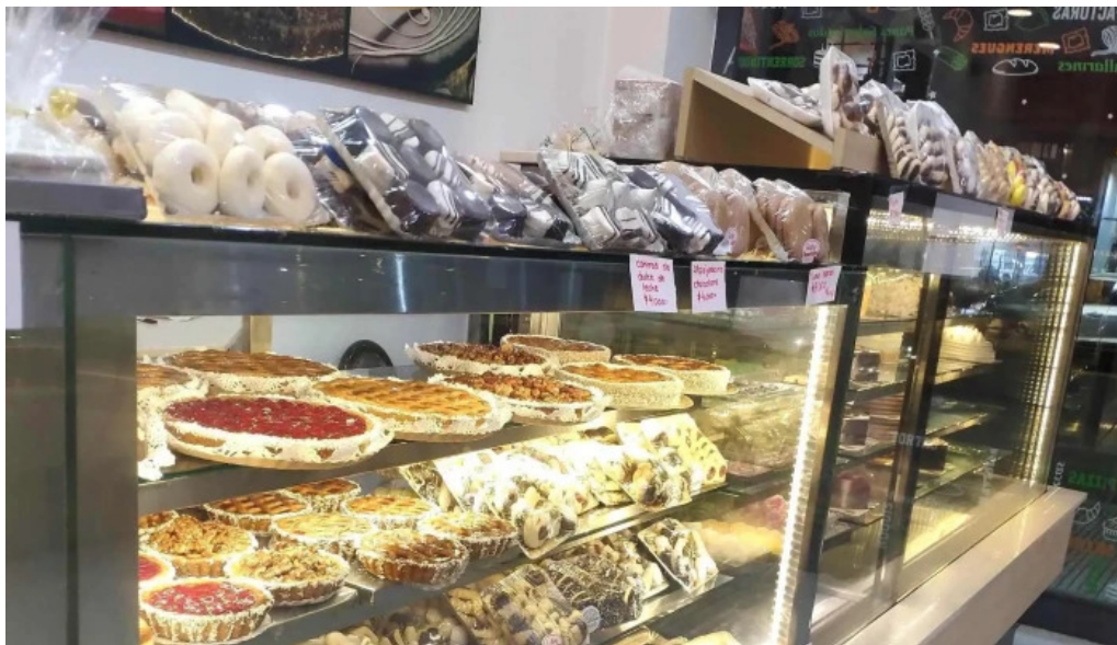
Confeitería panadería gaby fotos