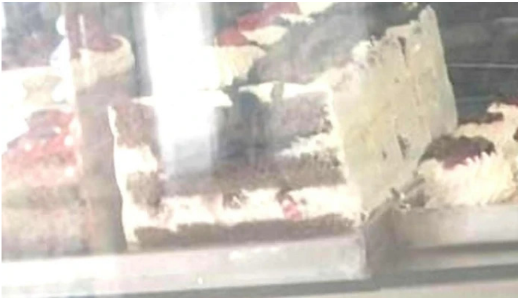
Confiteria panaderia gaby comentarios