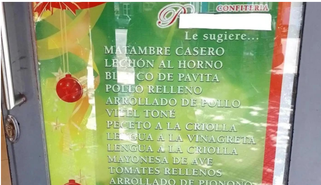
Confiteria panaderia gaby carta