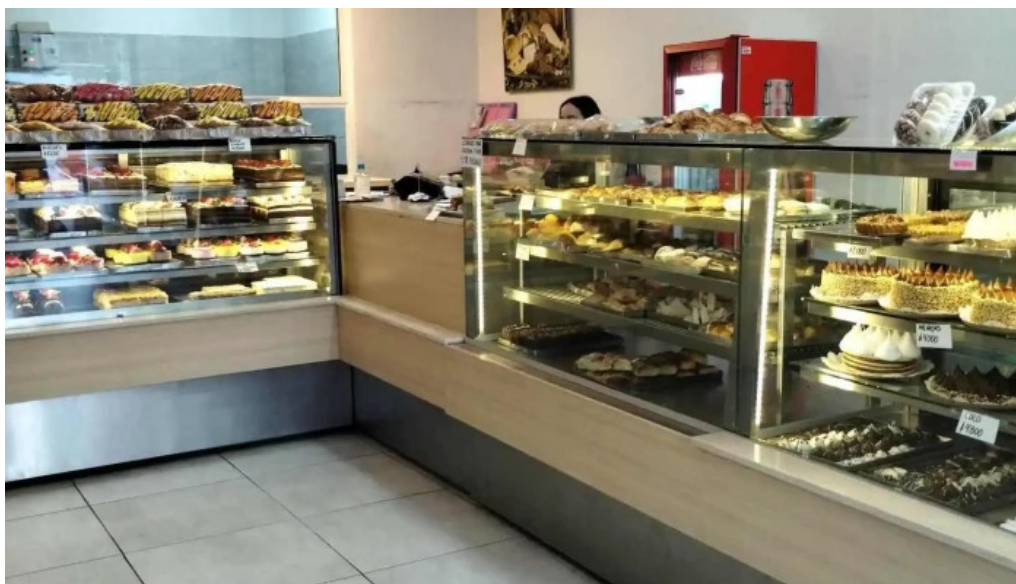
Confiteria panaderia gaby ambiente