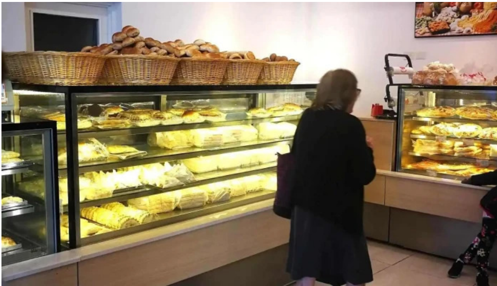
Confiteria panaderia gaby pastel