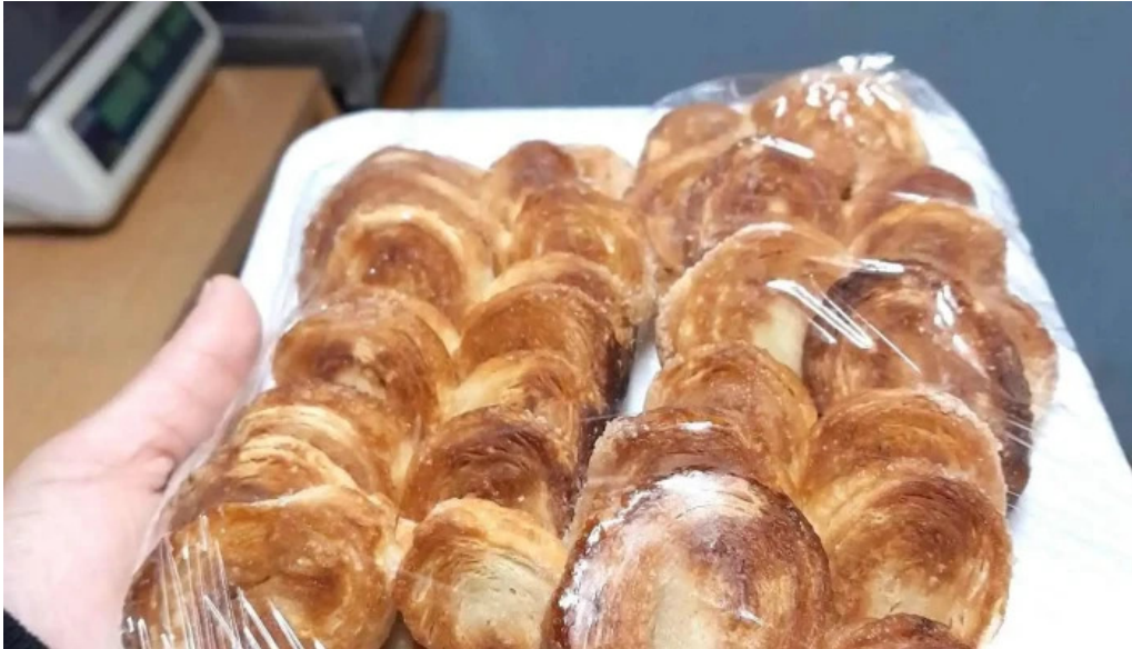
El pan de cada día puntaje