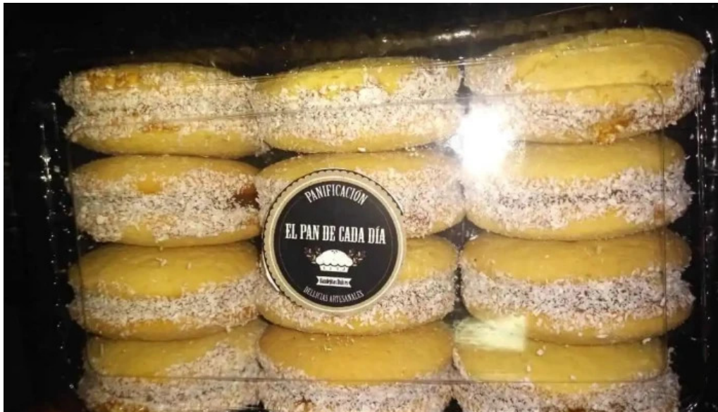
El pan de cada día comida y bebida