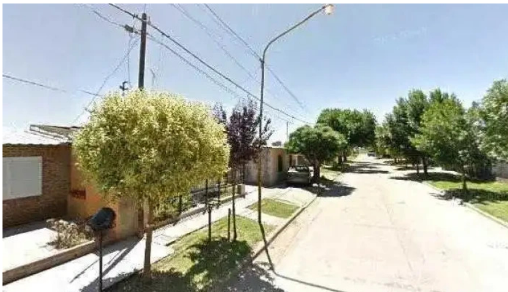
El pan de cada día puntajedeg