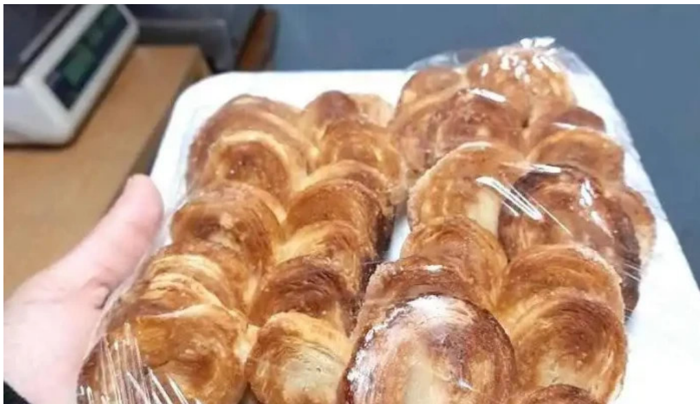
El pan de cada día casilda