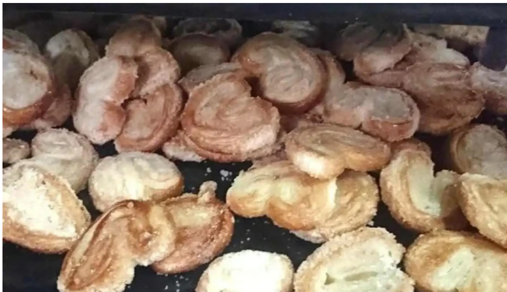
Panaderia artesanal johansen comida y bebida