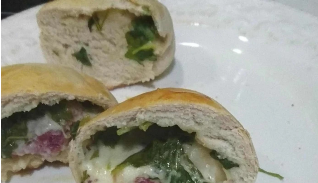
Panadería artesanal johansen canada de gomez