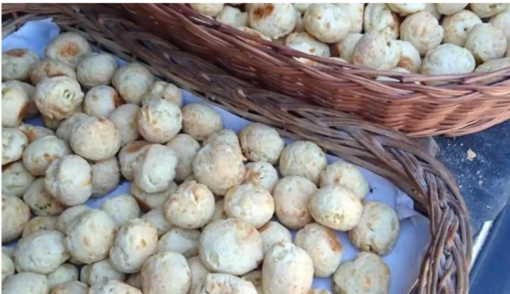
Panaderia artesanal johansen precios