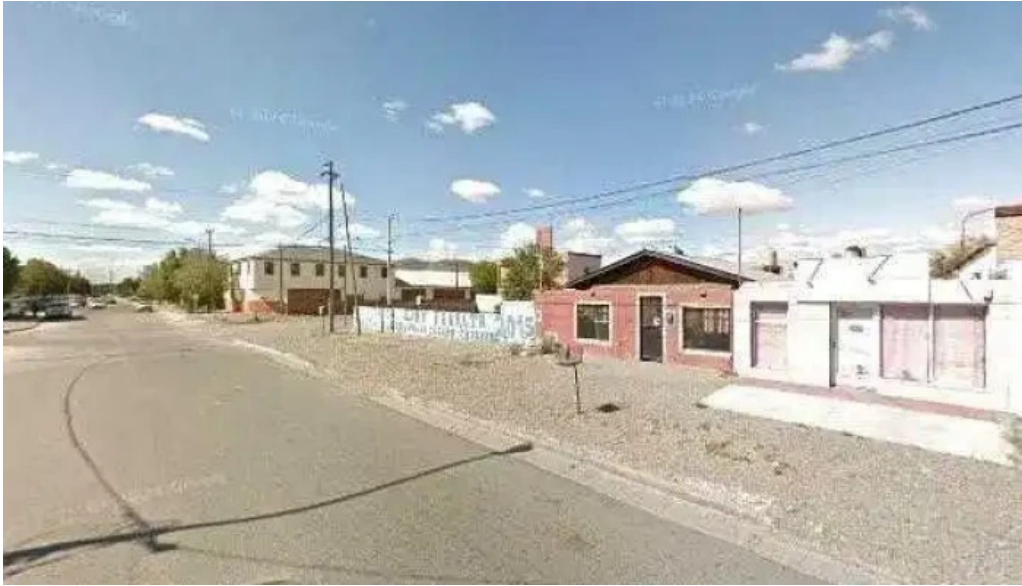
Panificadora anala telefonodeg