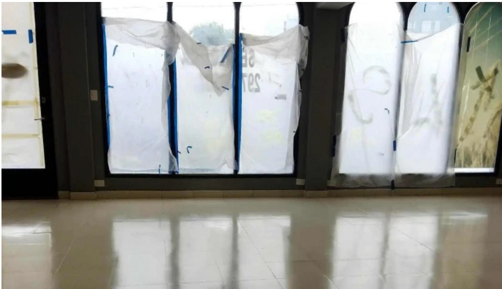
Panificadora anala telefono