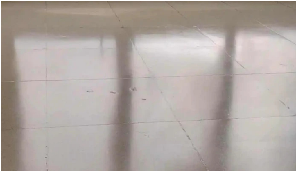
Panificadora anala videos