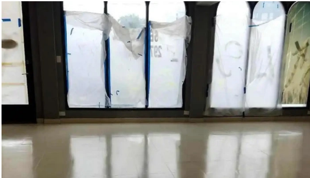
Panificadora anala caleta olivia