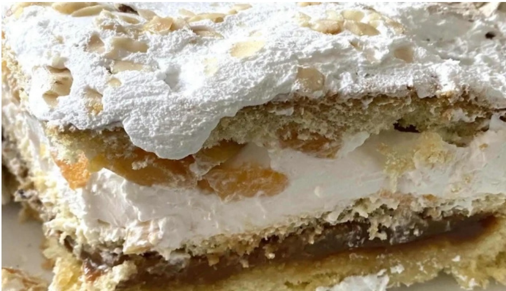
Panaderia y confiteria cremar caleta olivia