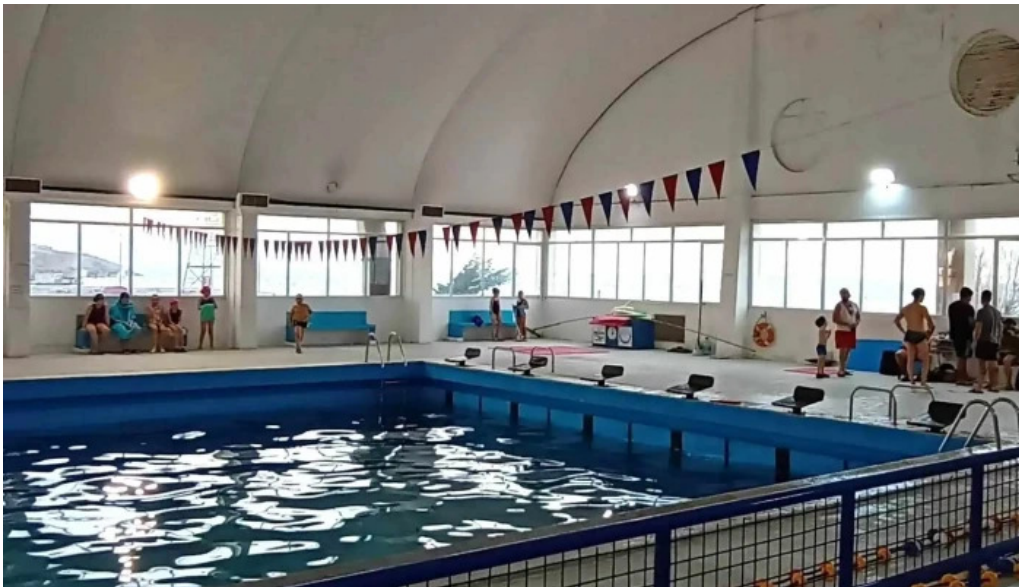
Panaderia y confiteria cremar descuentos