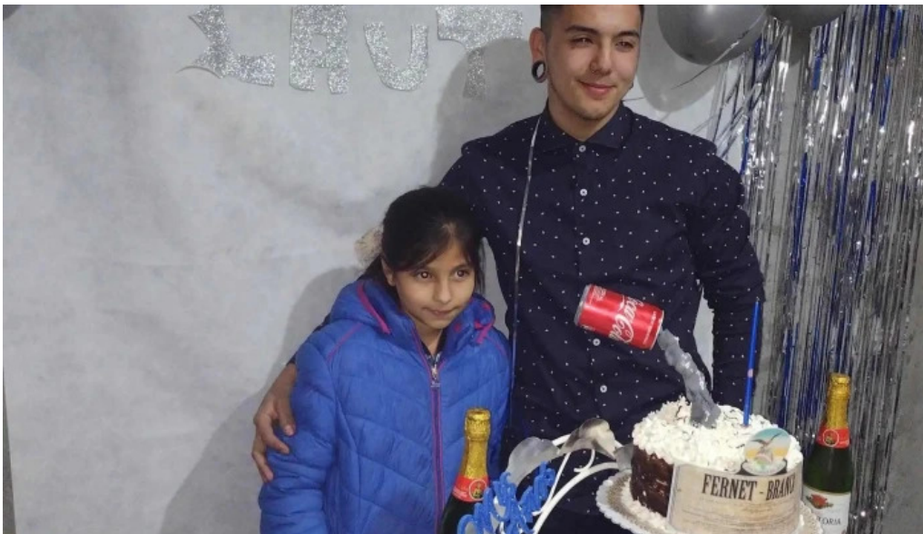
Panaderia y confiteria cremar zona