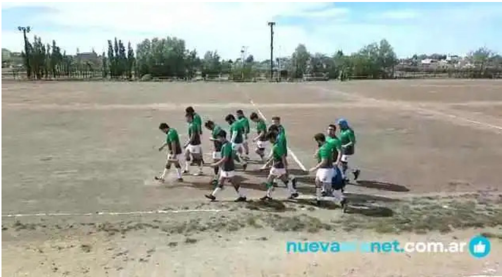
Panaderia y confiteria cremar videos