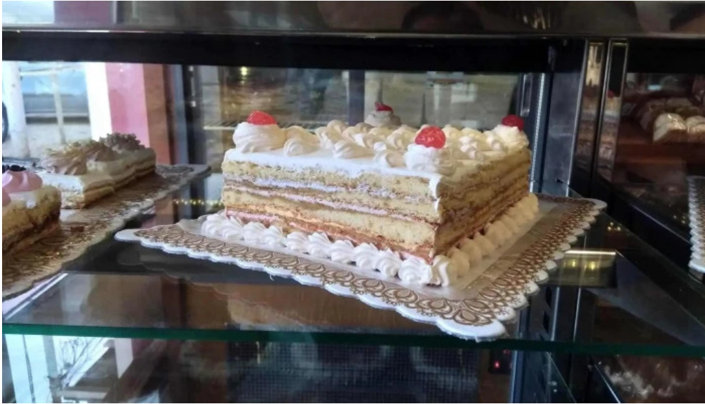
Panaderia y confiteria cremar vitrina