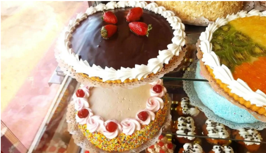
Panaderia y confiteria cremar comida y bebida