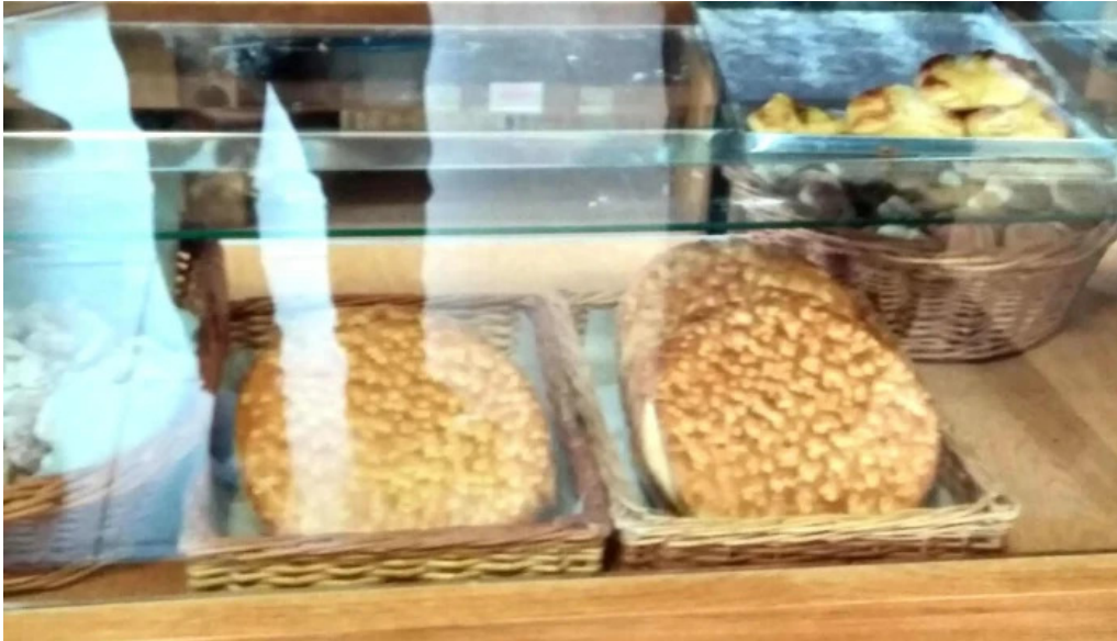
Panadería y confitería cremar ambiente