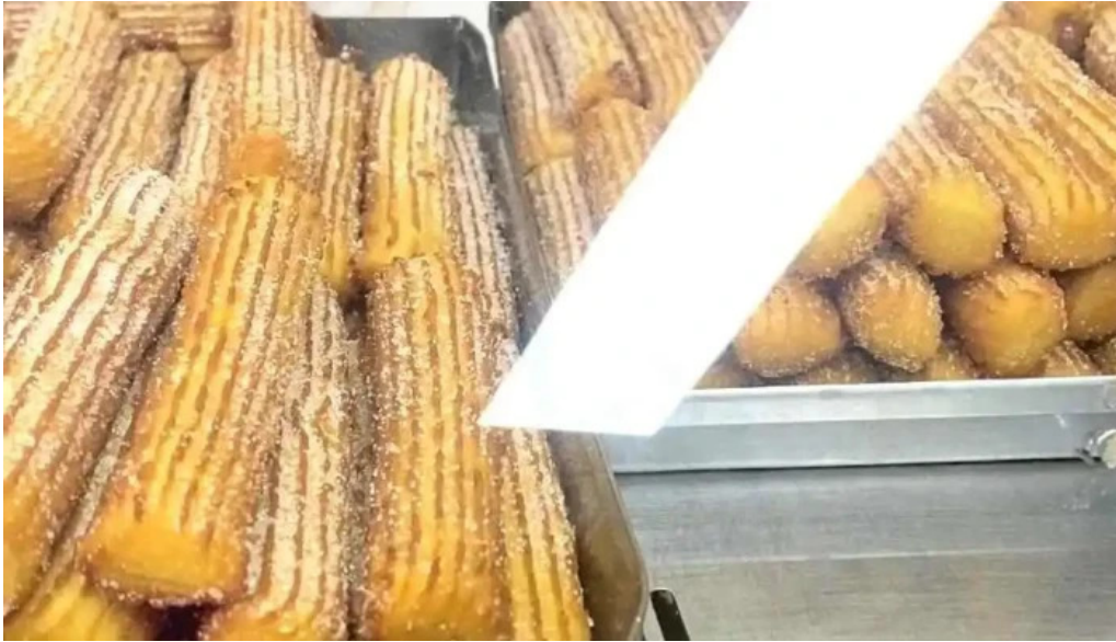
Panaderia mon petit comida y bebida