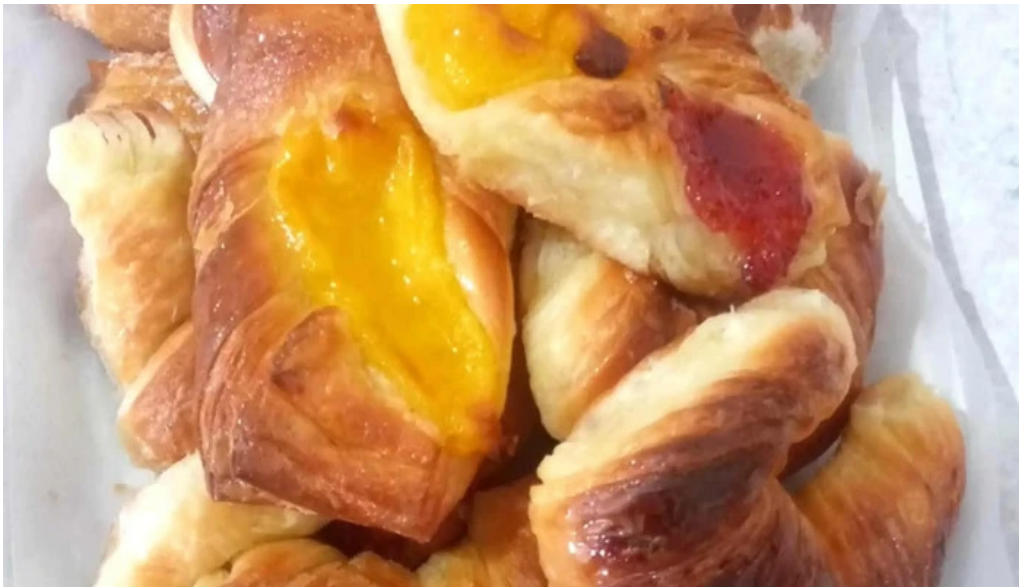
Panaderia mon petit instagram