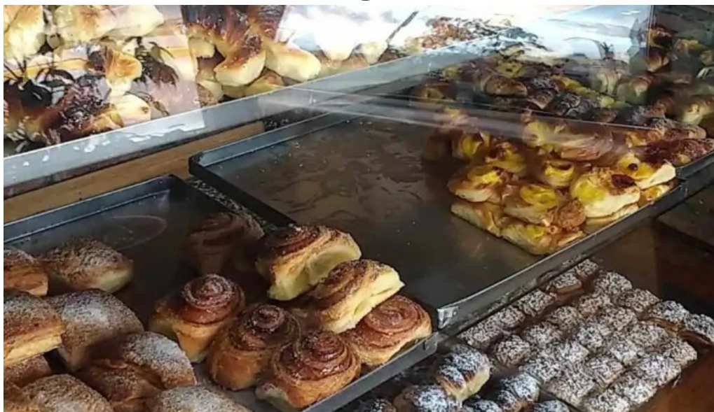
Panaderia mon petit vitrina