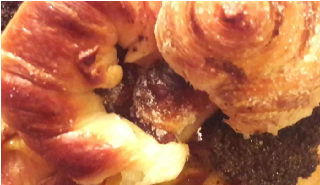
Panaderia mon petit caleta olivia