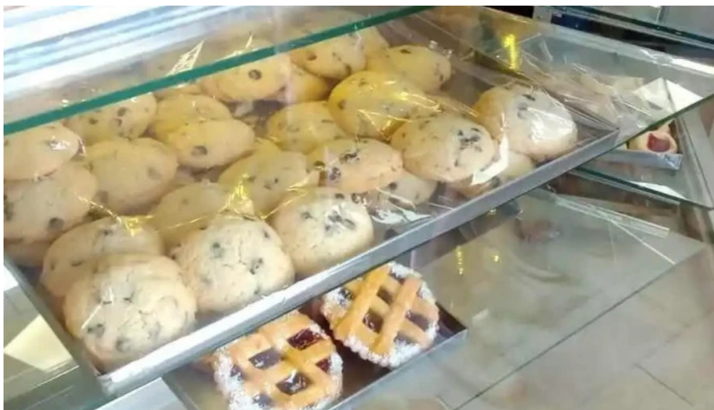
Panaderia mon petit ambiente