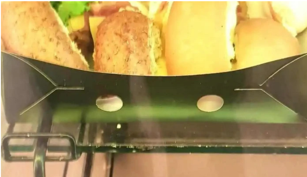
Chocolope comida y bebida