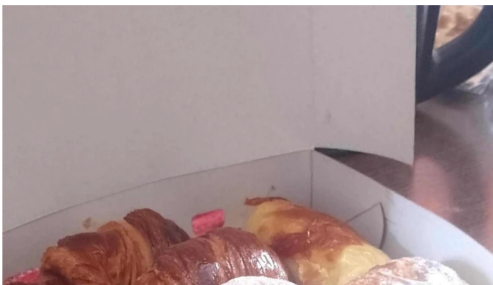
Chocolope caleta olivia