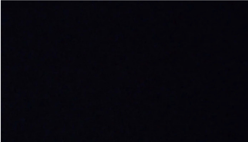
Panaderia el amanecer del propietario