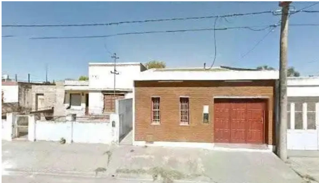
Panaderia el amanecer fotos