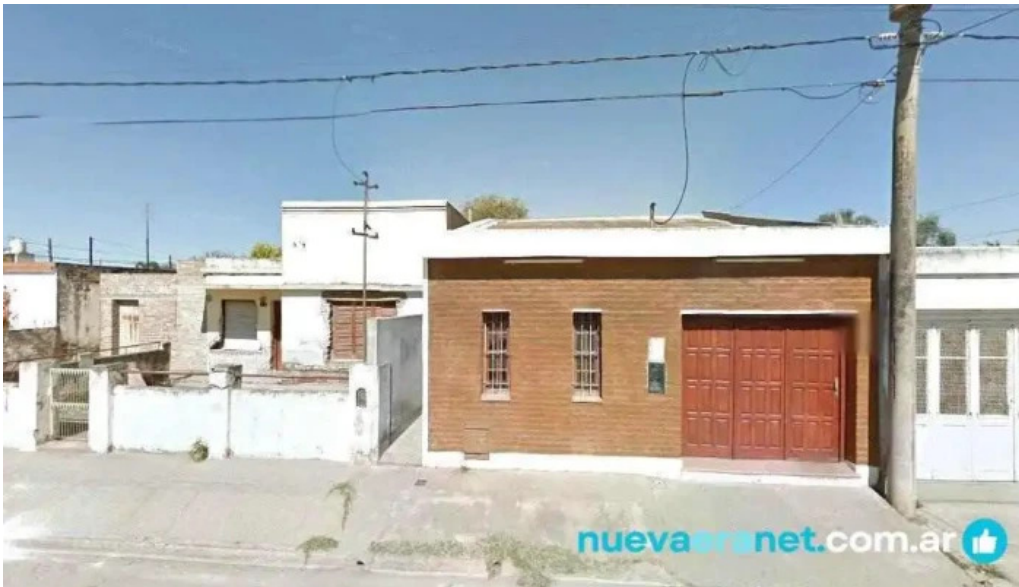
Panaderia el amanecer bell ville