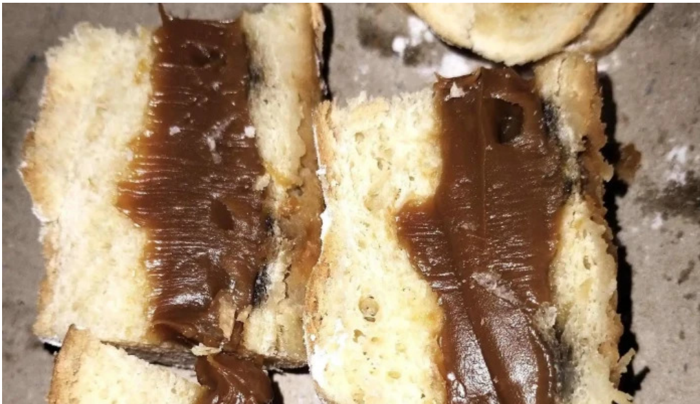
Panaderia y confiteria compostela abierto ahora