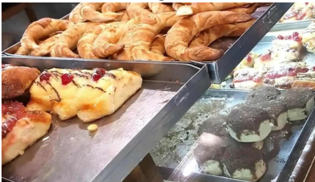
Panaderia y confiteria compostela vitrina