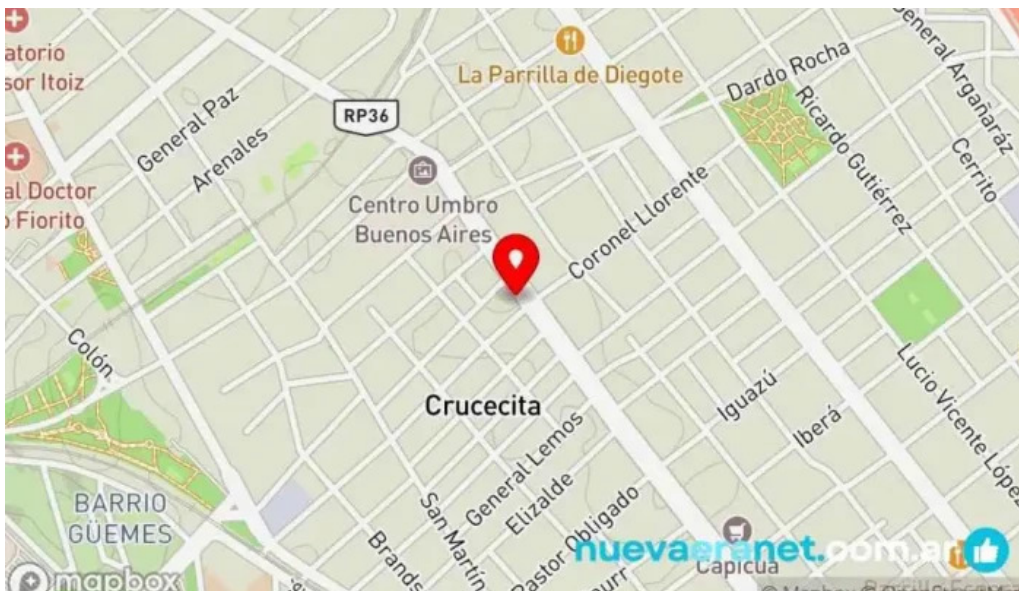
Panaderia y confiteria compostela mapa