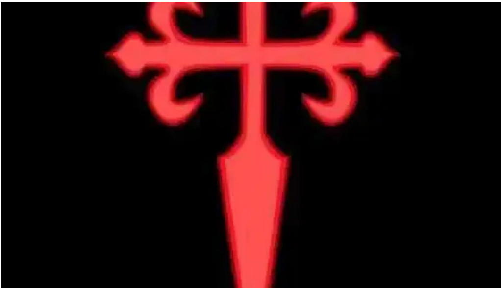
Panaderia y confiteria compostela del propietario