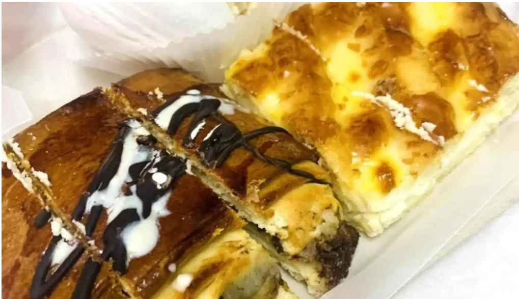
Panaderia y confiteria compostela pastel