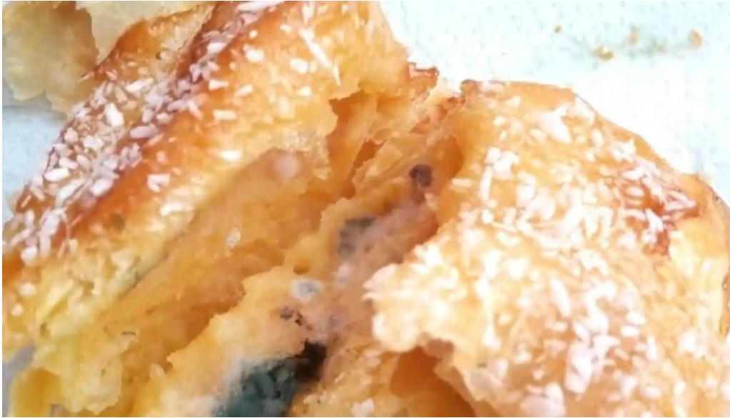
Panaderia y confiteria compostela comida y bebida