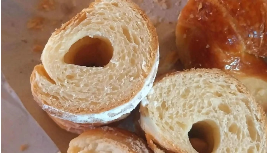
Panaderia y confiteria compostela horario