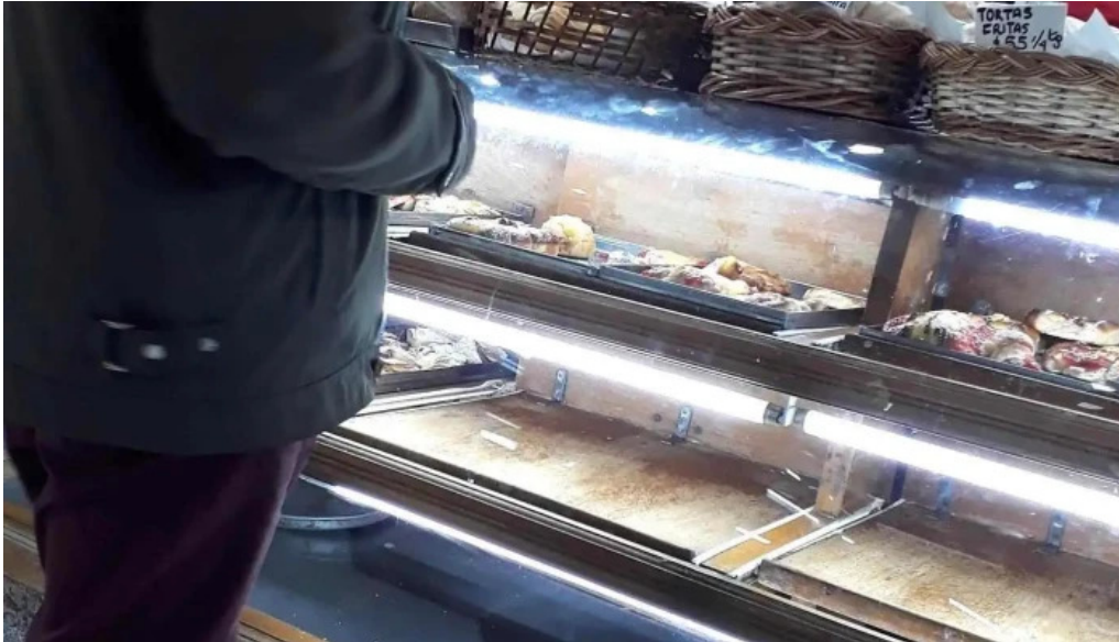
Panaderia y confiteria compostela ambiente