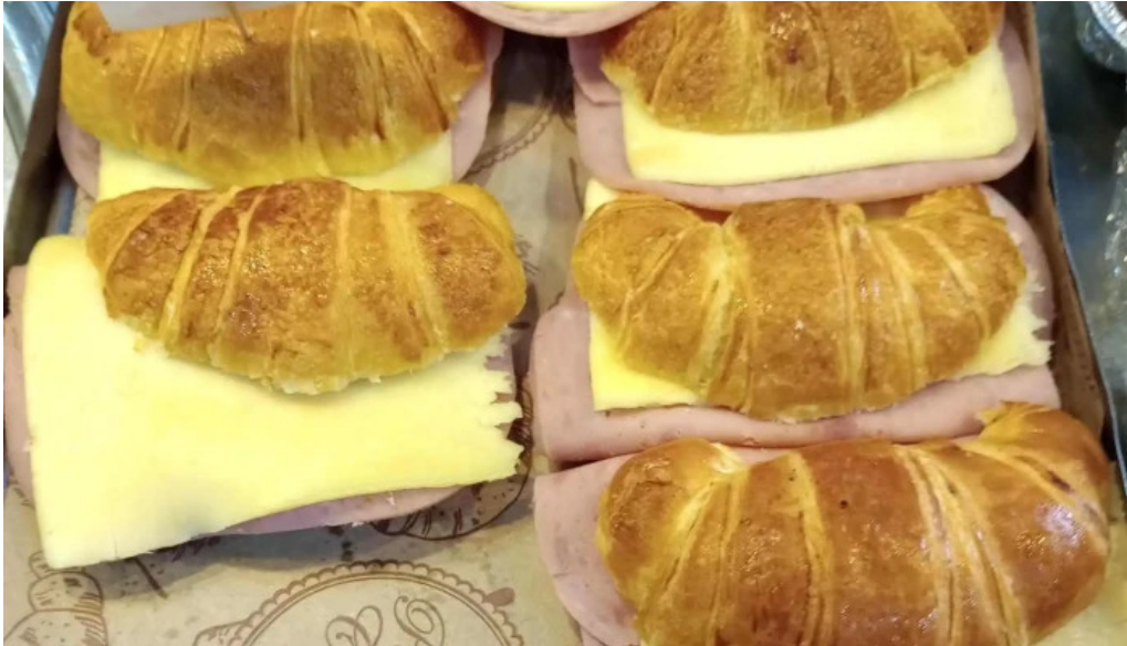
La nueva reina abierto ahora