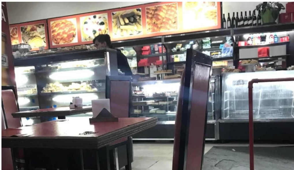
La nueva reina fotos