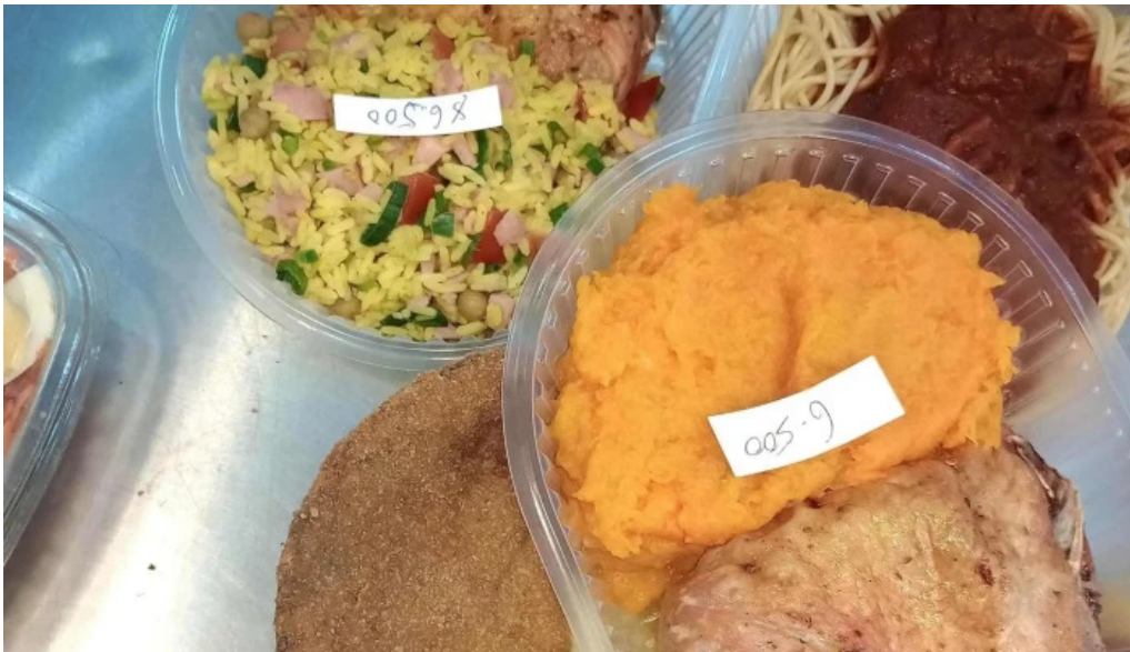
La nueva reina cerca de mi