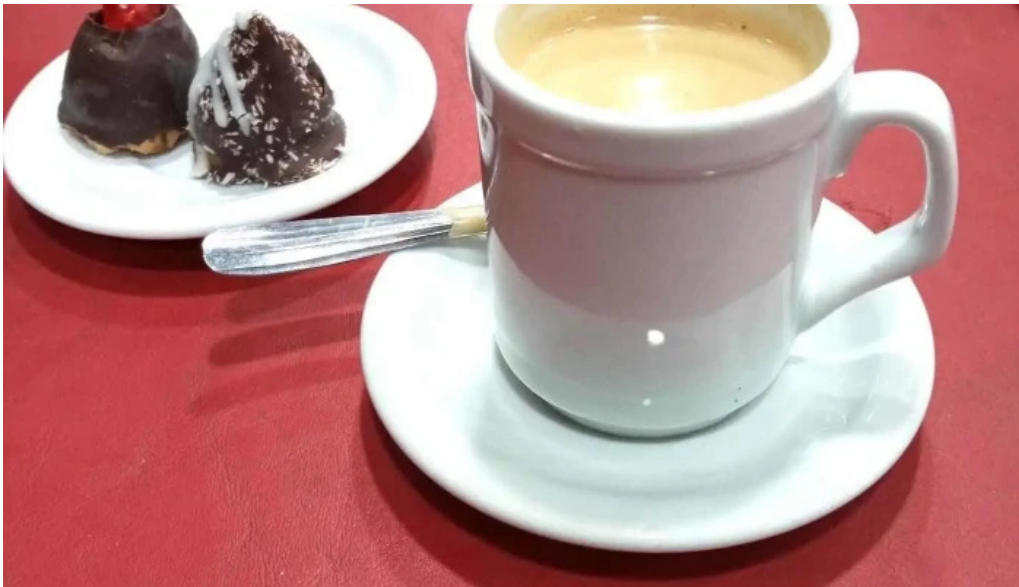
La nueva reina pastel