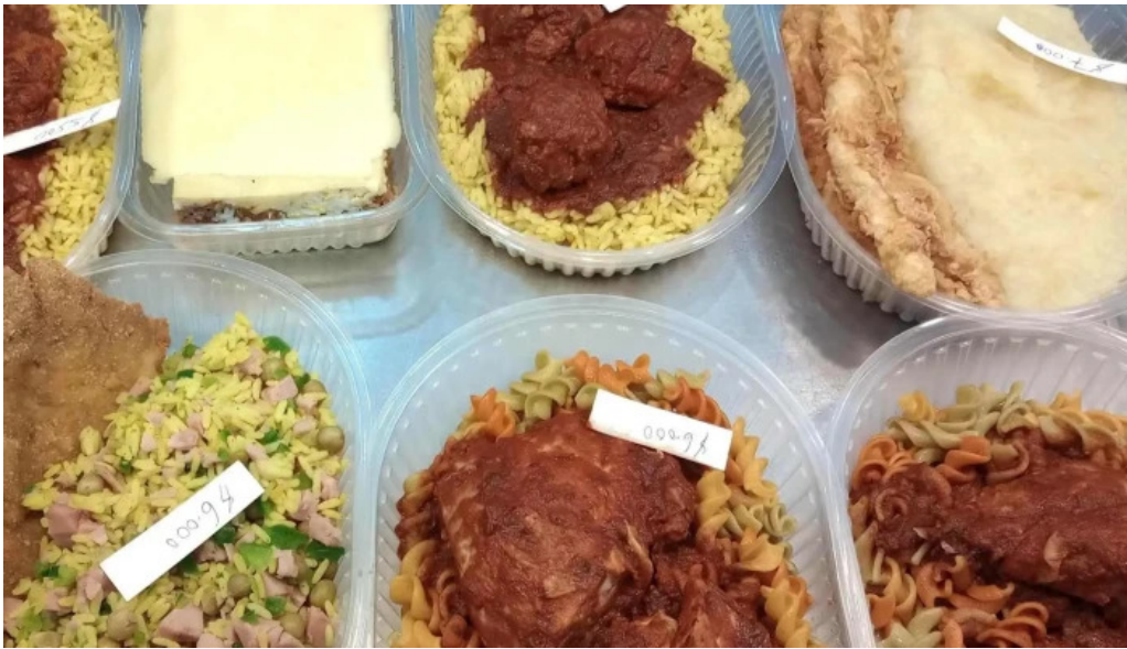
La nueva reina sitio web