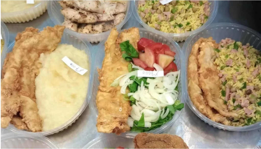
La nueva reina avellaneda