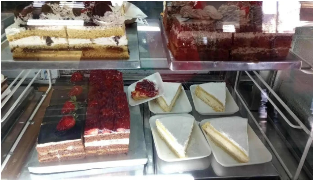
La nueva reina ambiente