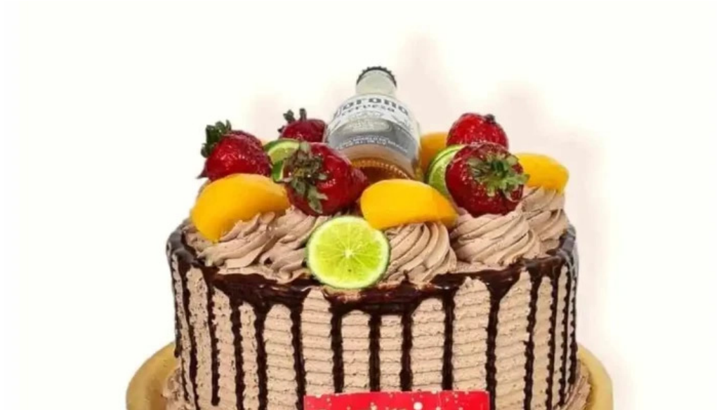
La nueva reina del propietario