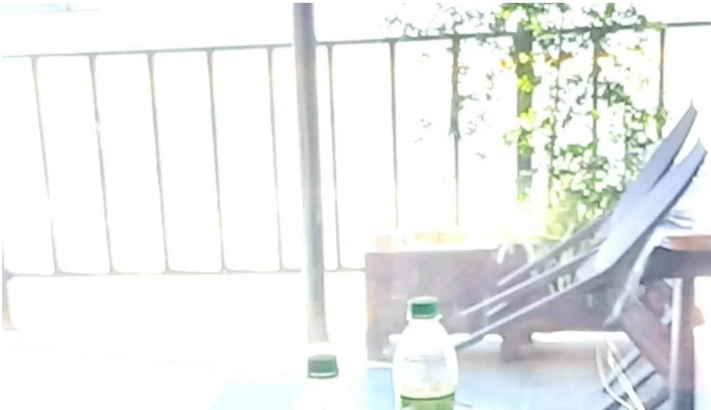
La nueva reina precios