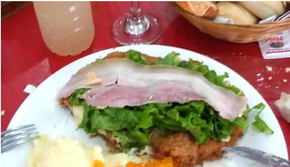
La nueva reina milanese