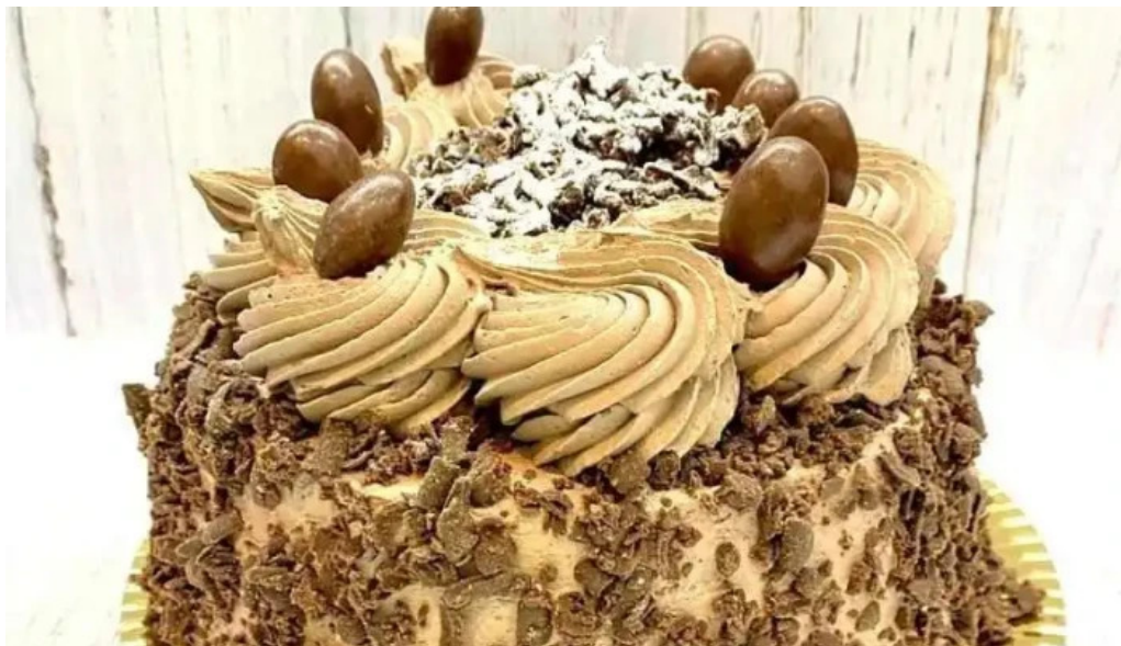
La nueva reina comida y bebida