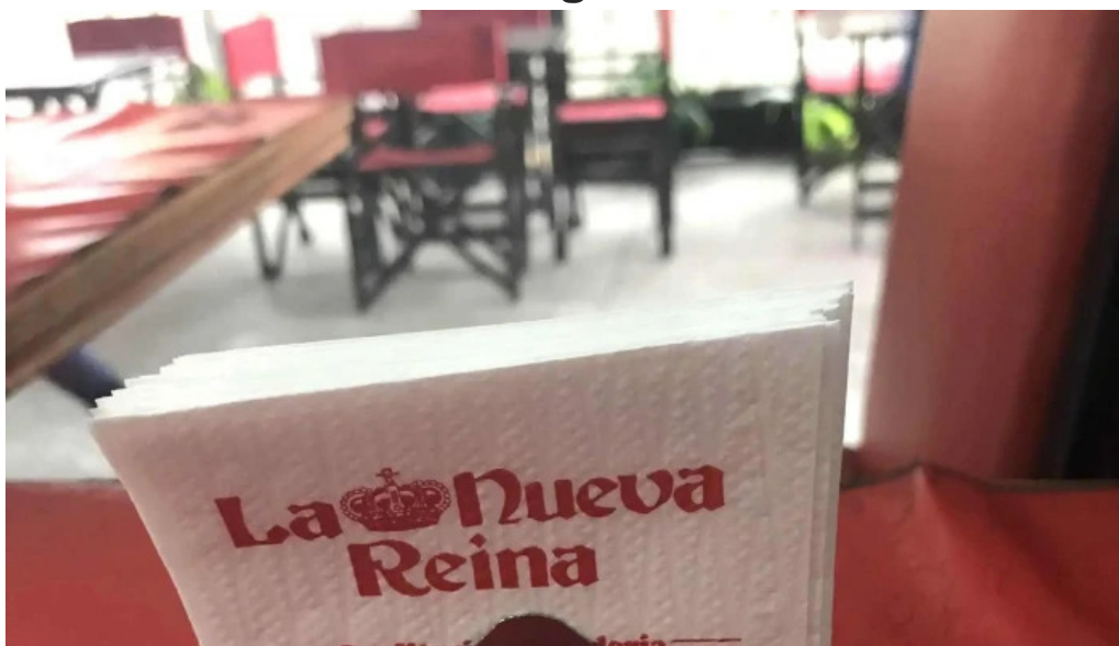
La nueva reina zona