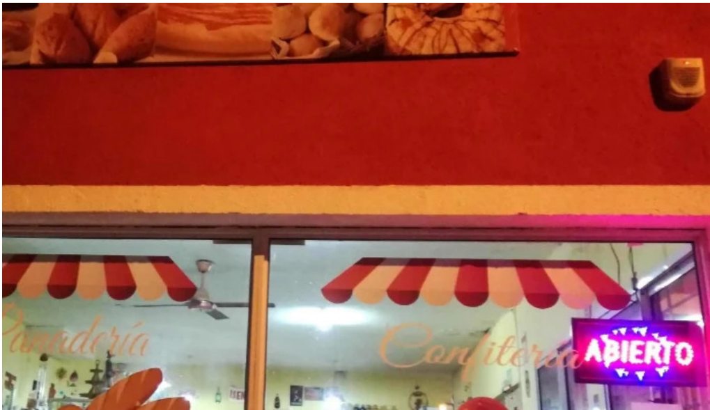
Panaderia la candela descuentos