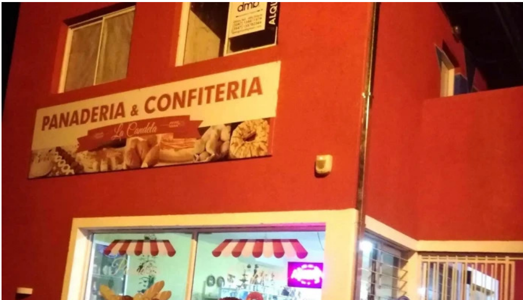
Panaderia la candela anisacate