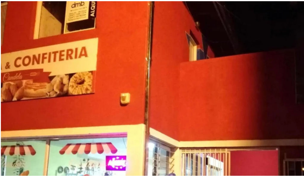
Panaderia la candela instagram