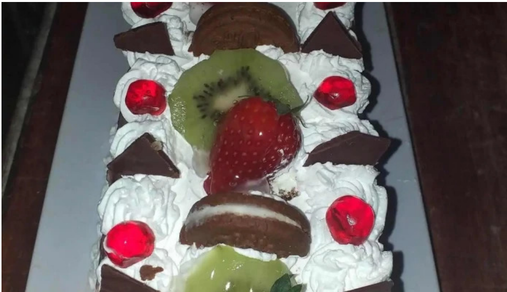
Panaderia la candela pastel