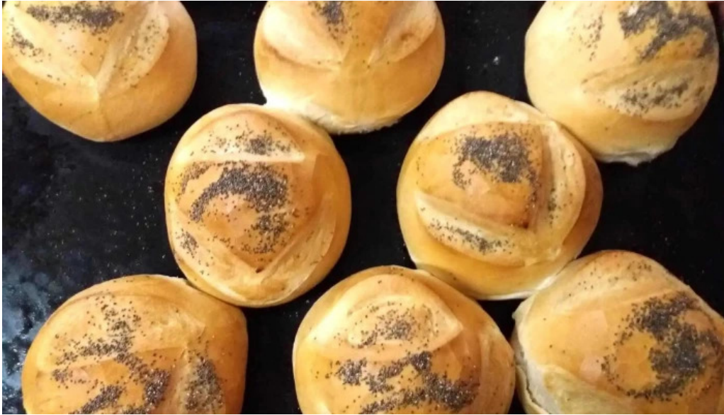
Panaderia la candela comida y bebida