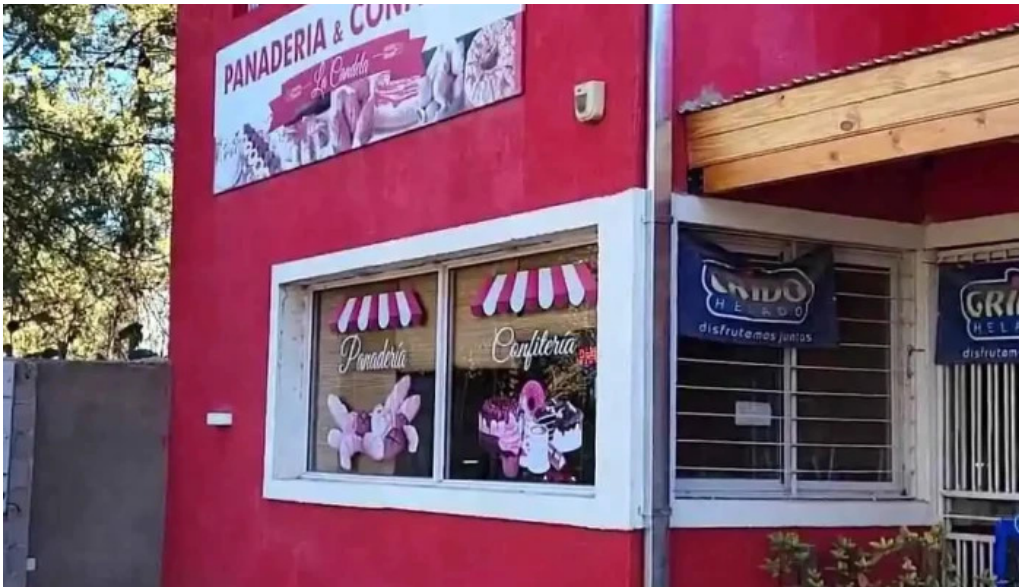
Panaderia la candela videos