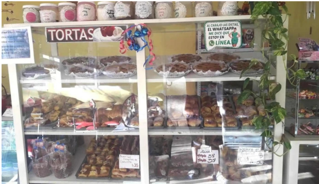
Panaderia la candela ambiente