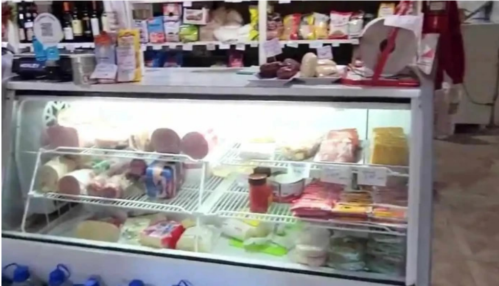
Panaderia la candela vitrina