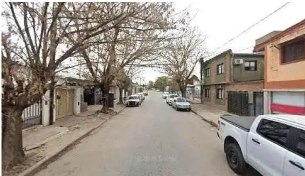
Mafalda panaderia horario