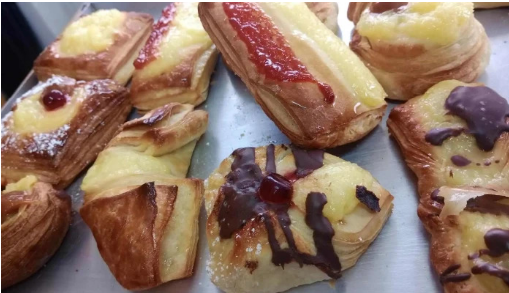
Mafalda panaderia comida y bebida