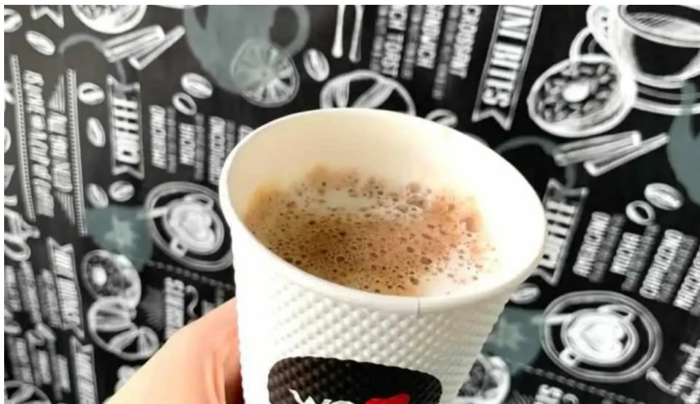
Mafalda panaderia menu