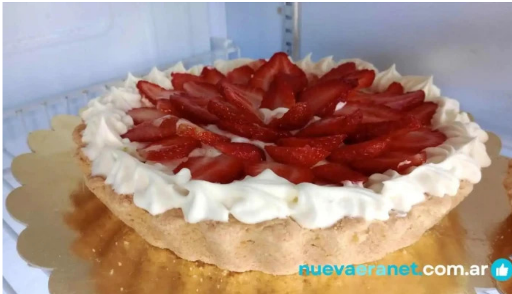
Mafalda panaderia alta gracia