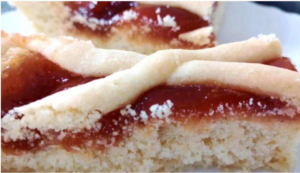
Mafalda panaderia del propietario