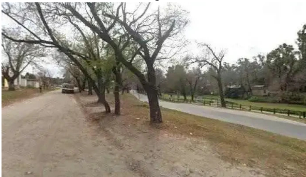
La costanera telefono