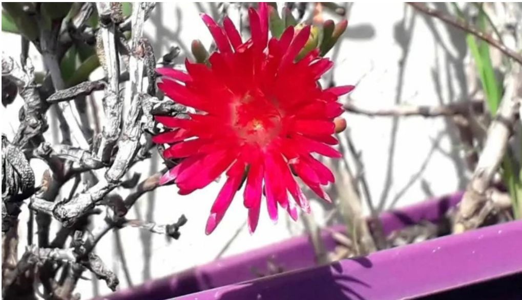
La costanera alta gracia