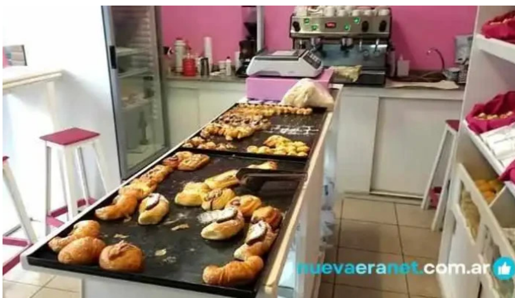
Anita panaderia cafe alta gracia