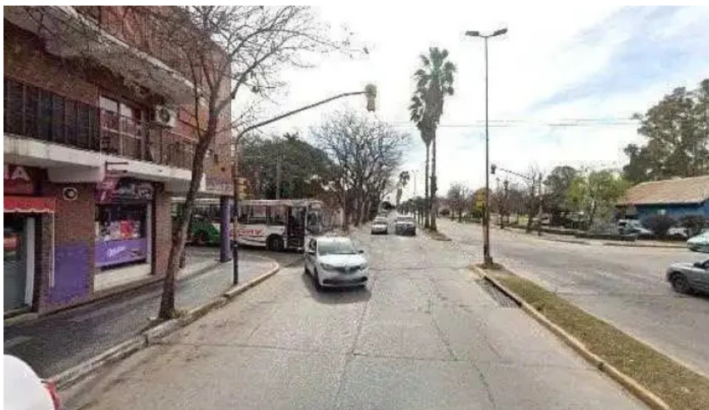
Anita panaderia cafe instagram