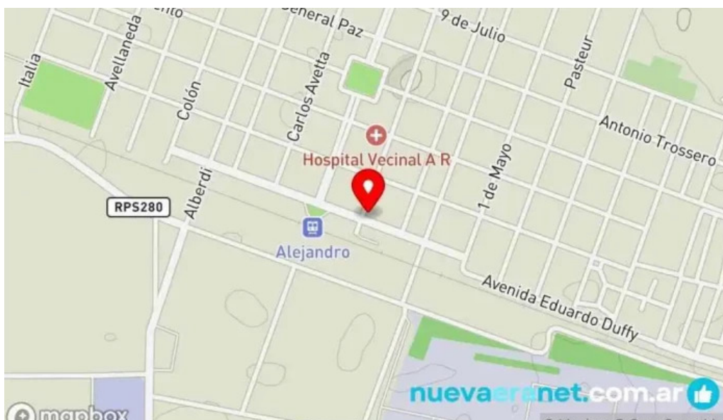
Panaderia alejandro roca