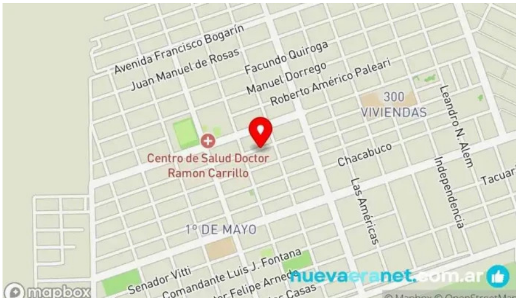
Panaderia la artesanal mapa