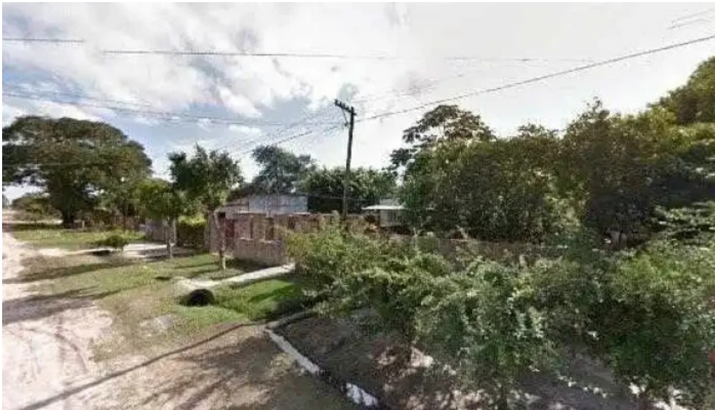
Panaderia la artesanal videosdeg