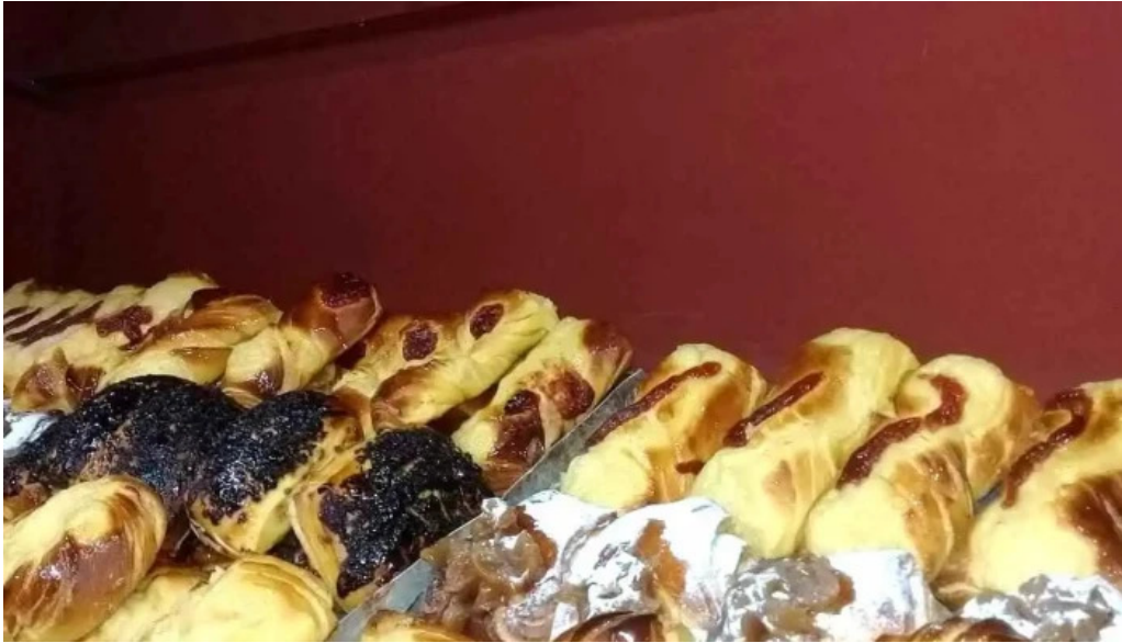
Panaderia la artesanal videos