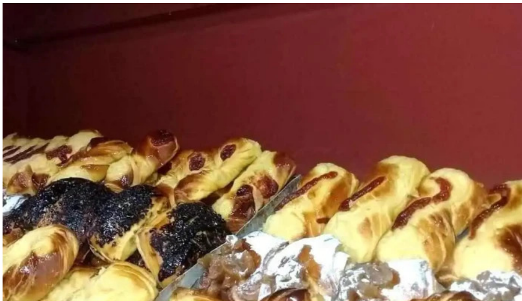
Panadería la artesanal clorinda