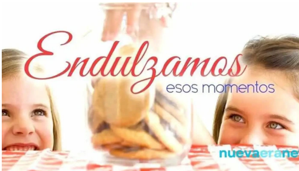
La bellvillense srl como llegar