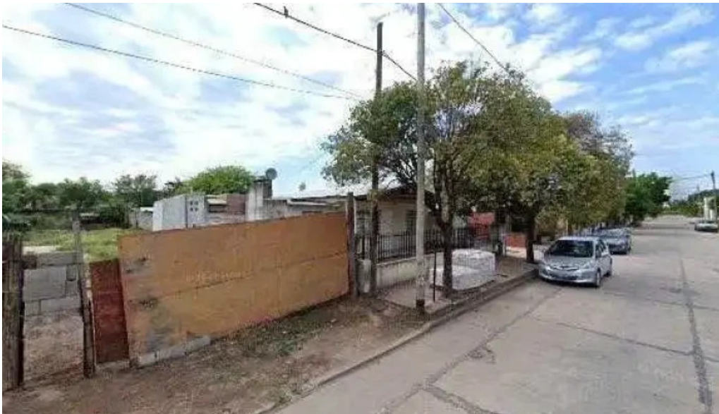
La bellvillense srl como llegardeg