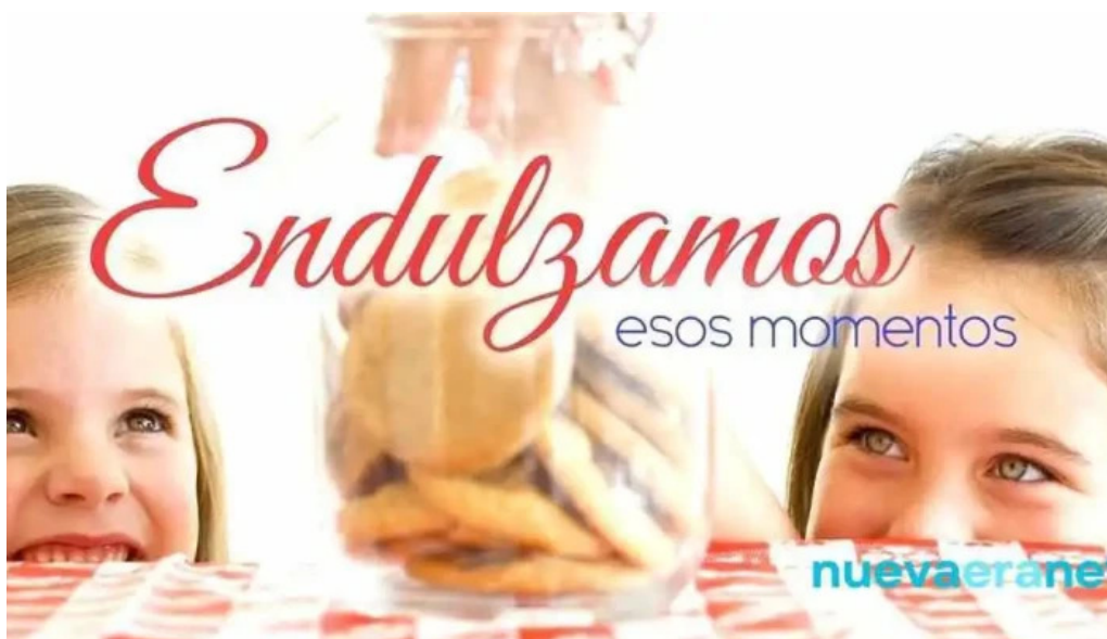
La bellvillense s r l bell ville