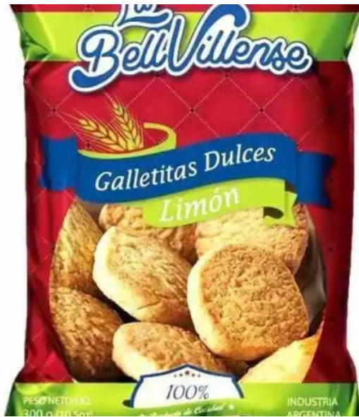
La bellvillense srl del propietario