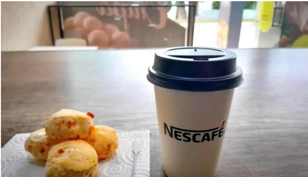
Chipa corazon de angel mas recientes