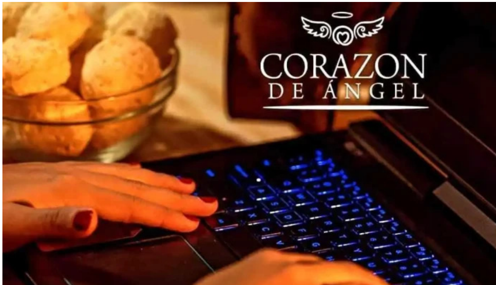
Chipa corazon de angel abierto ahora