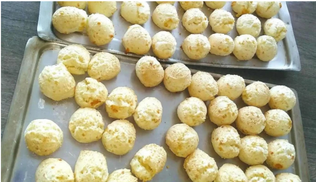
Chipa corazon de angel del propietario