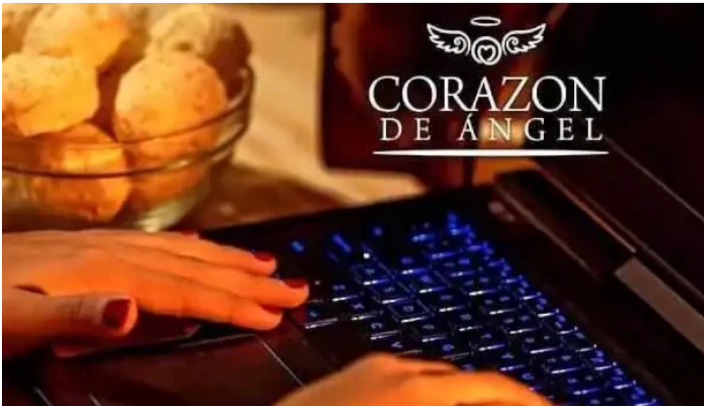
Chipa corazon de angel ? chajari