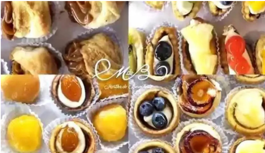
Martha de bianchetti videos